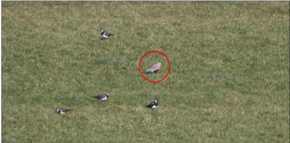
Abb. 4: 1 ad. Ind. Steppenkiebitz Vanellus gregarius in einem rastenden Trupp Kiebitze Vanellus vanellus ; Datum: 20.03.2018; Ort: Urbach

* Anmerkung: Am 28.03.2018 wurde am Bucher Stausee (AA) von mehreren Beobachtern ebenfalls ein Steppenkiebitz Vanellus gregarius beobachtet, möglicherweise das selbe Ind..