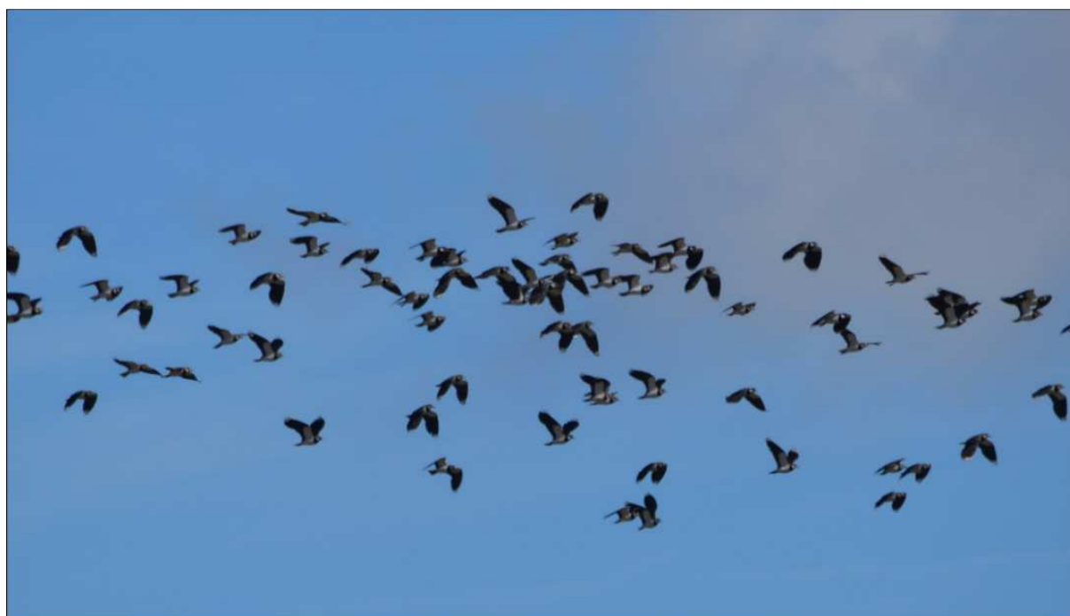
Abb. 3: 70 Ind. Kiebitze Vanellus vanellus ; Datum: 18.03.2018; Ort: Sachsenweiler