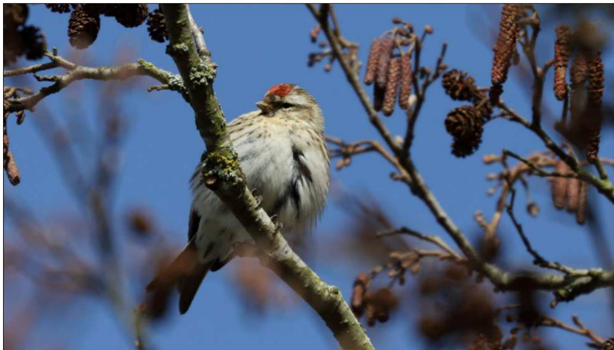
Abb. 6: 0.1 ad. Ind. Taigabirkenzeisig Carduelis flammea flammea in Ruhehaltung; Datum: 30.03.2018; Ort: Alfdorf