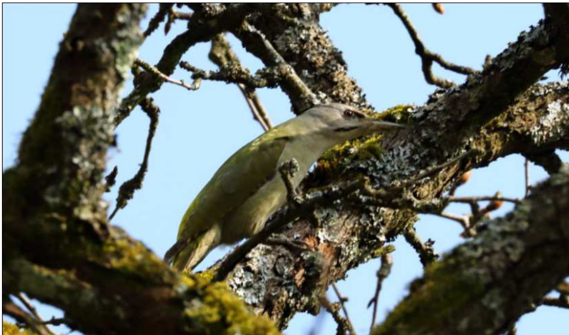
Abb. 5: 1.0 ad. Ind. Grauspecht Picus canus sichernd; Datum: 25.03.2018; Ort: Alfdorf