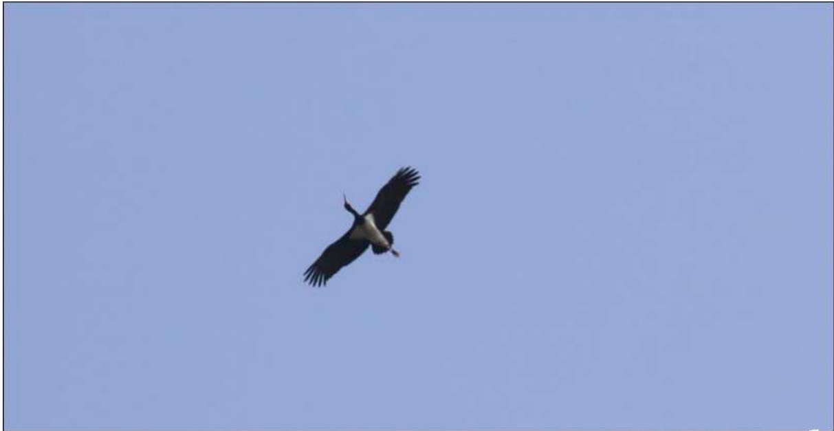
Abb. 1: 1 Ind. Schwarzstorch Ciconia nigra aufkreisend; Datum: 24.03.2018; Ort: Alfdorf