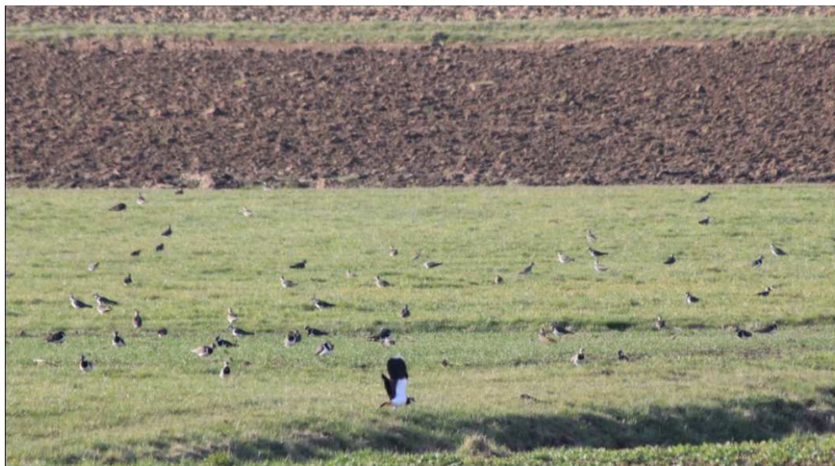
Abb. 2: Rastansammlung des Kiebitzes Vanellus vanellus ; Datum: 18.03.2018; Ort: Allmersbach