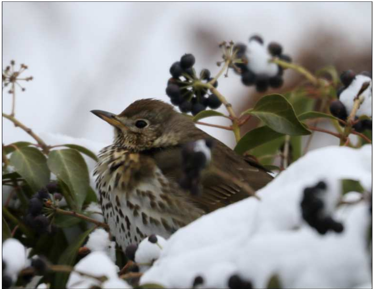
Titelphoto: 1 Ind. Singdrossel Turdus philomelos ; Datum: 18.03.2018; Ort: Alfdorf

Der monatliche Rundbrief der Ornithologischen Arbeitsgemeinschaft Rems-Murr-Kreis (OAG Rems-Murr-Kreis) innerhalb der Ornithologischen Gesellschaft Baden-Württemberg (OGBW) dient dem Informationsaustausch aller ornithologisch am Landkreis Rems-Murr Interessierten. Der Rundbrief stellt eine zitierbare Veröffentlichung dar (Zitiervorschlag: OAG Rems-Murr-Kreis (20..): Ornithologischer Rundbrief Rems-Murr-Kreis Nr...). Alle an die OAG Rems-Murr-Kreis und deren kreisweiten OGBW- und ornitho.de-Regionalkoordinatoren übermittelten Beobachtungsdaten, werden auf Plausibilität geprüft, bei kreisweiter Bedeutung im Rundbrief veröffentlicht und an die OGBW- und OAG-Datenbank zur weiteren Auswertung überstellt.