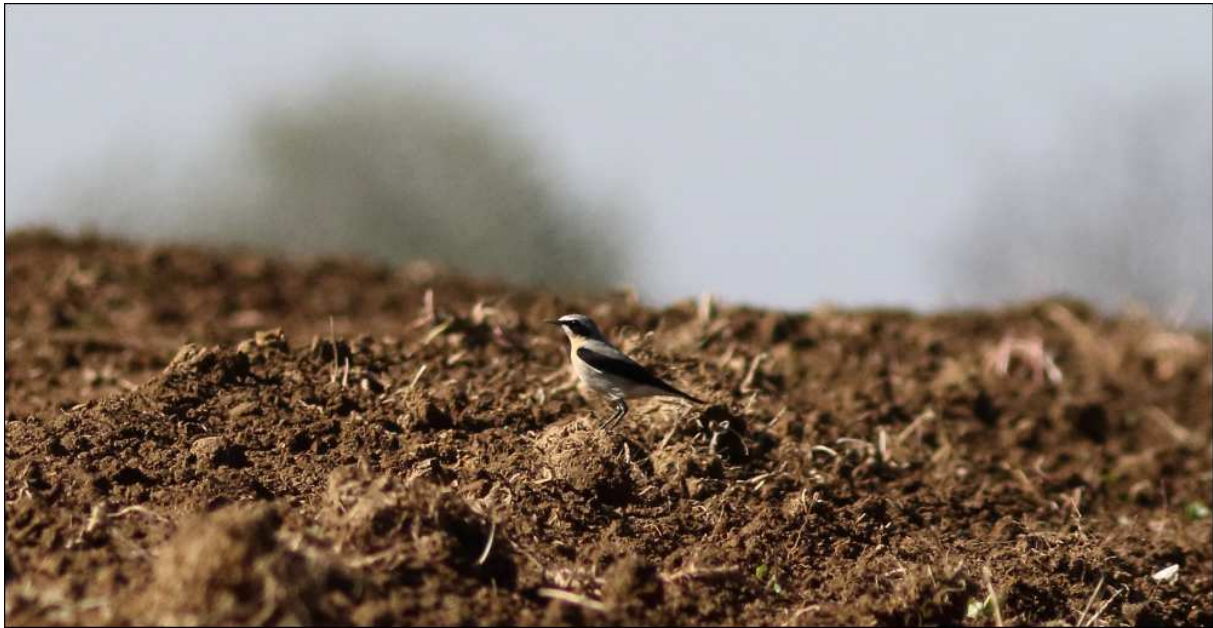
Abb. 3: 1.0 ad. Ind. Steinschmätzer Oenanthe oenanthe sichernd; Datum: 30.04.2017; Ort: Alfdorf