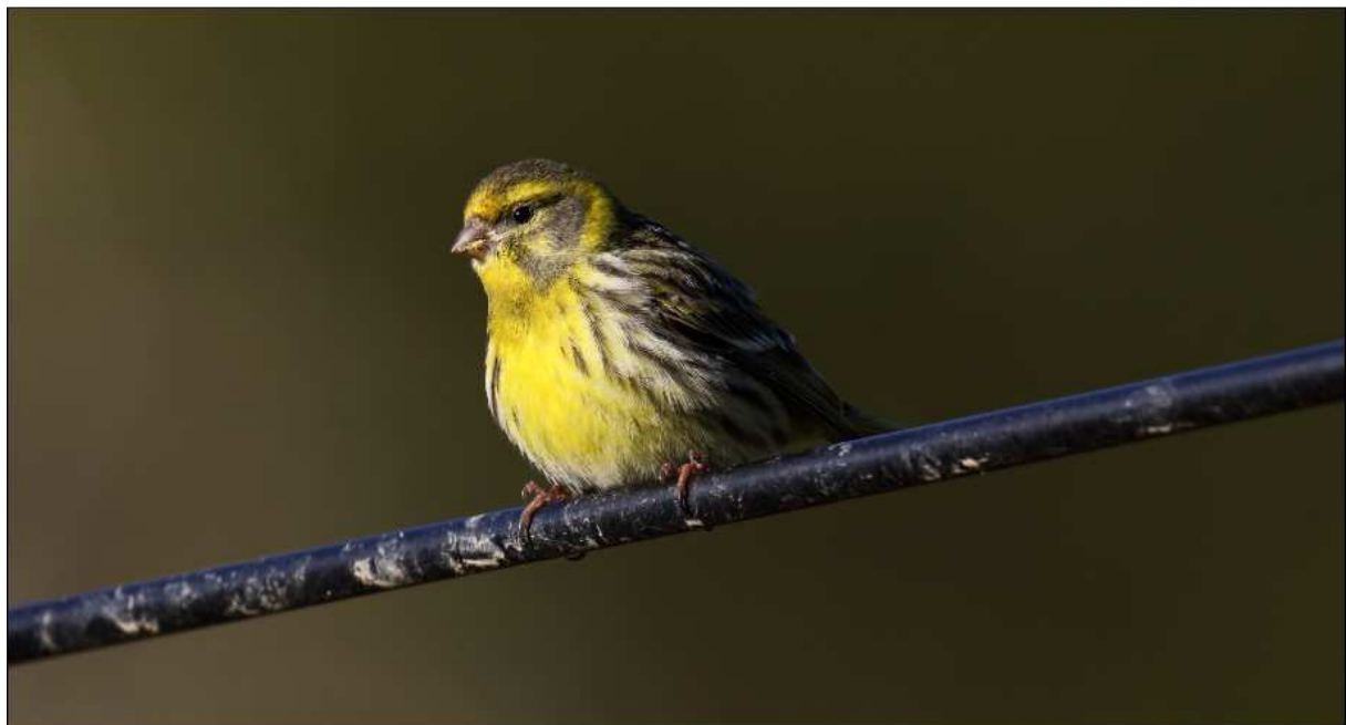
Abb. 5: 1.0 ad. Ind. Girlitz Serinus serinus ; Datum: 20.04.2017; Ort: Alfdorf