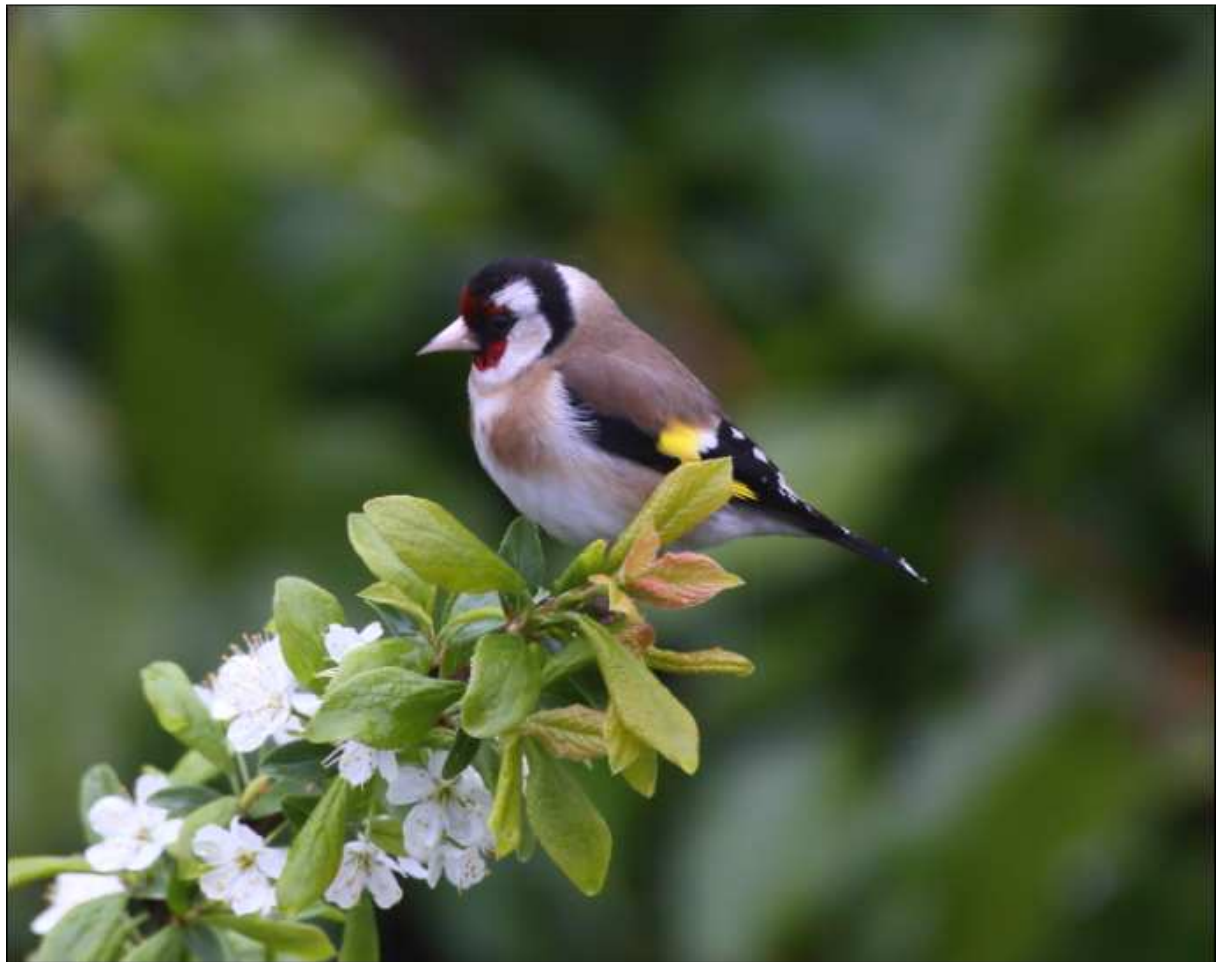
Titelphoto: 1 ad. Ind. Stiglitz Carduelis carduelis ; Datum: 17.04.2017; Ort: Alfdorf

Der monatliche Rundbrief der Ornithologischen Arbeitsgemeinschaft Rems-Murr-Kreis (OAG Rems-Murr-Kreis) innerhalb der Ornithologischen Gesellschaft Baden-Württemberg (OGBW) dient dem Informationsaustausch aller ornithologisch am Landkreis Rems-Murr Interessierten. Der Rundbrief stellt eine zitierbare Veröffentlichung dar (Zitiervorschlag: OAG Rems-Murr-Kreis (20..): Ornithologischer Rundbrief Rems-Murr-Kreis Nr...). Alle an die OAG Rems-Murr-Kreis und deren kreisweiten OGBW- und ornitho.de-Regionalkoordinatoren übermittelten Beobachtungsdaten, werden auf Plausibilität geprüft, bei kreisweiter Bedeutung im Rundbrief veröffentlicht und an die OGBW- und OAG-Datenbank zur weiteren Auswertung überstellt.