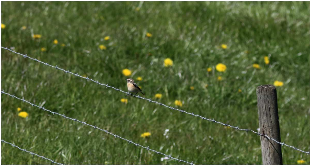
Abb. 2: 1.0 ad. Ind. Braunkehlchen Saxicola rubetra betreibt Wartenjagd von einem Weidezaun aus; Datum: 30.04.2017; Ort: Alfdorf