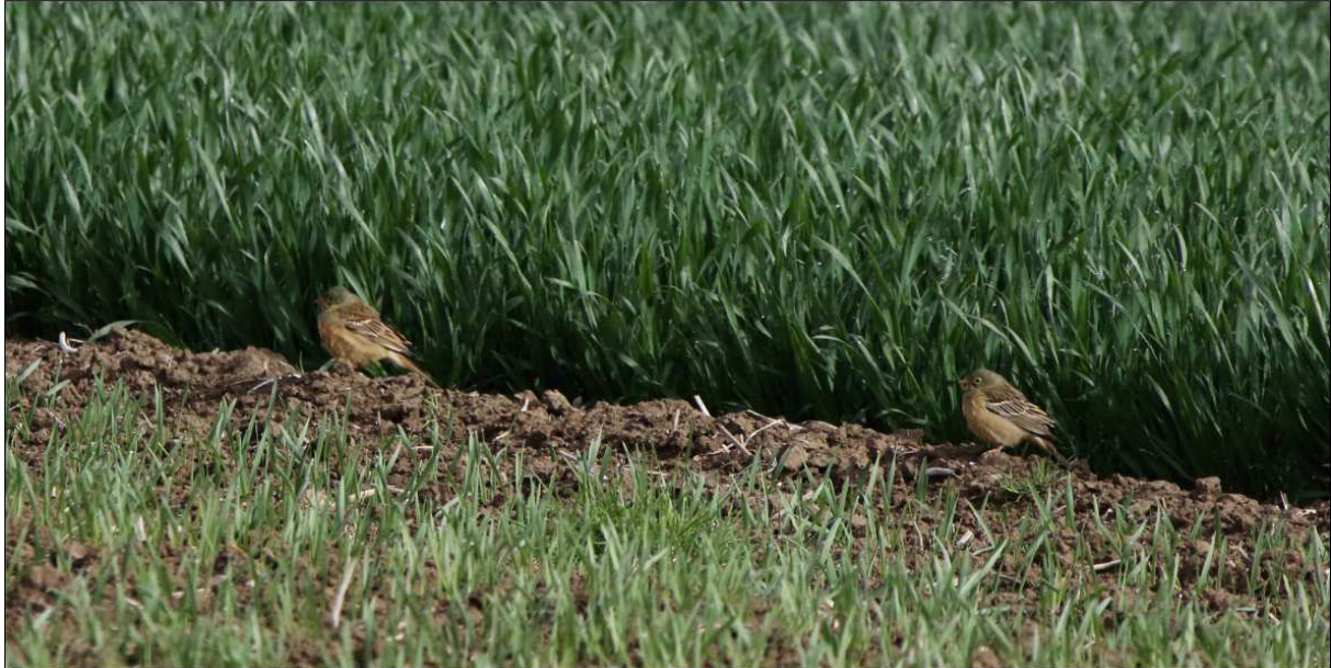
Abb. 6: 2.0 ad. Ind. Ortolane Emberiza hortulana auf einer Ackerfläche rastend; Datum: 23.04.2017; Ort: Enderbach