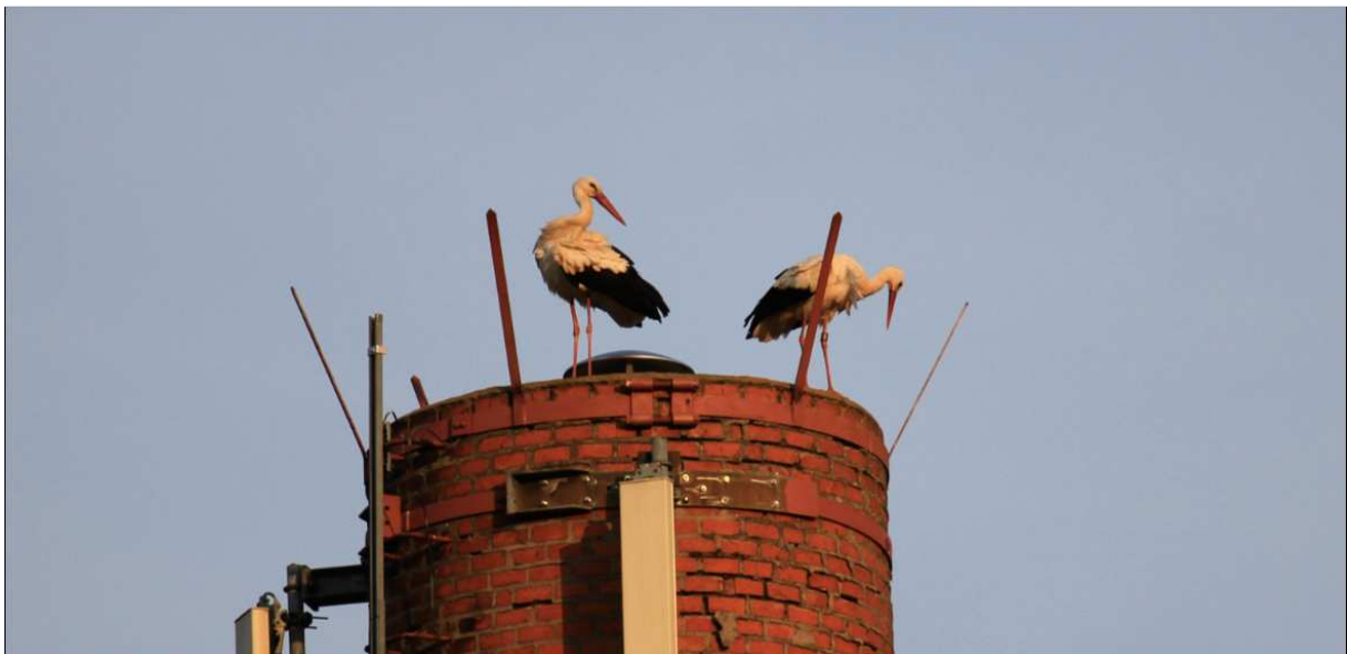
Abb. 7: 2 ad. Ind. Weißstörche Ciconia ciconia rastend und nächtigend auf dem Kamin der ehemaligen Textilfabrik Hornschuch. Beim rechten Ind. handelt es sich um das beringte Ind.; Datum: 01.04.2017; Ort: Urbach