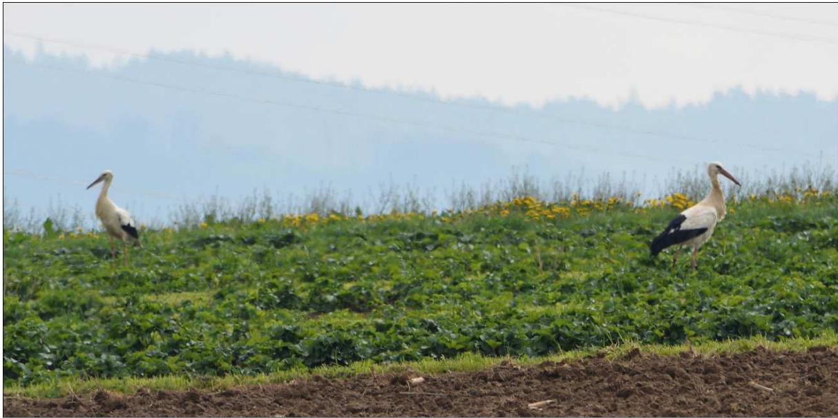
Abb. 1: 2 ad. Ind. Weißstörche Ciconia ciconia auf Nahrungssuche; Datum: 28.04.2017; Ort: Sachsenweiler