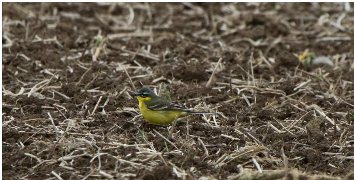
Abb. 4: 1.0 ad. Ind. Wiesenschafstelze Motacilla flava auf Nahrungssuche in einem Stoppelacker; Datum: 23.04.2017; Ort: Alfdorf