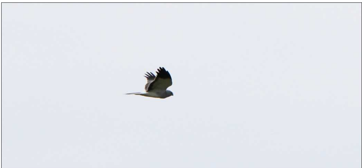
Abb. 2: 1.0 ad. Ind. Kornweihe Circus cyaneus im Streckenflug; Datum: 23.10.2016; Ort: Schölleshof