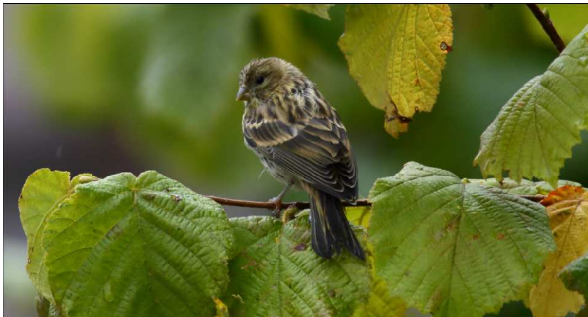
Abb. 5: 1 dj. Ind. Girlitz Serinus serinus sichernd; Datum: 03.10.2016; Ort: Alfdorf