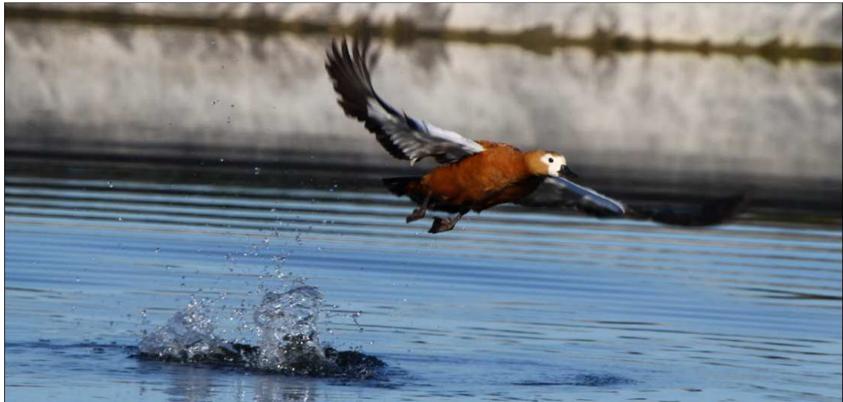
Abb. 1: 0.1 ad. Ind. Rostgans Tadorna ferruginea. Man beachte die starke Verformung der äußeren Handschwingen beim Auffliegen von der Wasseroberfläche im aktiven Schlafzug; Datum: 30.10.2016; Ort: Alfdorf