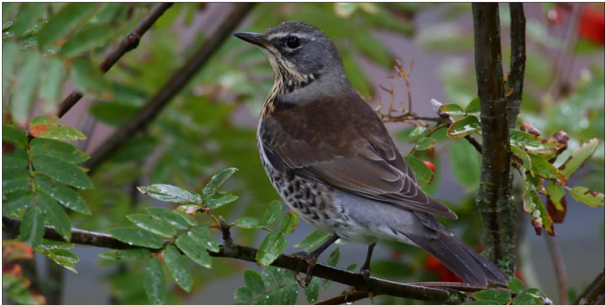
Abb. 4: 1 dj. Ind. Wacholderdrossel Turdus pilaris sichernd; Datum: 03.10.2016; Ort: Alfdorf