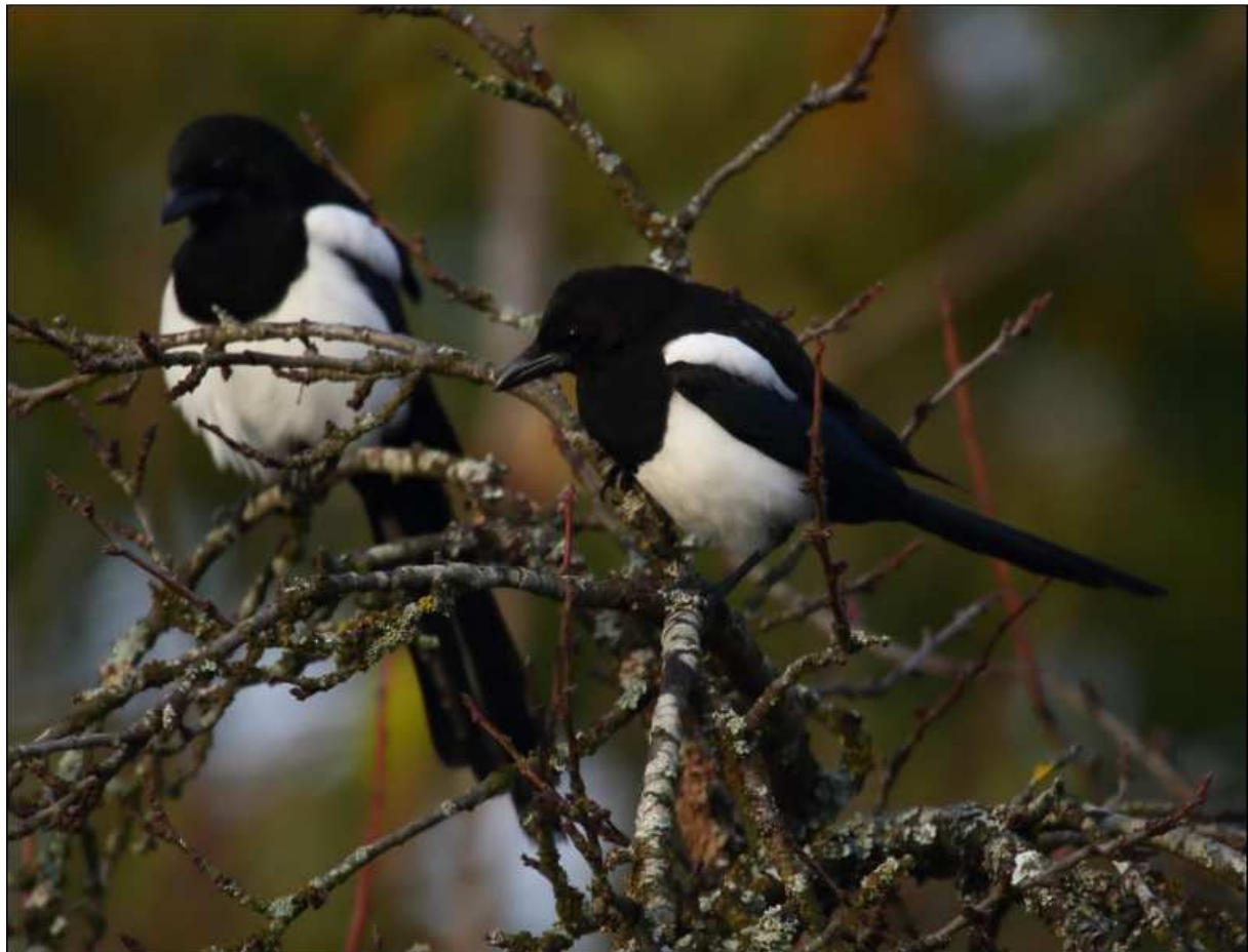
Titelphoto: 2 Ind. Elstern Pica pica ; Datum: 23.10.2016; Ort: Alfdorf

Der monatliche Rundbrief der Ornithologischen Arbeitsgemeinschaft Rems-Murr-Kreis ( OAG Rems-Murr-Kreis ) innerhalb der Ornithologischen Gesellschaft Baden-Württemberg ( OGBW ) dient dem Informationsaustausch aller ornithologisch am Landkreis Rems-Murr Interessierten. Der Rundbrief stellt eine zitierbare Veröffentlichung dar (Zitiervorschlag: OAG Rems-Murr-Kreis (20..): Ornithologischer Rundbrief Rems-Murr-Kreis Nr...). Alle an die OAG Rems-Murr-Kreis und deren kreisweiten OGBW- und ornitho.de-Regionalkoordinatoren übermittelten Beobachtungsdaten, werden auf Plausibilität geprüft, bei kreisweiter Bedeutung im Rundbrief veröffentlicht und an die OGBW- und OAG-Datenbank zur weiteren Auswertung überstellt.