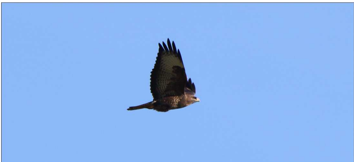
Abb. 3: 1 ad. Ind. Mäusebussard Buteo buteo im aktiven Schlagflug; Datum: 30.10.2016; Ort: Alfdorf