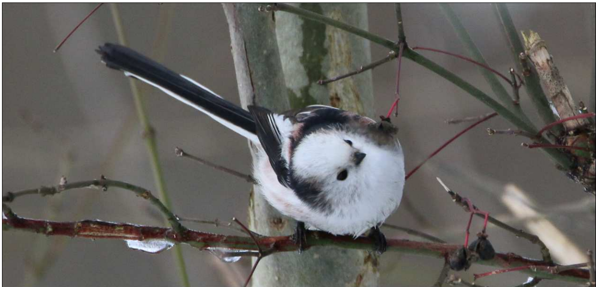
Abb. 3: 1 ad. Ind. Schwanzmeise Aegithalos caudatus europaeus ; Datum: 15.02.2016; Ort: Plüderhausen