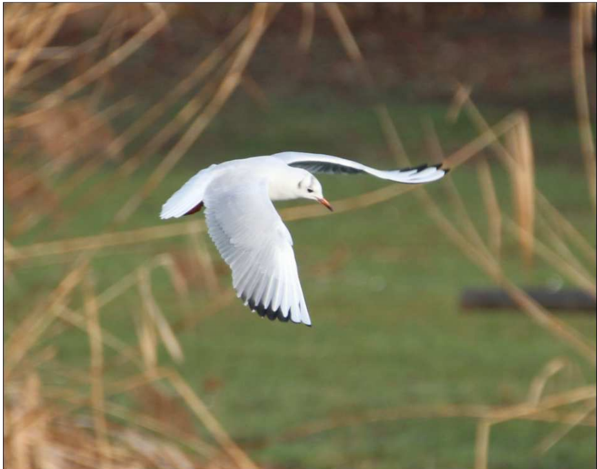
Titelphoto: 1 ad. Ind. Lachmöwe Chroicocephalus ridibundus im SK; Datum: 06.02.2016; Ort: Plüderhausen

Der monatliche Rundbrief der Ornithologischen Arbeitsgemeinschaft Rems-Murr-Kreis ( OAG Rems-Murr-Kreis ) innerhalb der Ornithologischen Gesellschaft Baden-Württemberg ( OGBW ) dient dem Informationsaustausch aller ornithologisch am Landkreis Rems-Murr Interessierten. Der Rundbrief stellt eine zitierbare Veröffentlichung dar (Zitiervorschlag: OAG Rems-Murr-Kreis (20..): Ornithologischer Rundbrief Rems-Murr-Kreis Nr.). Alle an die OAG Rems-Murr-Kreis und deren kreisweiten OGBW- und ornitho.de-Regionalkoordinatoren übermittelten Beobachtungsdaten, werden auf Plausibilität geprüft, bei kreisweiter Bedeutung im Rundbrief veröffentlicht und an die OGBW- und OAG-Datenbank zur weiteren Auswertung überstellt.