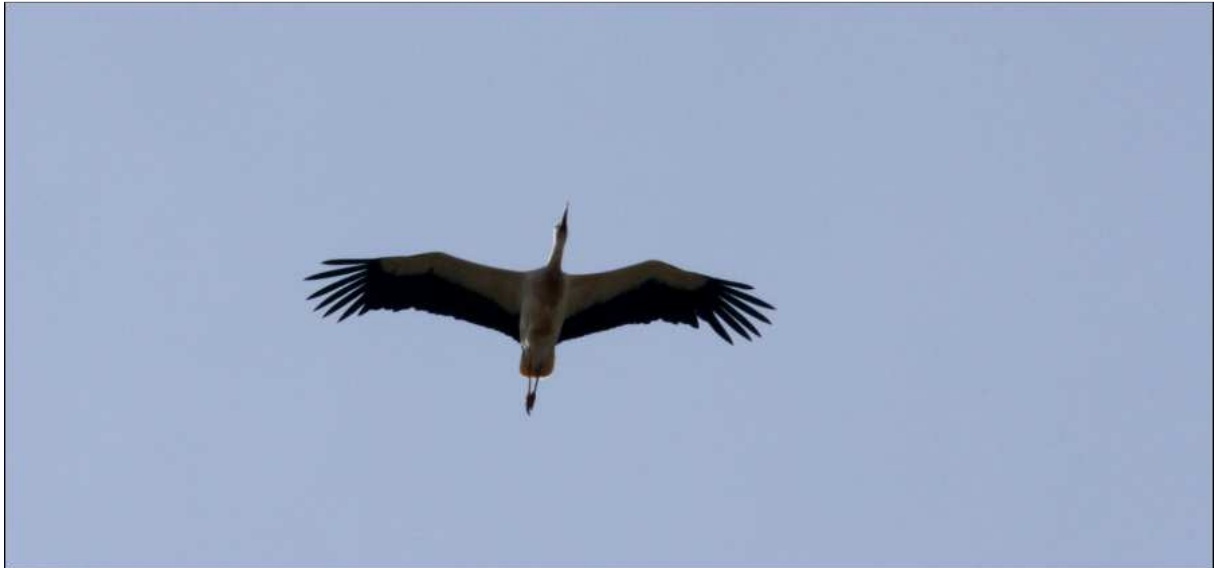
Abb. 1: 1 ad. Ind. Weißstorch Ciconia ciconia im Gleitflug; Datum: 26.02.2016; Ort: Urbach