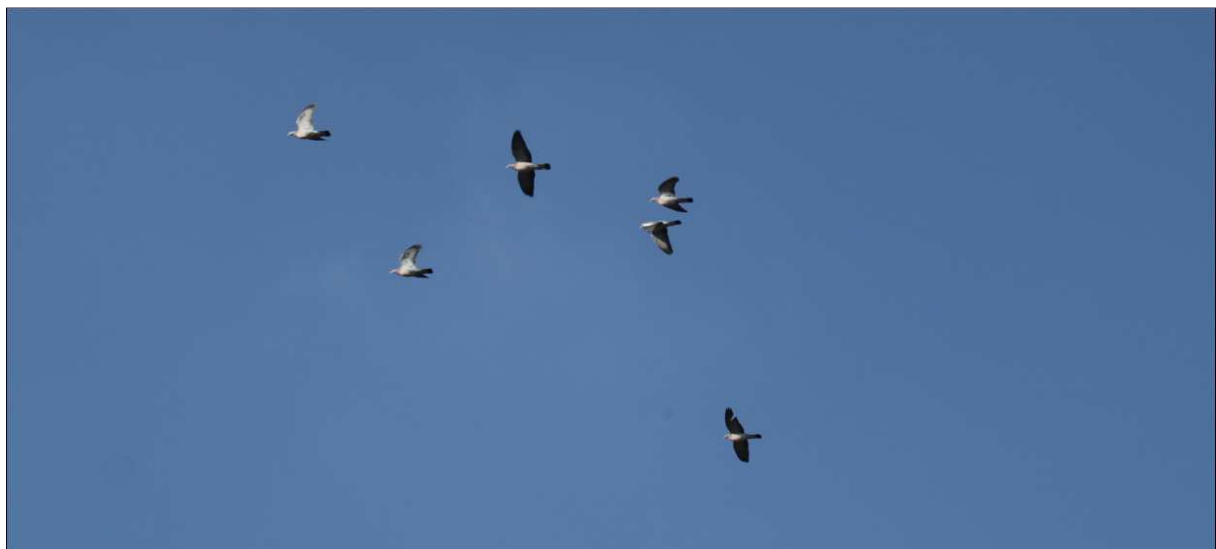
Abb. 2: 6 Ind. Ringeltaube Columba palumbus im Streckenflug; Datum: 19.02.2016; Ort: Urbach