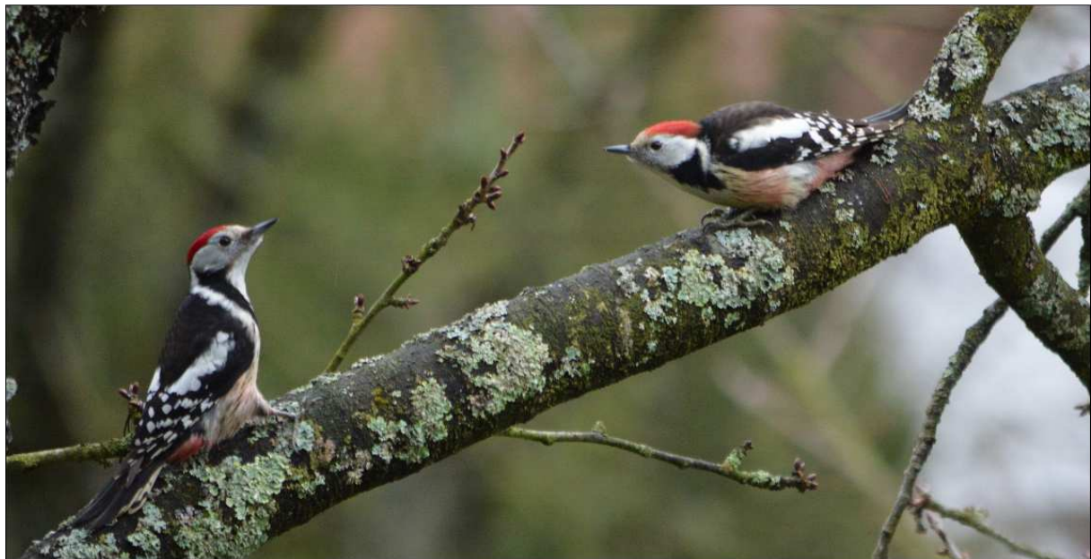
Abb. 2: 1.1 ad. Ind. Mittelspecht Dendrocopos medius in Dominanz- und Beschwichtigungshaltung; Datum: 28.01.2016; Ort: Sachsenweiler