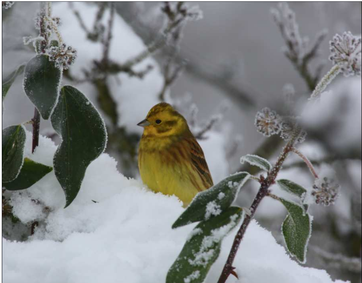
Titelphoto: 1.0 ad. Ind. Goldammer Emberiza citrinella ; Datum: 20.01.2016; Ort: Alfdorf

Der monatliche Rundbrief der Ornithologischen Arbeitsgemeinschaft Rems-Murr-Kreis ( OAG Rems-Murr-Kreis ) innerhalb der Ornithologischen Gesellschaft Baden-Württemberg ( OGBW ) dient dem Informationsaustausch aller ornithologisch am Landkreis Rems-Murr Interessierten. Der Rundbrief stellt eine zitierbare Veröffentlichung dar (Zitiervorschlag: OAG Rems-Murr-Kreis (20..): Ornithologischer Rundbrief Rems-Murr-Kreis Nr.). Alle an die OAG Rems-Murr-Kreis und deren kreisweiten OGBW- und ornitho.de-Regionalkoordinatoren übermittelten Beobachtungsdaten, werden auf Plausibilität geprüft, bei kreisweiter Bedeutung im Rundbrief veröffentlicht und an die OGBW- und OAG-Datenbank zur weiteren Auswertung überstellt.