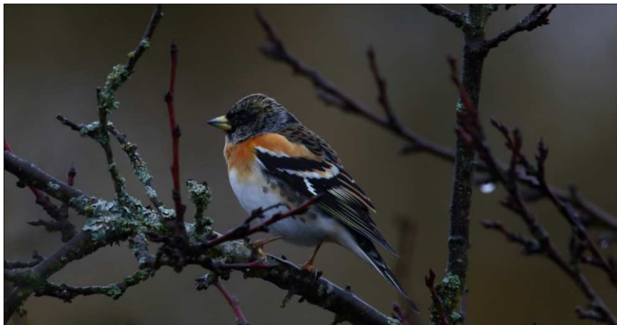
Abb. 4: 1.0 ad. Ind. Bergfink Fringilla montifringilla ; Datum: 02.01.2016; Ort: Alfdorf