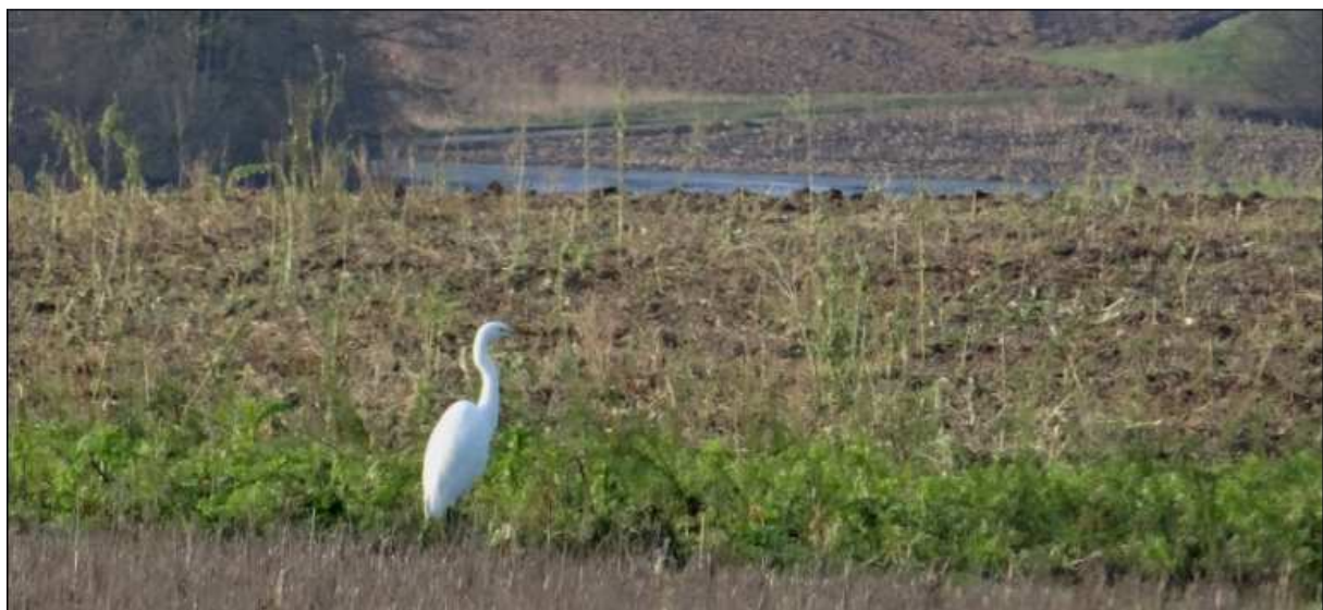
Abb. 1: 1 Ind. Silberreiher Casmerodius albus feldernd; Datum: 29.01.2016; Ort: Hertmannsweiler