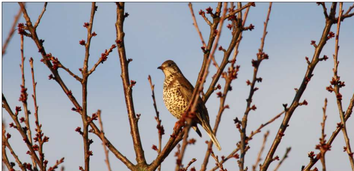
Abb. 3: 1 Ind. Misteldrossel Turdus viscivorus sichernd; Datum: 30.01.2016; Ort: Alfdorf