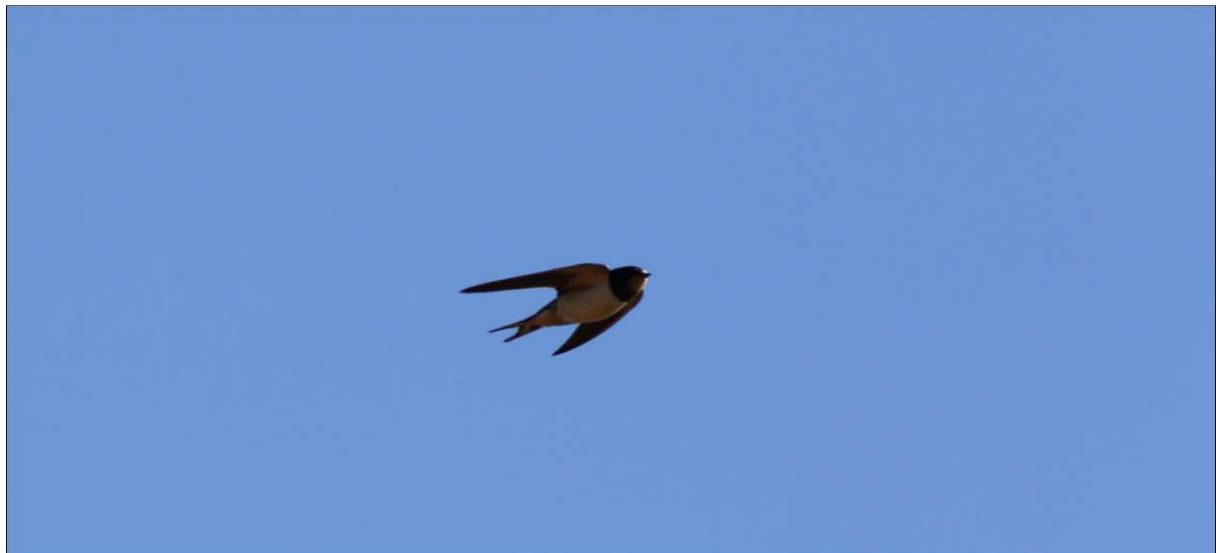
Abb. 5: 1 dj. Ind. Rauchschwalbe Hirundo rustica im Streckenflug; Datum: 21.09.2015; Ort: Alfdorf