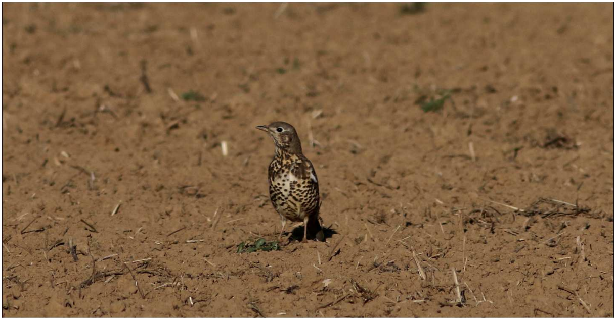
Abb. 6: 1 Ind. der Misteldrossel Turdus viscivorus auf Nahrungssuche; Datum: 30.09.2015; Ort: Alfdorf