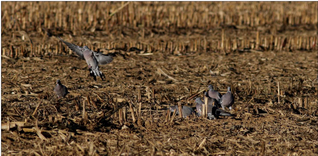
Abb. 4: 7 ad. Ind. u. 1 dj. Ind. Ringeltaube Columba palumbus feldernd; Datum: 30.09.2015; Ort: Alfdorf