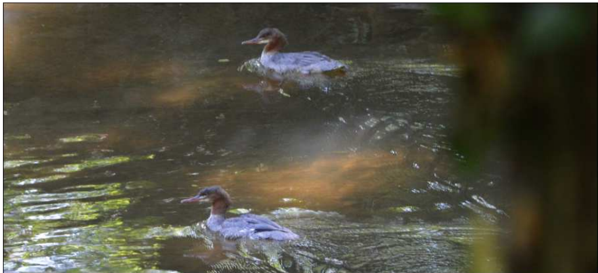
Abb. 2: 2 dj. Ind. Gänsesäger Mergus merganser ; Eines der wenigen Photos, das darauf hindeutet, dass sich auch diesjährige Ind. zu dieser Jahreszeit im NSG Unteren Remstal aufhalten; Datum: 30.09.2015; Ort: NSG Unteres Remstal