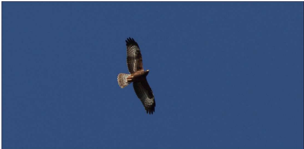
Abb. 3: 1 dj. Ind. Wespenbussard Pernis apivorus der dunklen Morphe im Segelflug; Datum: 09.09.2015; Ort: Alfdorf