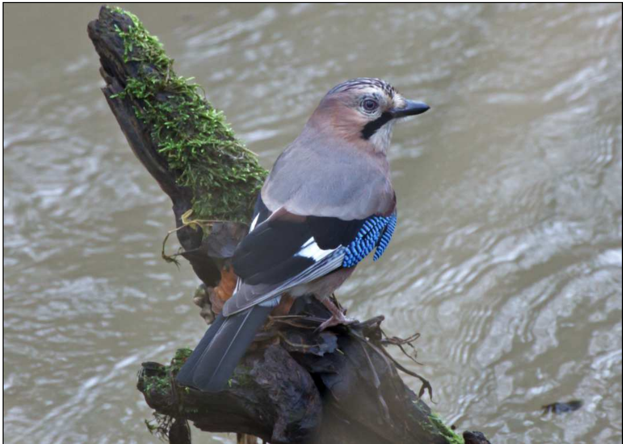
Titelphoto: 1 Ind. Eichelhäher Garrulus glandarius sichernd; Datum: 31.12.2014; Ort: Backnang

Der monatliche Rundbrief der Ornithologischen Arbeitsgemeinschaft Rems-Murr-Kreis (OAG Rems-Murr-Kreis) innerhalb der Ornithologischen Gesellschaft Baden-Württemberg (OGBW) dient dem Informationsaustausch aller ornithologisch am Landkreis Rems-Murr Interessierten. Er stellt keine formale Veröffentlichung dar und ist somit nicht wissenschaftlich zitierbar. Alle an die OGBW-Regionalkoordinatoren Rems-Murr-Kreis übermittelten Beobachtungsdaten, werden auf Plausibilität geprüft, bei kreisweiter Bedeutung im Rundbrief veröffentlicht und an die Dokumentationsstelle für die Avifauna Baden-Württemberg zur weiteren Auswertung überstellt.