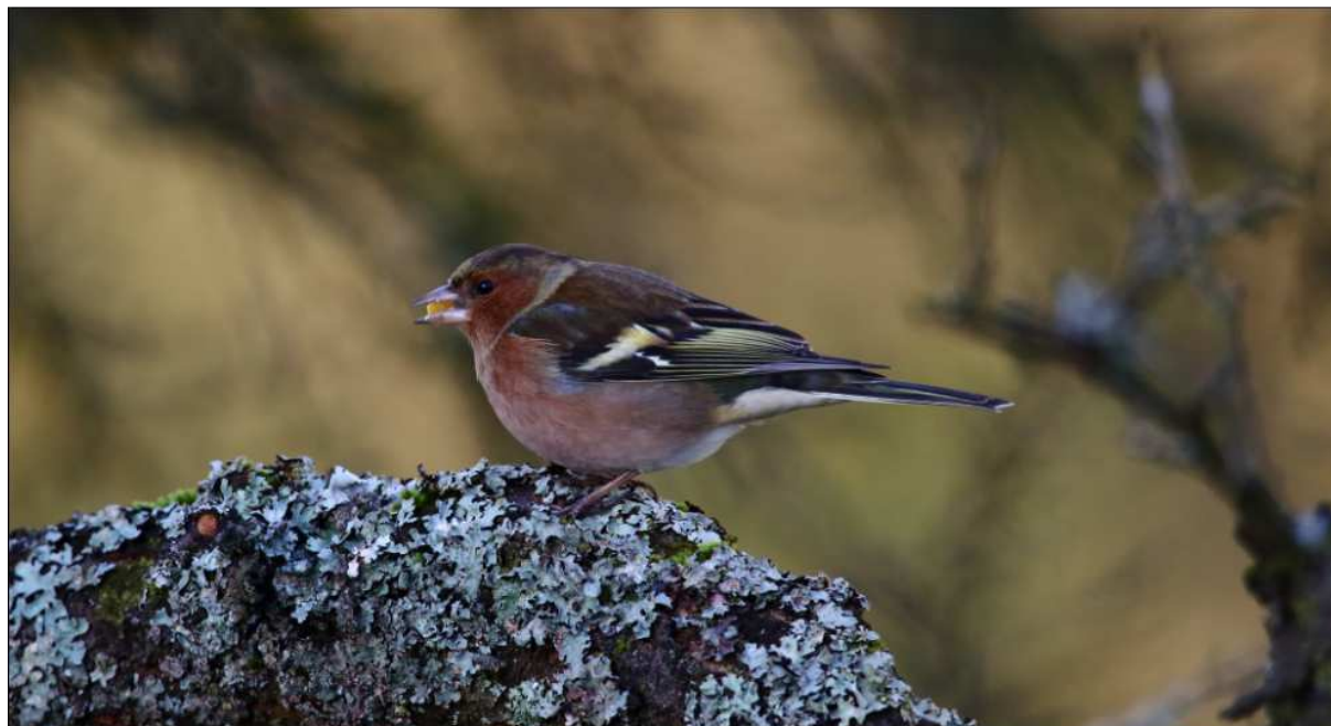
Abb. 4: 1.0 ad. Ind. Buchfink Fringilla coelebs im SK; Datum: 23.12.2014; Ort: Alfdorf