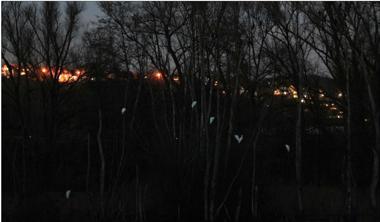
Abb. 2: 7 Ind. Silberreiher Ardea alba am Schlafplatz; Datum: 23.12.2014; Ort: NSG Lorcher Baggerseen (AA)