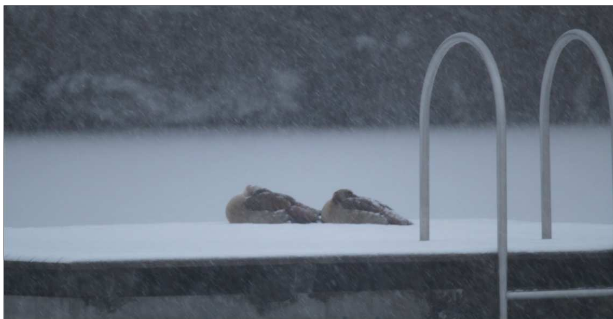
Abb. 1: 1.1 ad Ind. Nilgänse Alopochen aegyptiacus in Ruhehaltung, zur besseren Thermoregulation bei starkem Schneefall und kühlen Temperaturen. Die Nilgänse Alopochen aegyptiacus als afrotropisches Faunenelement ist in Mitteleuropa sehr winterhart; Datum: 29.12.2014; Ort: Plüderhausen