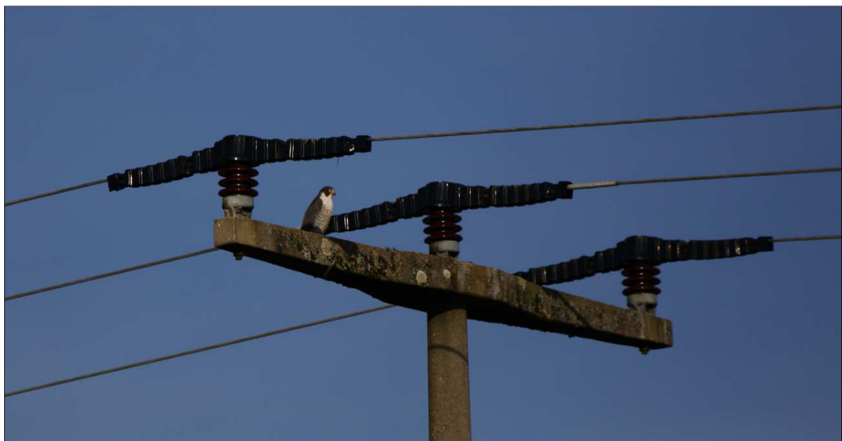
Abb. 2: 1.0 ad. Ind. Wanderfalke Falco peregrinus ; Datum: 09.11.2014; Ort: Alfdorf