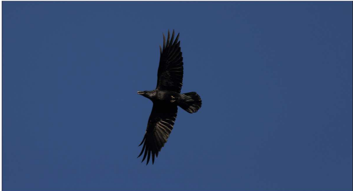
Abb. 4: 1 Ind. Kollkrabe Corvus corax im Segelflug; Datum: 23.11.2014; Ort: Alfdorf