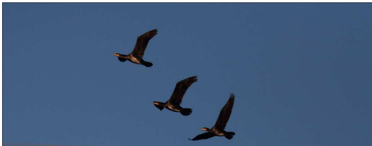
Abb. 1: 3 imma. Ind. Kormoran Phalacrocorax carbo ; Datum: 23.11.2014; Ort: Leineckstausee (WN)