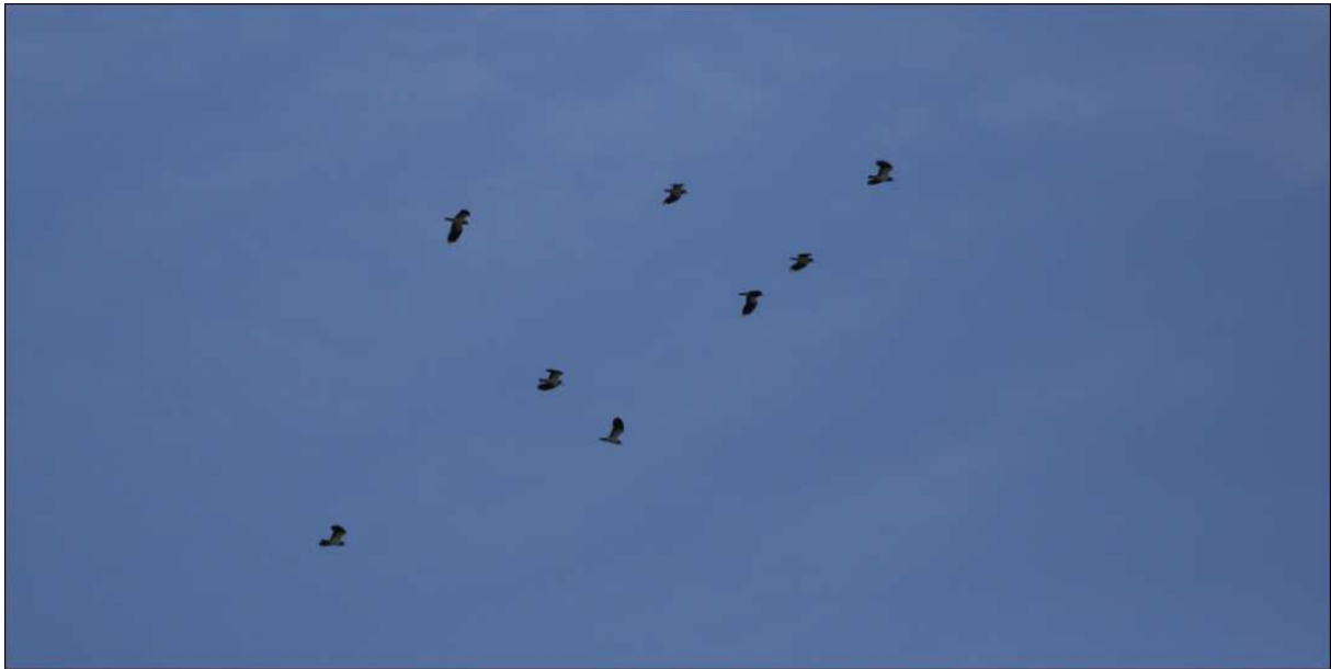
Abb. 3: 8 Ind. Kiebitze Vanellus vanellus im aktiven Schlagflug; Datum: 02.11.2014; Ort: Enderbach