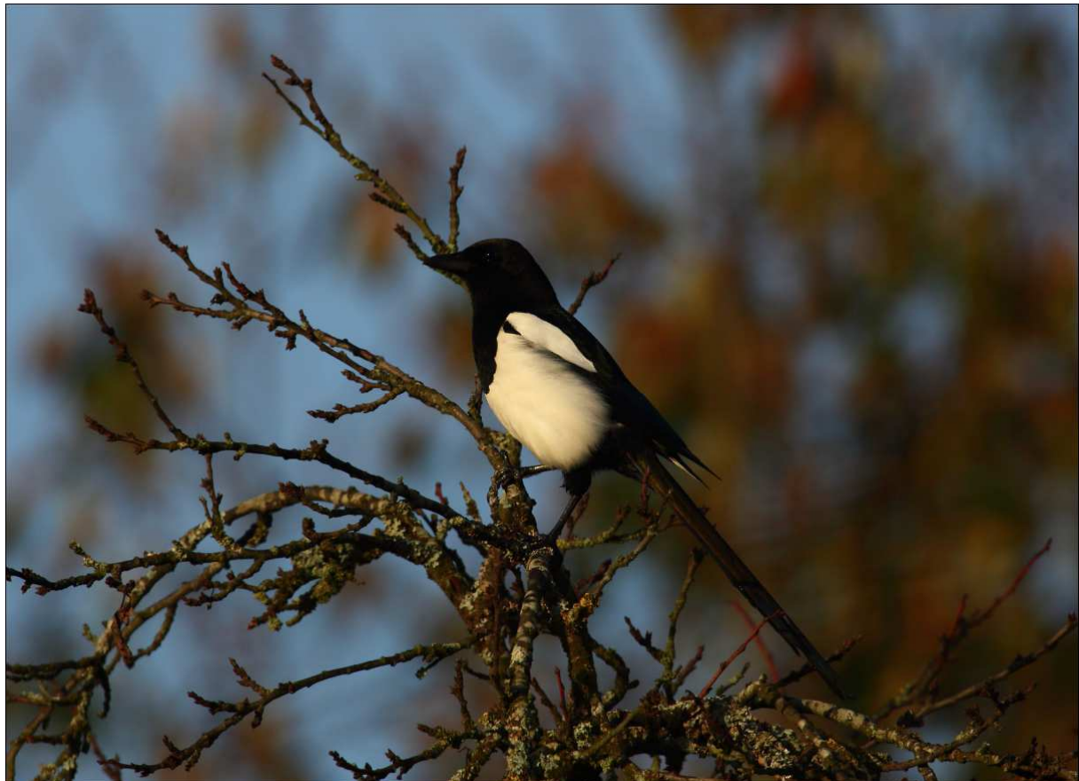
Titelphoto: 1 Ind. Elster Pica pica ; Datum: 02.11.2014; Ort: Alfdorf

Der monatliche Rundbrief der Ornithologischen Arbeitsgemeinschaft Rems-Murr-Kreis (OAG Rems-Murr-Kreis) innerhalb der Ornithologischen Gesellschaft Baden-Württemberg (OGBW) dient dem Informationsaustausch aller ornithologisch am Landkreis Rems-Murr Interessierten. Er stellt keine formale Veröffentlichung dar und ist somit nicht wissenschaftlich zitierbar. Alle an die OGBW-Regionalkoordinatoren Rems-Murr-Kreis übermittelten Beobachtungsdaten, werden auf Plausibilität geprüft, bei kreisweiter Bedeutung im Rundbrief veröffentlicht und an die Dokumentationsstelle für die Avifauna Baden-Württemberg zur weiteren Auswertung überstellt.