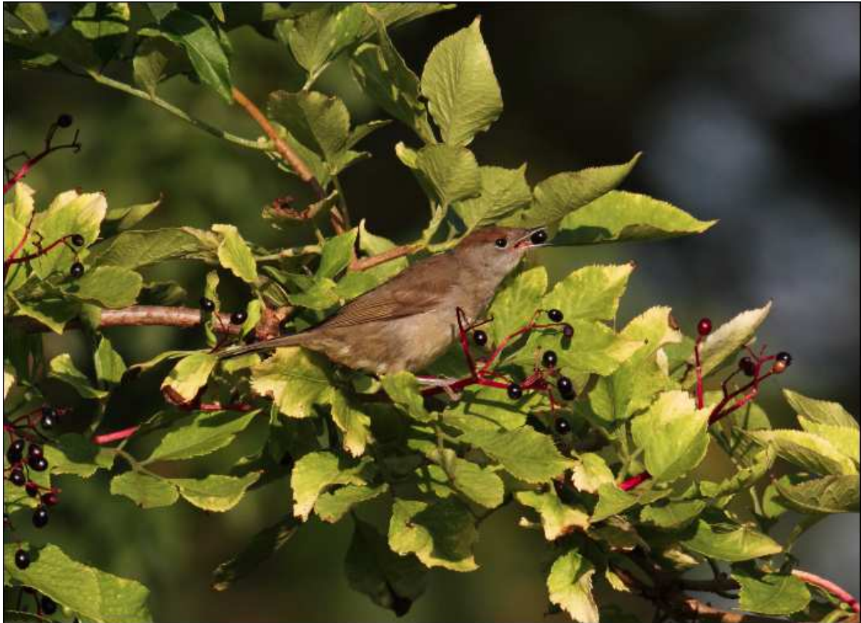
Titelphoto: 0.1 ad. Ind. Mönchsgrasmücke Sylvia atricapilla beim Verzehr von Beeren des Holunders Sambucus spec. Datum: 08.08.2014; Ort: Alfdorf

Der monatliche Rundbrief der Ornithologischen Arbeitsgemeinschaft Rems-Murr-Kreis ( OAG Rems-Murr-Kreis ) innerhalb der Ornithologischen Gesellschaft Baden-Württemberg ( OGBW ) dient dem Informationsaustausch aller ornithologisch am Landkreis Rems-Murr Interessierten. Er stellt keine formale Veröffentlichung dar und ist somit nicht wissenschaftlich zitierbar. Alle an die OGBW-Regionalkoordinatoren Rems-Murr-Kreis übermittelten Beobachtungsdaten, werden auf Plausibilität geprüft, bei kreisweiter Bedeutung im Rundbrief veröffentlicht und an die Dokumentationsstelle für die Avifauna Baden-Württemberg zur weiteren Auswertung überstellt.