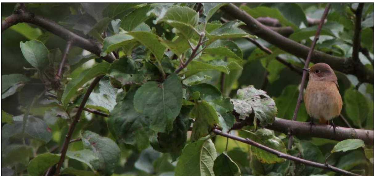
Abb. 4: 0.1 ad. Ind. Gartenrotschwanz Phoenicurus phoenicurus auf Warte; Datum: 24.08.2014; Ort: Alfdorf