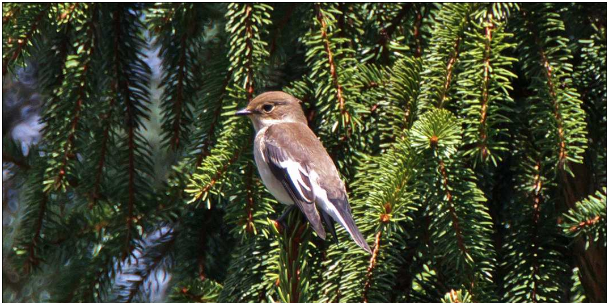
Abb. 2: 0.1 ad. Ind. Trauerschnäpper Ficedula hypoleuca auf Warte; Datum: 28.08.2014; Ort: Warthof