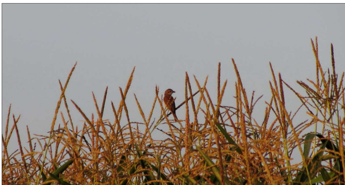
Abb. 1: 1 dj. Ind. Neuntöter Lanius collurio auf Warte in einem Maisfeld; Datum: 07.08.2014; Ort: Alfdorf