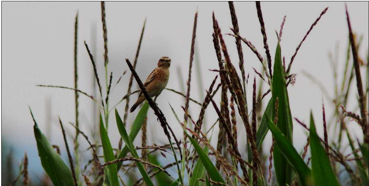
Abb. 3: 1 dj. Ind. Braunkehlchen Saxicola rubetra auf Warte; Datum: 10.08.2014; Ort: Alfdorf