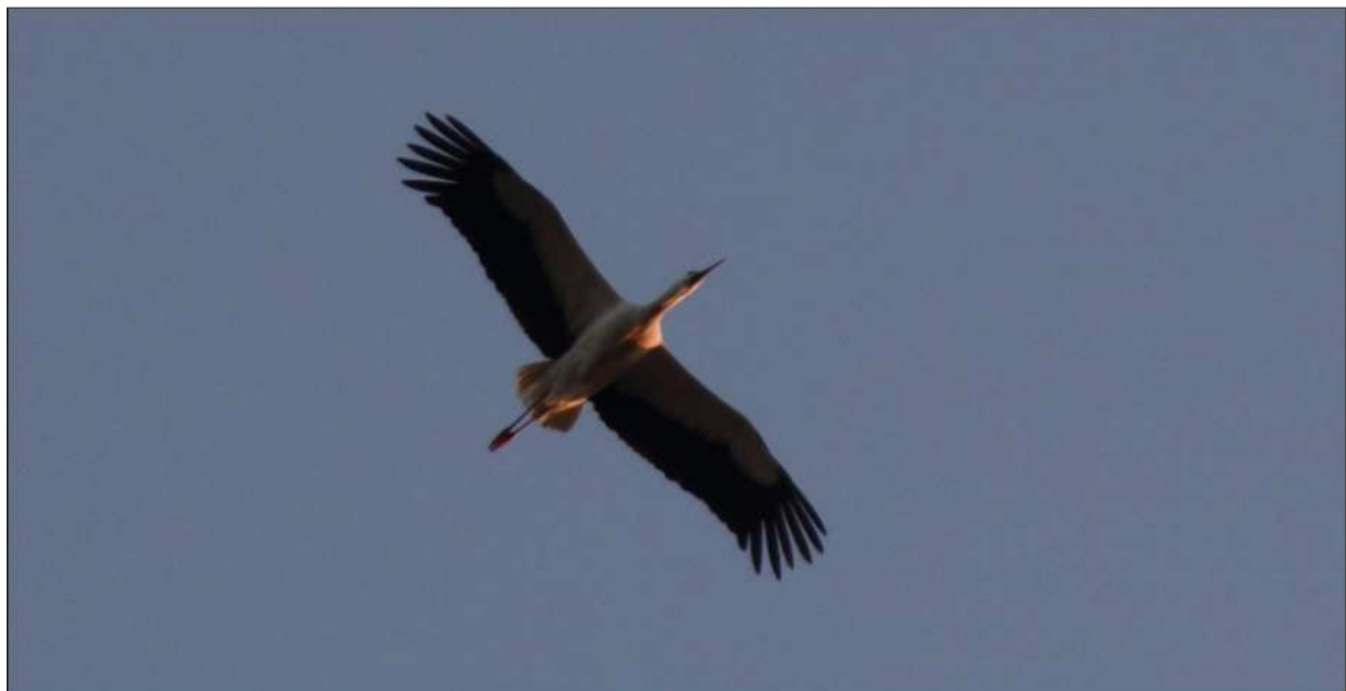
Abb. 2: 1 ad. Ind. Weißstorch Ciconia ciconia im Segelflug; Datum: 16.03.2014; Ort: Alfdorf