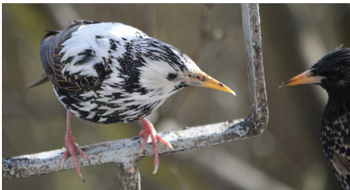
Abb. 7: 1 ad. Ind. eines teilleuzistischen Stars Sturnus vulgaris ; Datum: 18.03.2014; Ort: Sachsenweiler