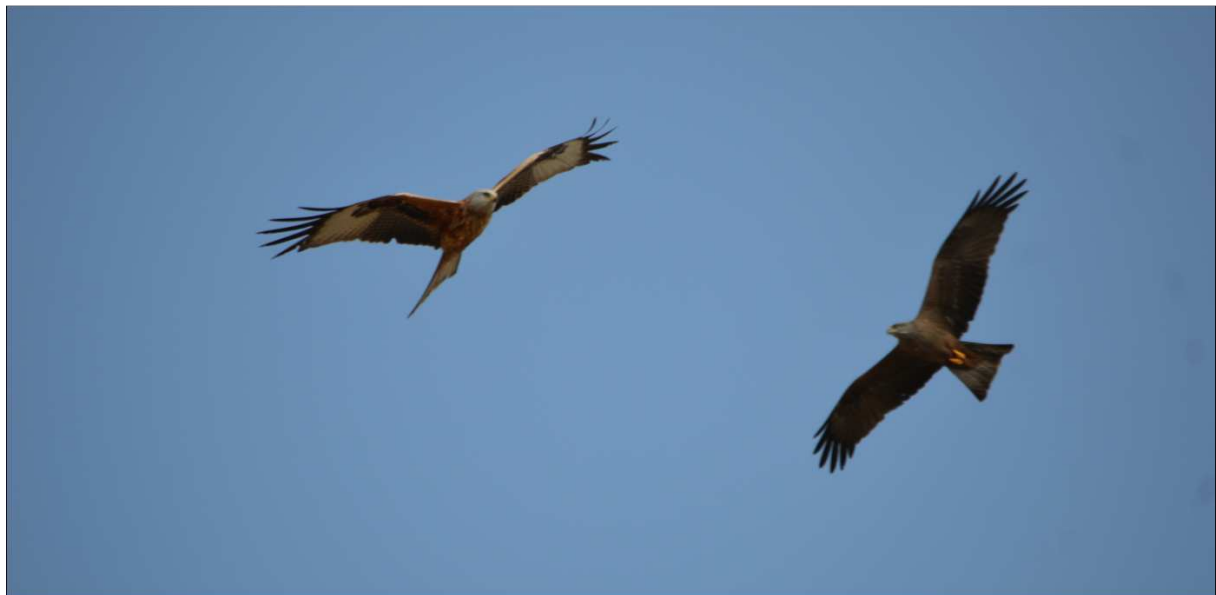
Abb. 3: 1 vj. Ind. Rotmilan Milvus milvus und 1 ad. Ind. Schwarzmilan Milvus migrans im Segelflug; Datum: 19.03.2014; Ort: Zwingelhausen