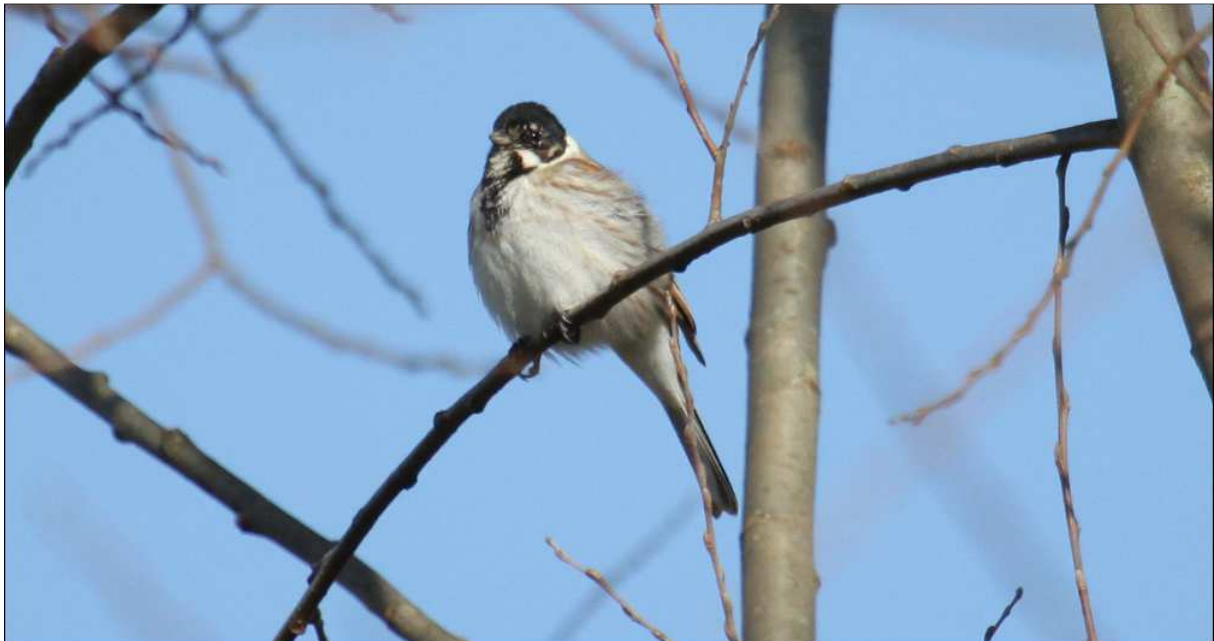
Abb. 8: 1.0 ad. Ind. Rohrammer Emberiza schoeniclus SK>PK; Datum: 17.03.2014; Ort: Schlechtbach