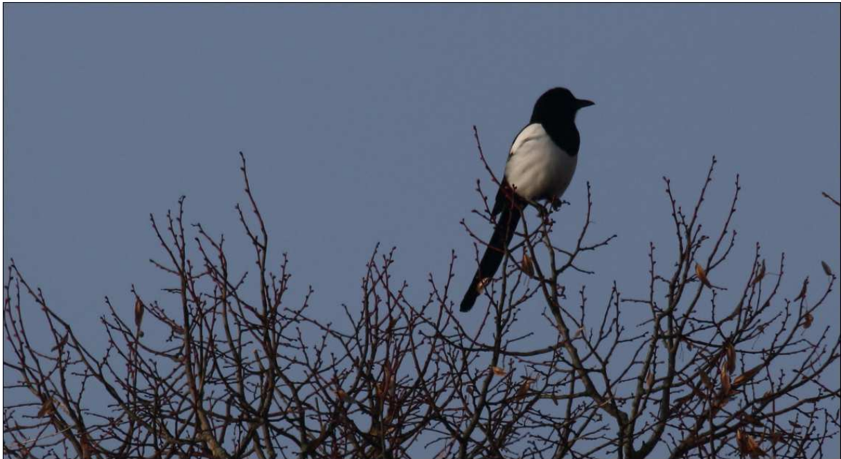
Abb. 6: 1 ad. Ind. Elster Pica pica. sichernd; Datum: 08.03.2014; Ort: Alfdorf