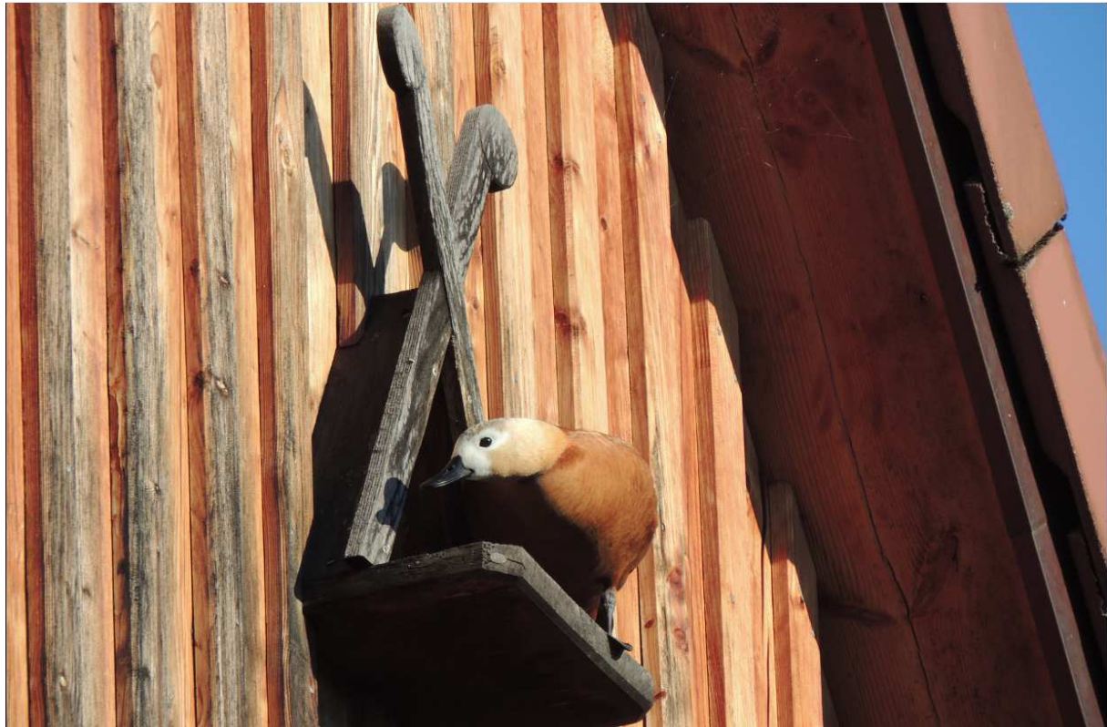
Abb. 1: 0.1 ad. Ind. Rostgans Tadorna ferruginea beim sichern am Brutplatz in einem Nistkasten für Turmfalken und Schleiereulen; Datum: 27.03.2014; Ort: Pfahlbronn