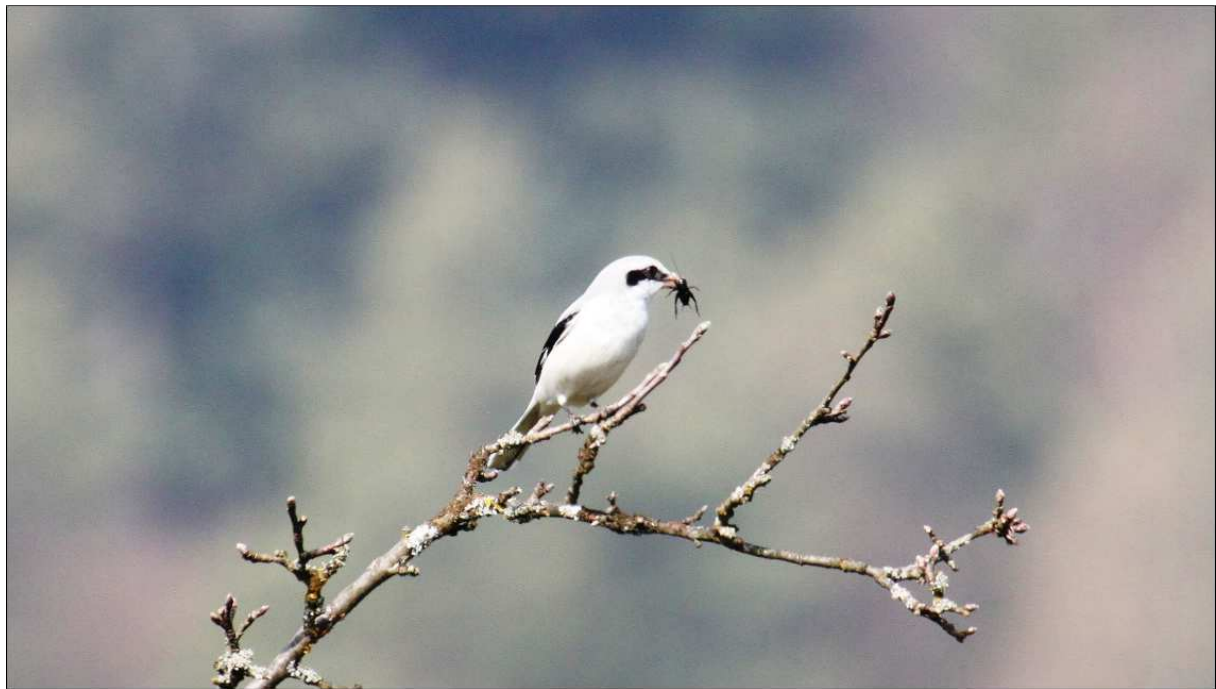
Abb. 5: 1 ad. Raubwürger Lanius excubitor mit erbeuteter Grille Gryllus spec. Datum: 07.03.2014; Ort: Schlechtbach