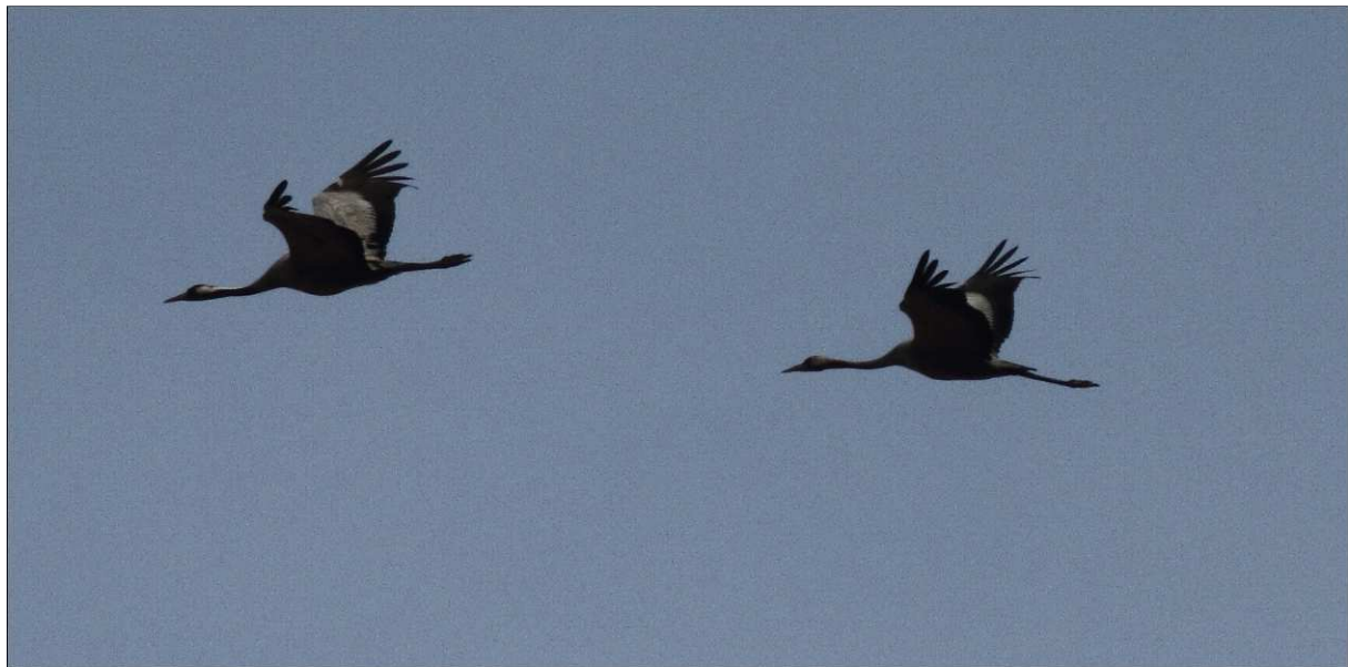
Abb. 4: 1 ad. und 1 vj. Ind. Kranich Grus grus im aktiven Schlagflug; Datum: 21.03.2014; Ort: Alfdorf