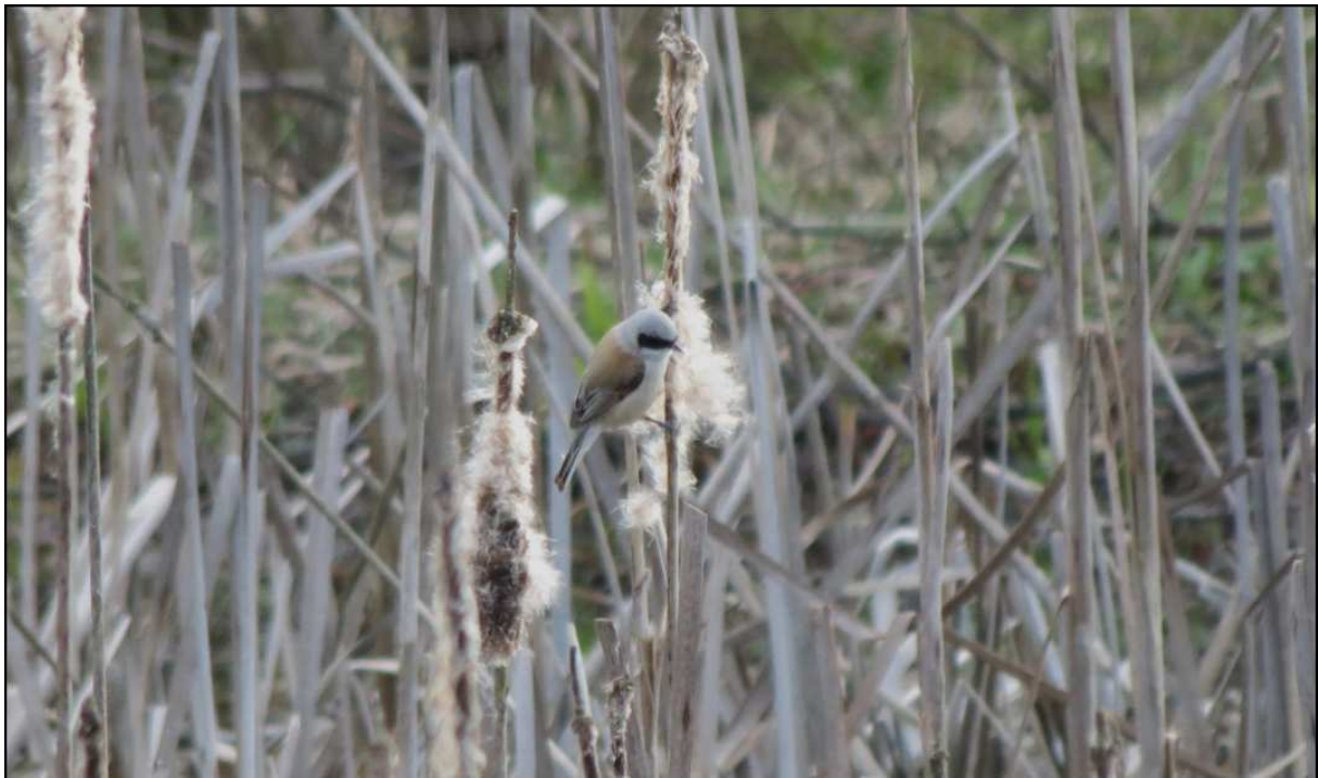
Abb. 5: 0.1 ad. Ind. Beutelmeise Remiz pendulinus auf Nahrungssuche; Datum: 13.04.2013; Ort: Steinenberg