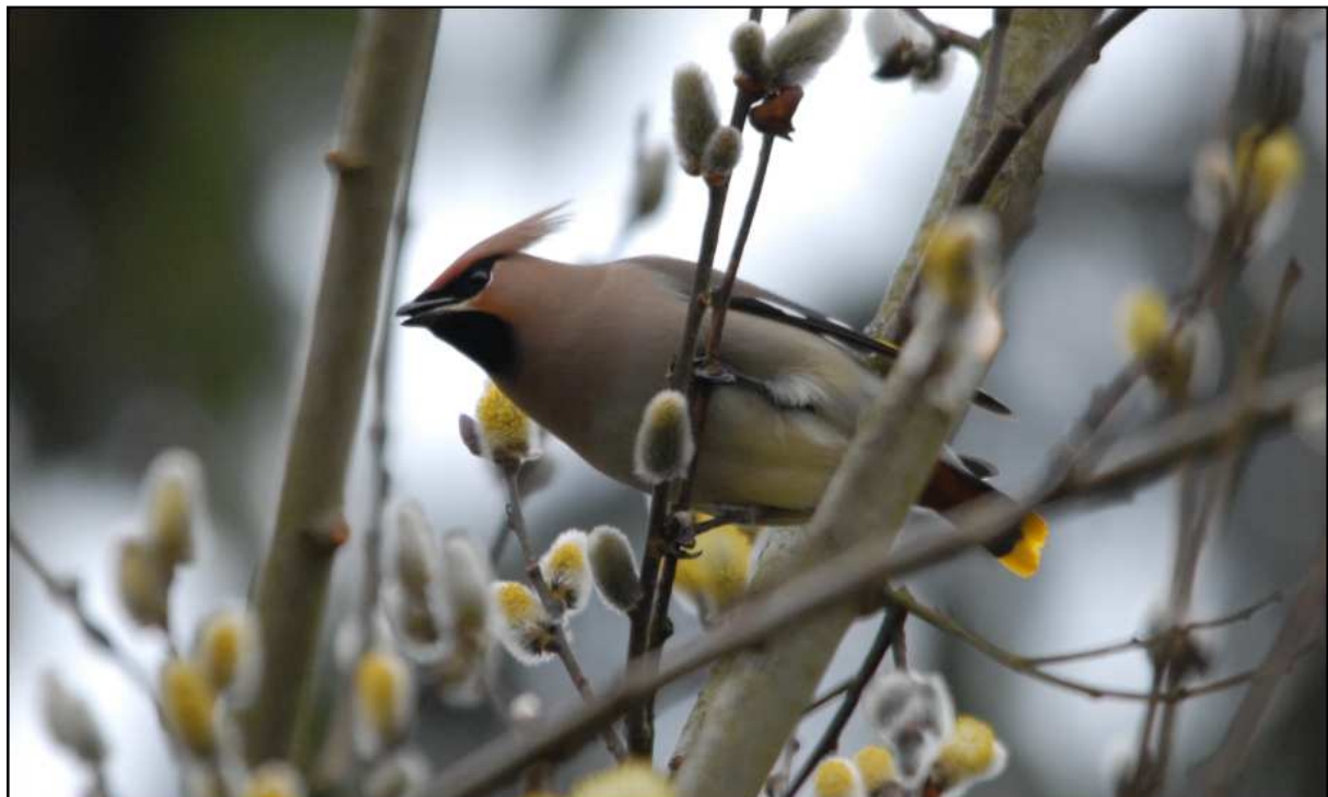
Abb. 3: 0.1 ad. Ind. Seidenschwanz Bombycilla garrulus beim fressen von Blütenknospen einer Weide Salix spec. Knospen werden des Öfteren von Seidenschwänzen Bombycilla garrulus bei Nahrungsknappheit gegen Ende des Aufenthalts im Überwinterungsgebiet gefressen. Datum: 21.04.2013; Ort: Rudersberg