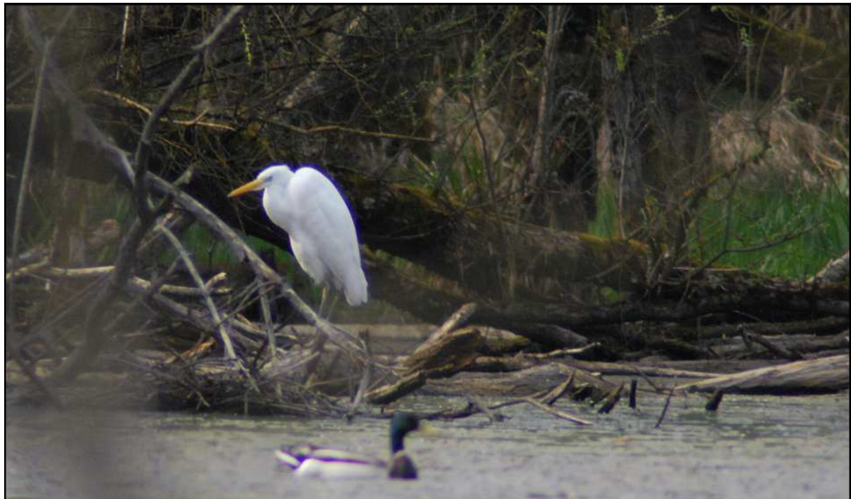
Abb. 1: 1 Ind. Silberreiher Casmerodius albus in Ruhehaltung. Man beachte den zum Teil umgefärbten Tarsus, bei diesem ansonsten im Schlichtkleid befindlichen Ind.; Datum: 18.04.2013; Ort: NSG Lorcher Baggerseen