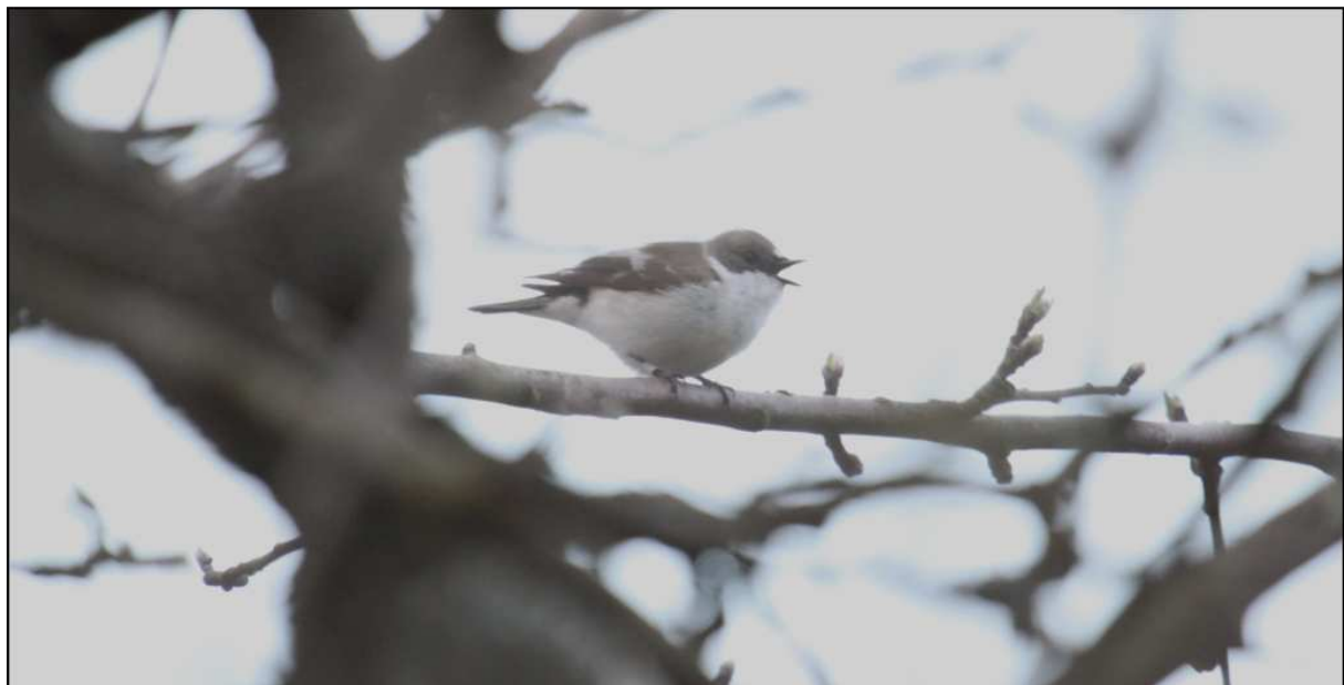
Abb. 4: 1.0 ad. Ind. eines Hybriden zwischen Halsband- Ficedula albicollis * Trauerschnäpper Ficedula Hypoleuca. Das beringte Ind. konnte noch nicht erfolgreich abgelesen werden. Datum: 21.04.2013; Ort: Schlechtbach