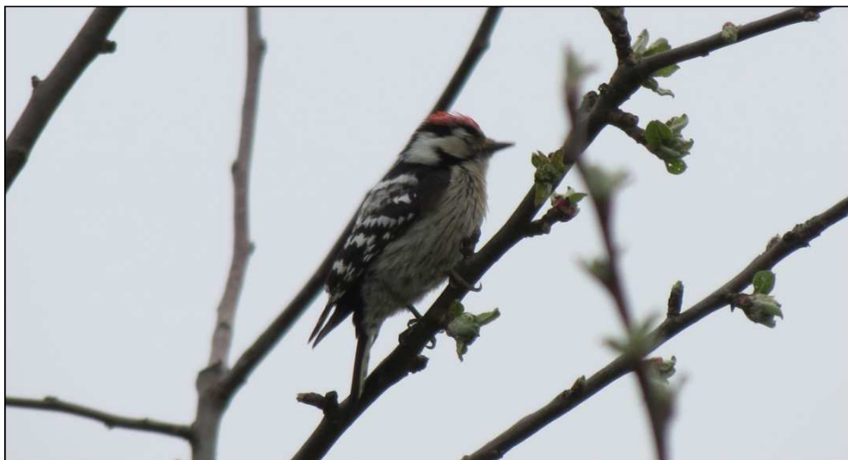
Abb. 2: 1. 0 ad. Ind. Kleinspecht Dendrocopos minor. Deutlich ist beim fotografierten Ind. die Nickhaut am rechten Auge zu erkennen; Datum: 21.04.2013; Ort: Steinenberg