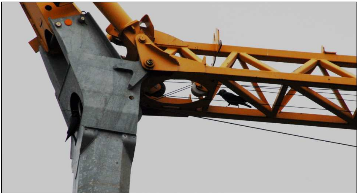
Abb. 7: 1.1 ad. Ind. Dohle Corvus monedula beim Nestbau an einem Baukran; Datum: 30.04.2013; Ort: Schlechtbach