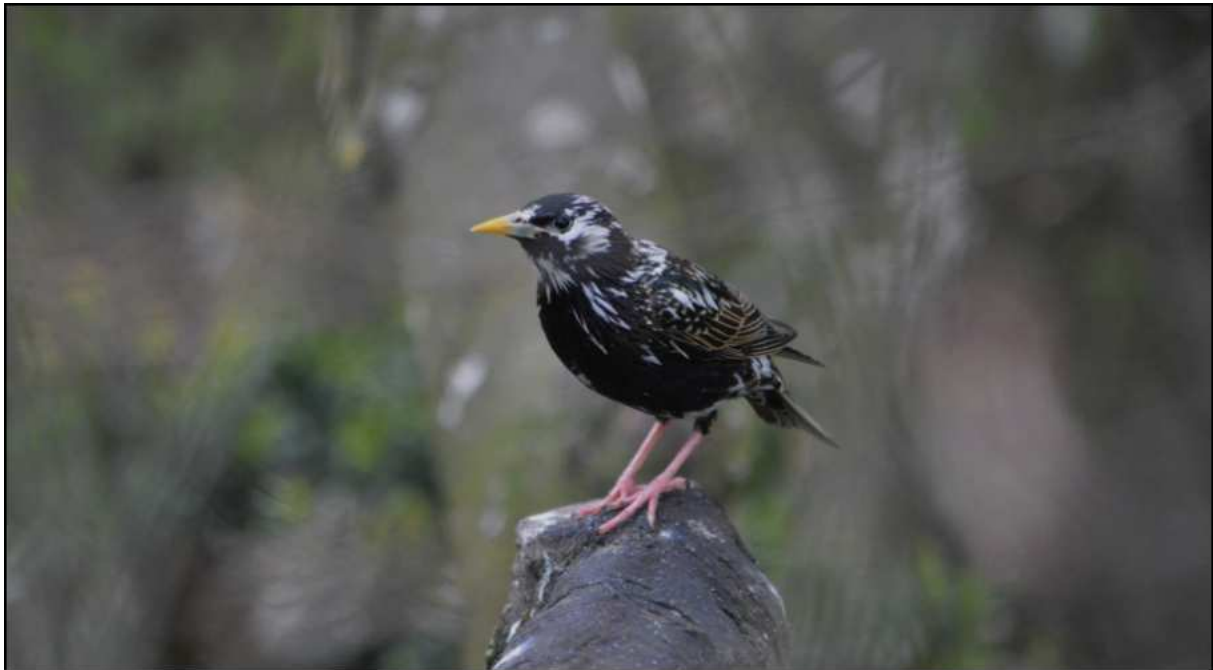
Abb. 6: 1.0 ad. Ind. eines teilalbinotischen Stars Sturnus vulgaris ; Datum: 22.04.2013; Ort: Sachsenweiler