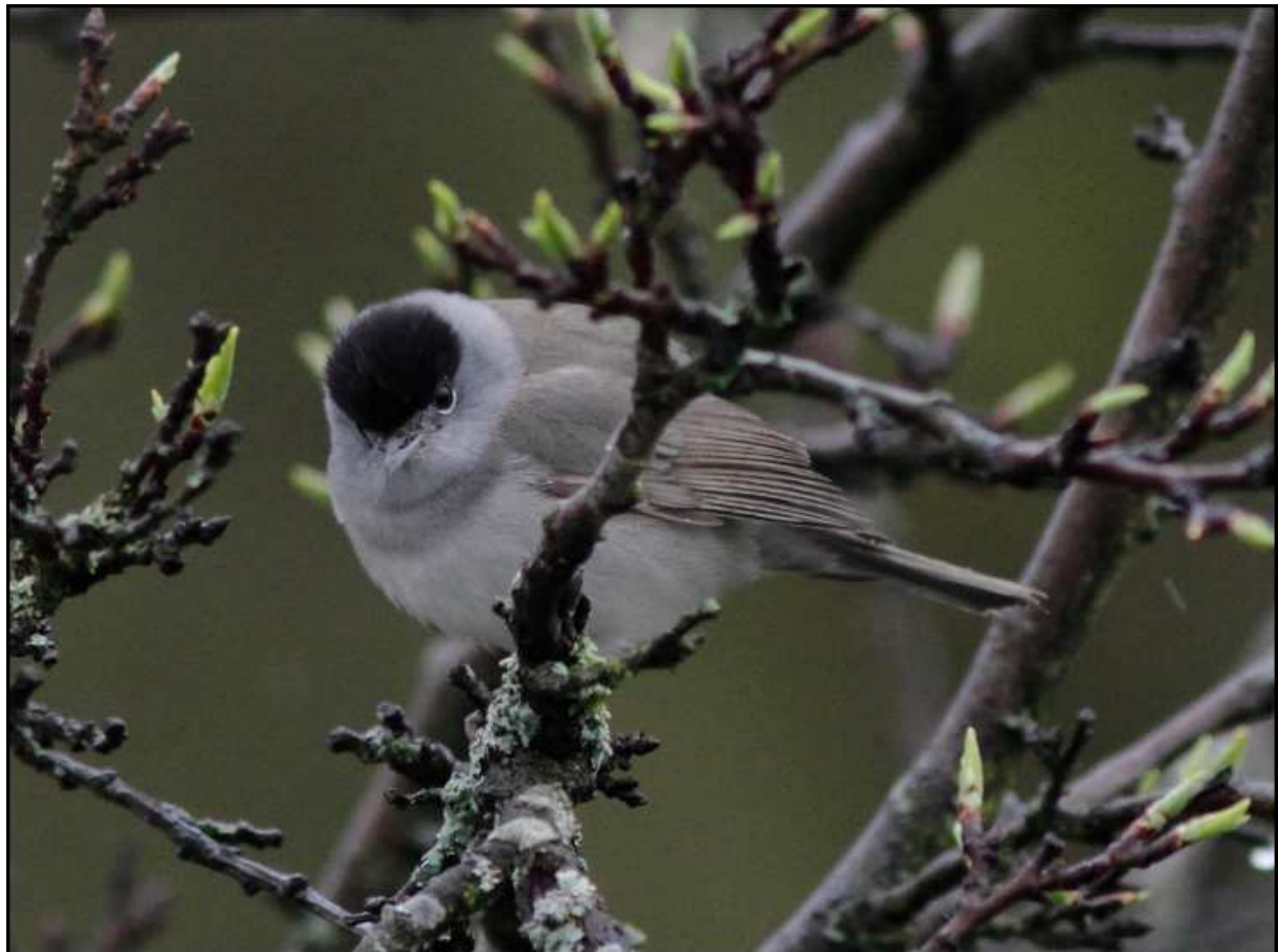
Titelphoto: 1.0 ad. Ind. Mönchsgrasmücke Sylvia atricapilla ; Datum: 20.04.2013; Ort: Alfdorf

Der monatliche Rundbrief der Ornithologischen Arbeitsgemeinschaft Rems-Murr-Kreis ( OAG Rems-Murr-Kreis ) innerhalb der Ornithologischen Gesellschaft Baden-Württemberg ( OGBW ) dient dem Informationsaustausch aller ornithologisch am Landkreis Rems-Murr Interessierten. Er stellt keine formale Veröffentlichung dar und ist somit nicht wissenschaftlich zitierbar. Alle an die OGBW-Regionalkoordinatoren Rems-Murr-Kreis übermittelten Beobachtungsdaten, werden auf Plausibilität geprüft, bei kreisweiter Bedeutung im Rundbrief veröffentlicht und an die Dokumentationsstelle für die Avifauna Baden-Württemberg zur weiteren Auswertung überstellt.