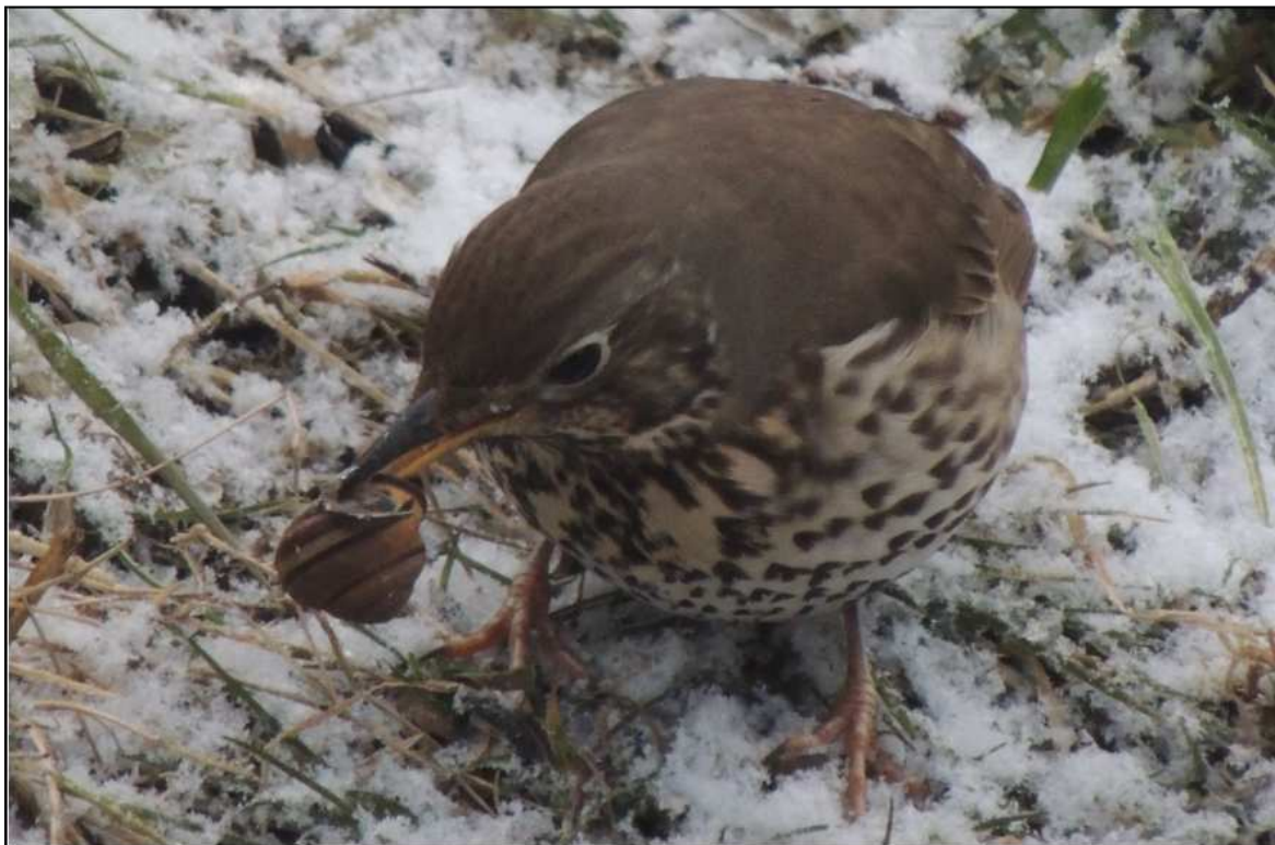
Abb. 7: 1 ad. Ind. Singdrossel Turdus philomelos beim Bearbeiten einer Hain-Bänderschnecke Cepaea nemoralis ; Datum: 29.03.2013; Ort: Pfahlbronn