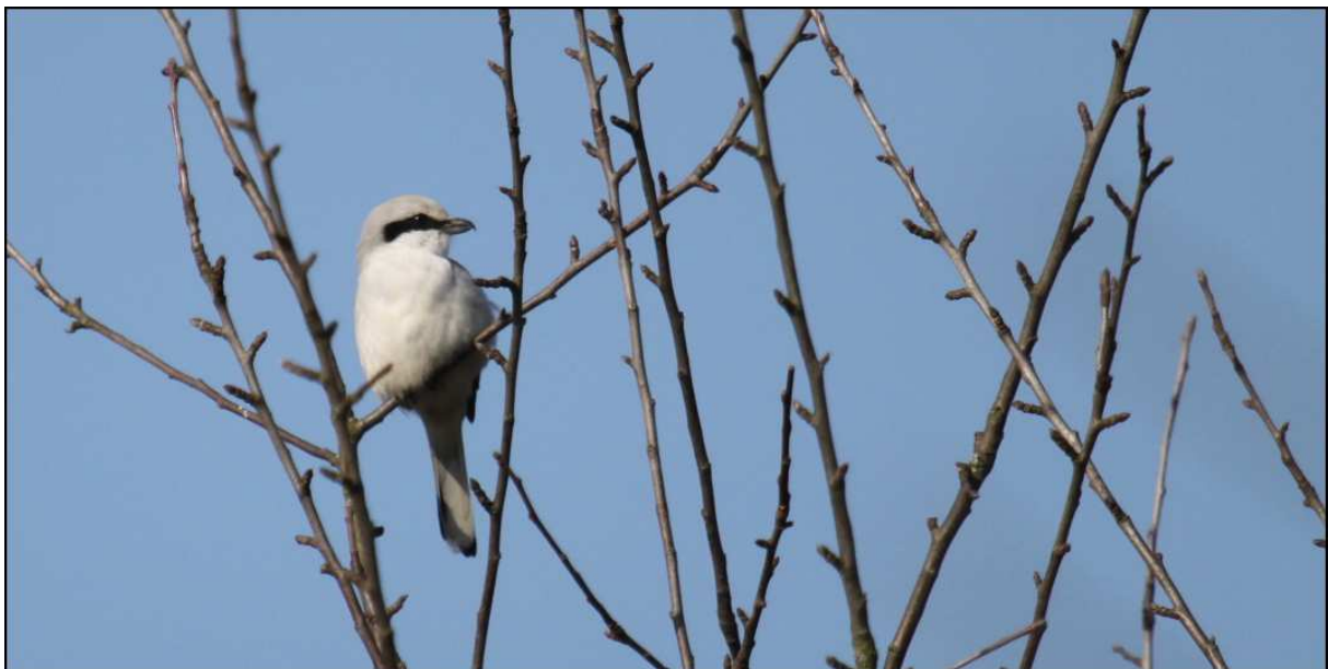
Abb. 1: 1.0 ad. Ind. Raubwürger Lanius excubitor auf Warte; Datum: 22.03.2013; Ort: Schlechtbach