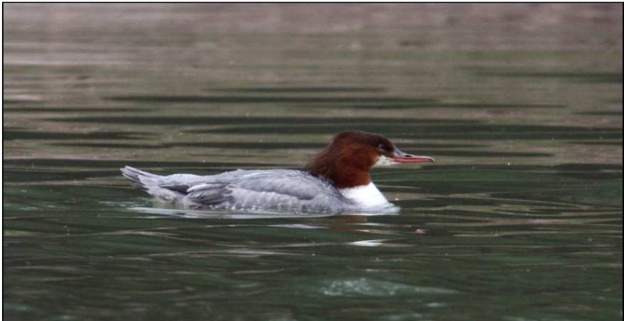
Abb. 2: 0.1 ad. Ind. Gänsesäger Mergus merganser wassernd; Datum: 24.03.2013; Ort: Leineckstausee