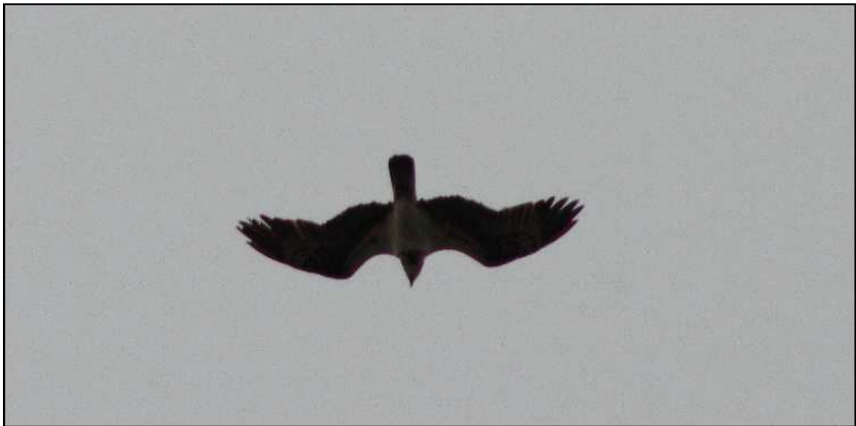
Abb. 3: 1 ad. Ind. Fischadler Pandion haliaetus im Streckenflug. Man beachte auch hier die starke Gefiederabnutzung; Datum: 21.03.2013; Ort: Alfdorf