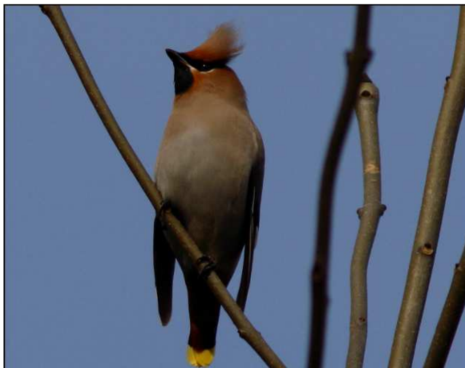
Abb. 6: 1.0 ad. Ind. Seidenschwanz Bombycilla garrulus ; Datum: 22.03.2013; Ort: Alfdorf