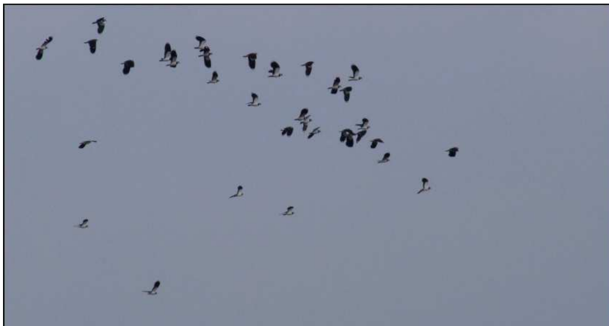
Abb. 5: 33 Ind. Kiebitze Vanellus vanellus ; Datum: 27.03.2013; Ort: Sachsenweiler