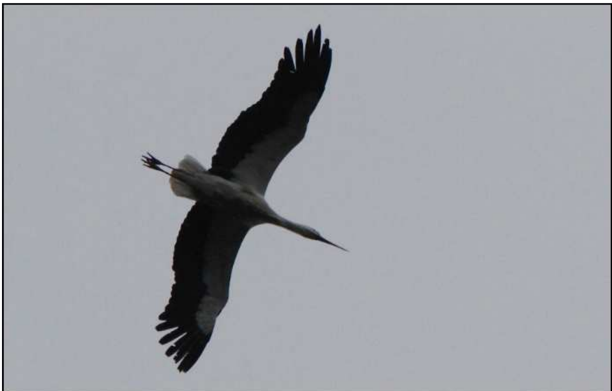
Abb. 1: 1 ad. Ind. Weißstorch Ciconia ciconia. Man beachte die stark abgenutzten und zum Teil auch deformierten Handschwinge; Datum: 31.03.2013; Ort: Alfdorf