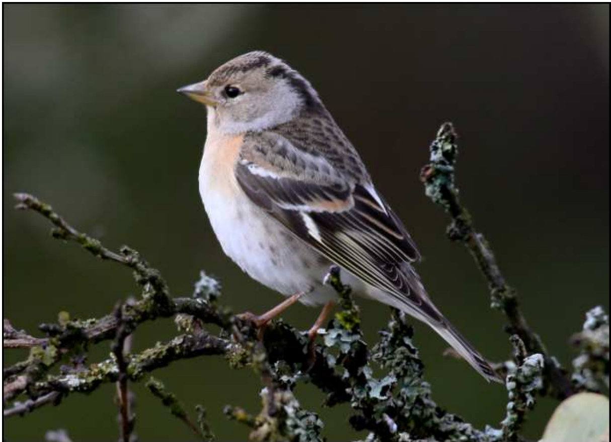
Titelphoto: 0.1 vj. Ind. Bergfink Fringilla montifringilla ; Datum: 21.03.2013; Ort: Alfdorf

Der monatliche Rundbrief der Ornithologischen Arbeitsgemeinschaft Rems-Murr-Kreis (OAG Rems-Murr-Kreis) innerhalb der Ornithologischen Gesellschaft Baden-Württemberg (OGBW) dient dem Informationsaustausch aller ornithologisch am Landkreis Rems-Murr Interessierten. Er stellt keine formale Veröffentlichung dar und ist somit nicht wissenschaftlich zitierbar. Alle an die OGBW-Regionalkoordinatoren Rems-Murr-Kreis übermittelten Beobachtungsdaten, werden auf Plausibilität geprüft, bei kreisweiter Bedeutung im Rundbrief veröffentlicht und an die Dokumentationsstelle für die Avifauna Baden-Württemberg zur weiteren Auswertung überstellt.