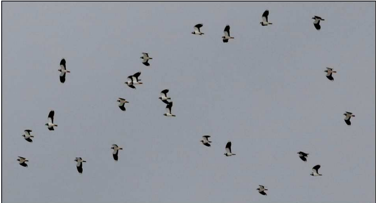
Abb. 4: 23 Ind. Kiebitze Vanellus vanellus ; Datum: 29.03.2013; Ort: Enderbach