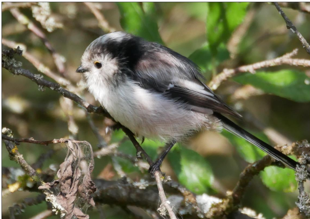
Titelfoto: 1 ad. Ind. Schwanzmeise Aegithalos caudatus ; Datum: 25.08.2025; Ort: Hebsack (WN)

Der monatliche Rundbrief der Ornithologischen Arbeitsgemeinschaft Rems-Murr-Kreis (OAG Rems-Murr-Kreis) innerhalb der Ornithologischen Gesellschaft Baden-Württemberg (OGBW) dient dem Informationsaustausch aller ornithologisch am Landkreis Rems-Murr Interessierten. Der Rundbrief stellt eine zitierbare Veröffentlichung dar (Zitiervorschlag: OAG Rems-Murr-Kreis (20..): Ornithologischer Rundbrief Rems-Murr-Kreis Nr...). Alle persönlich von den Beobachter:innen per Exportdatei an die OAG Rems-Murr-Kreis und deren kreisweiten OGBW- und ornitho.de-Regionalkoordinator:innen direkt per E-Mail zur weiteren Auswertung übermittelten Beobachtungsdaten, werden auf Plausibilität geprüft, bei kreisweiter Bedeutung im Rundbrief veröffentlicht und an die OGBW- und OAG-Datenbank zur weiteren Auswertung überstellt.