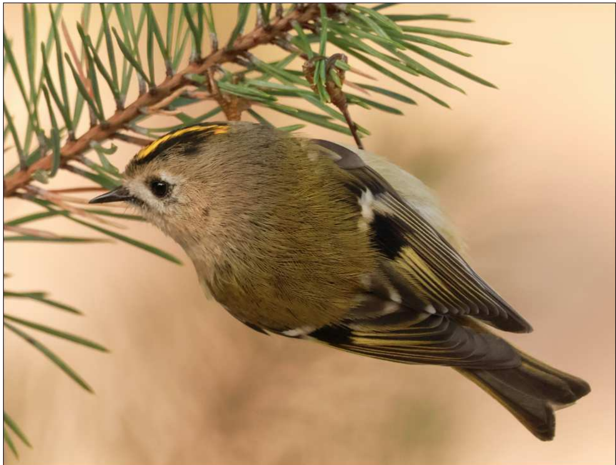
Titelfoto: 1 ad. Ind. Wintergoldhähnchen Regulus regulus ; Datum: 16.01.2024; Ort: Weiler

Der monatliche Rundbrief der Ornithologischen Arbeitsgemeinschaft Rems-Murr-Kreis ( OAG Rems-Murr-Kreis ) innerhalb der Ornithologischen Gesellschaft Baden-Württemberg ( OGBW ) dient dem Informationsaustausch aller ornithologisch am Landkreis Rems-Murr Interessierten. Der Rundbrief stellt eine zitierbare Veröffentlichung dar (Zitiervorschlag: OAG Rems-Murr-Kreis (20..): Ornithologischer Rundbrief Rems-Murr-Kreis Nr...). Alle persönlich von den Beobachter:innen per Exportdatei an die OAG Rems-Murr-Kreis und deren kreisweiten OGBW- und ornitho.de-Regionalkoordinator:innen direkt per E-Mail zur weiteren Auswertung übermittelten Beobachtungsdaten, werden auf Plausibilität geprüft, bei kreisweiter Bedeutung im Rundbrief veröffentlicht und an die OGBW- und OAG-Datenbank zur weiteren Auswertung überstellt.