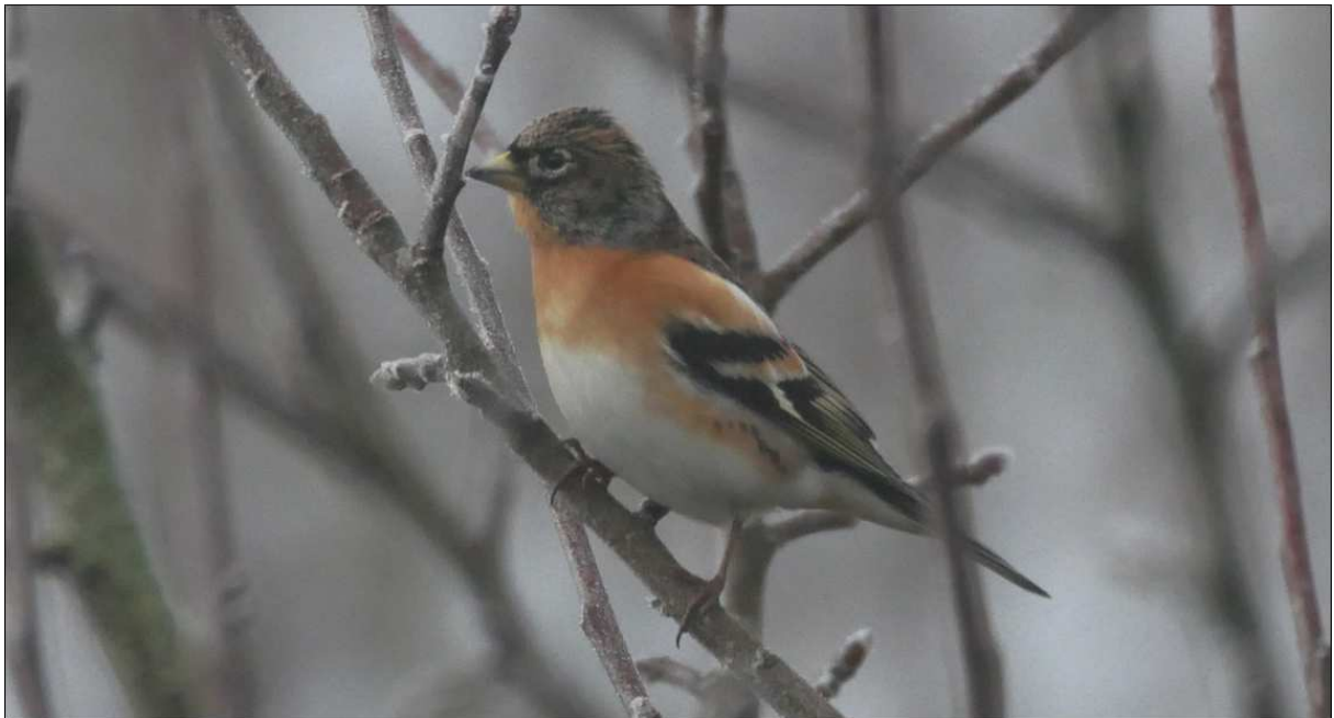
Abb. 1: 1.0 ad. Ind. Bergfink Fringilla montifringilla im SK; Datum: 27.01.2024; Ort: Hebsack