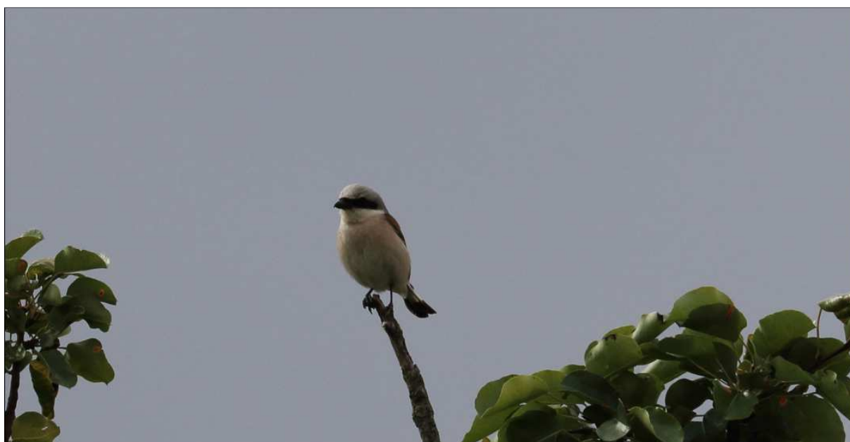
Abb. 2: 1.0 ad. Ind. Neuntöter Lanius collurio ; Datum: 10.07.2022; Ort: Alfdorf