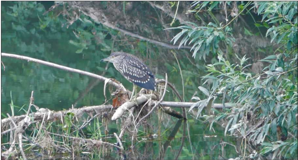
Abb. 1: 1 dj. Ind. Nachtreiher Nycticorax nycticorax im JK; Datum: 16.07.2022; Ort: Hebsack