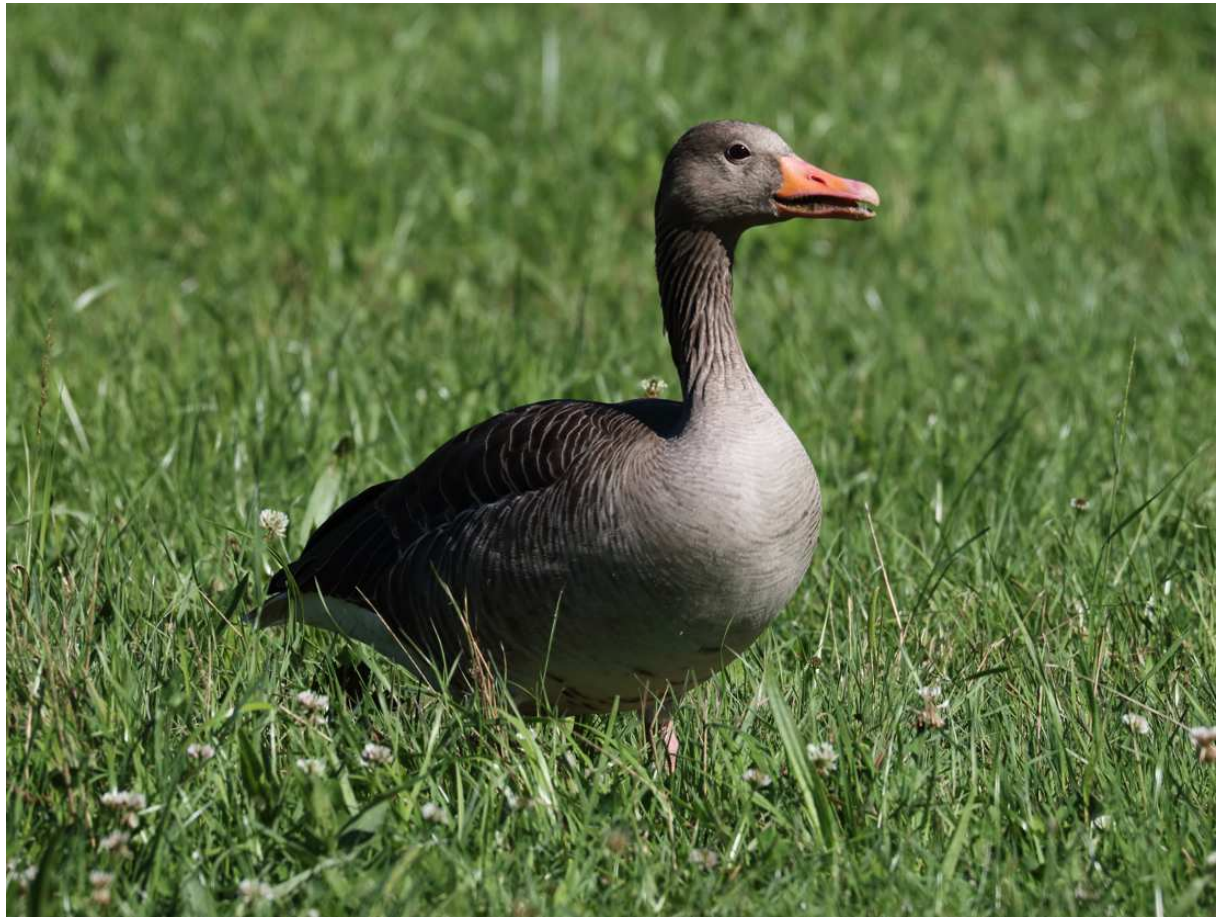
Titelfoto: 1 Ind. Graugangs Anser anser ; Datum: 03.07.2022; Ort: Alfdorf

Der monatliche Rundbrief der Ornithologischen Arbeitsgemeinschaft Rems-Murr-Kreis (OAG Rems-Murr-Kreis) innerhalb der Ornithologischen Gesellschaft Baden-Württemberg (OGBW) dient dem Informationsaustausch aller ornithologisch am Landkreis Rems-Murr Interessierten. Der Rundbrief stellt eine zitierbare Veröffentlichung dar (Zitiervorschlag: OAG Rems-Murr-Kreis (20..): Ornithologischer Rundbrief Rems-Murr-Kreis Nr...). Alle persönlich von den Beobachter:innen per Exportdatei an die OAG Rems-Murr-Kreis und deren kreisweiten OGBW- und ornitho.de-Regionalkoordinator:innen direkt per E-Mail zur weiteren Auswertung übermittelten Beobachtungsdaten, werden auf Plausibilität geprüft, bei kreisweiter Bedeutung im Rundbrief veröffentlicht und an die OGBW- und OAG-Datenbank zur weiteren Auswertung überstellt.