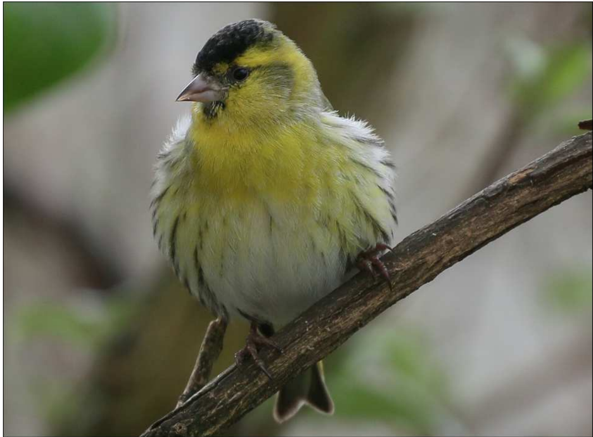
Titelfoto: 1.0 ad. Ind. Erlenzeisg Carduelis spinus ; Datum: 20.02.2022; Ort: Plüderhausen

Der monatliche Rundbrief der Ornithologischen Arbeitsgemeinschaft Rems-Murr-Kreis ( OAG Rems-Murr-Kreis ) innerhalb der Ornithologischen Gesellschaft Baden-Württemberg ( OGBW ) dient dem Informationsaustausch aller ornithologisch am Landkreis Rems-Murr Interessierten. Der Rundbrief stellt eine zitierbare Veröffentlichung dar (Zitiervorschlag: OAG Rems-Murr-Kreis (20..): Ornithologischer Rundbrief Rems-Murr-Kreis Nr...). Alle persönlich von den Beobachter:innen per Exportdatei an die OAG Rems-Murr-Kreis und deren kreisweiten OGBW- und ornitho.de-Regionalkoordinator:innen direkt per E-Mail zur weiteren Auswertung übermittelten Beobachtungsdaten, werden auf Plausibilität geprüft, bei kreisweiter Bedeutung im Rundbrief veröffentlicht und an die OGBW- und OAG-Datenbank zur weiteren Auswertung überstellt.