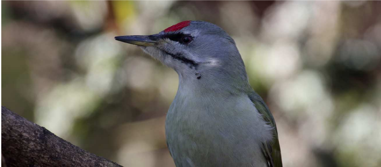
Abb. 1: 1.0 ad. Ind. Grauspecht Picus canus ; Datum: 23.02.2022; Ort: Alfdorf