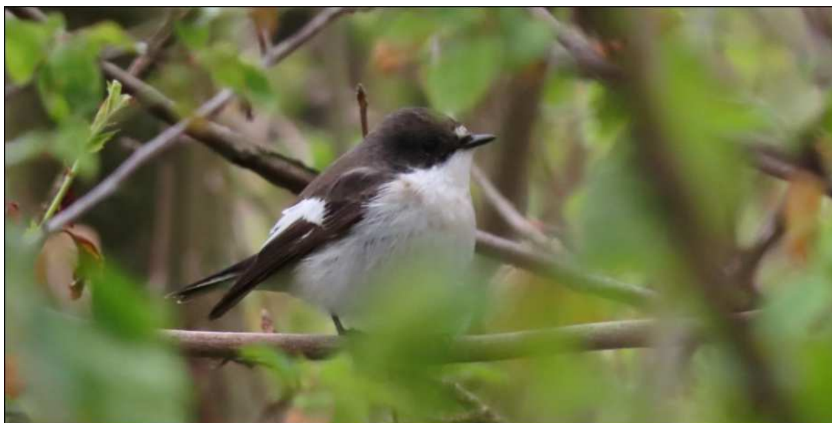
Abb.4 1.0 ad. Ind. der Trauerschnäpper Ficedula hypoleuca ; Datum: 01.05.2021; Ort: Alfdorf