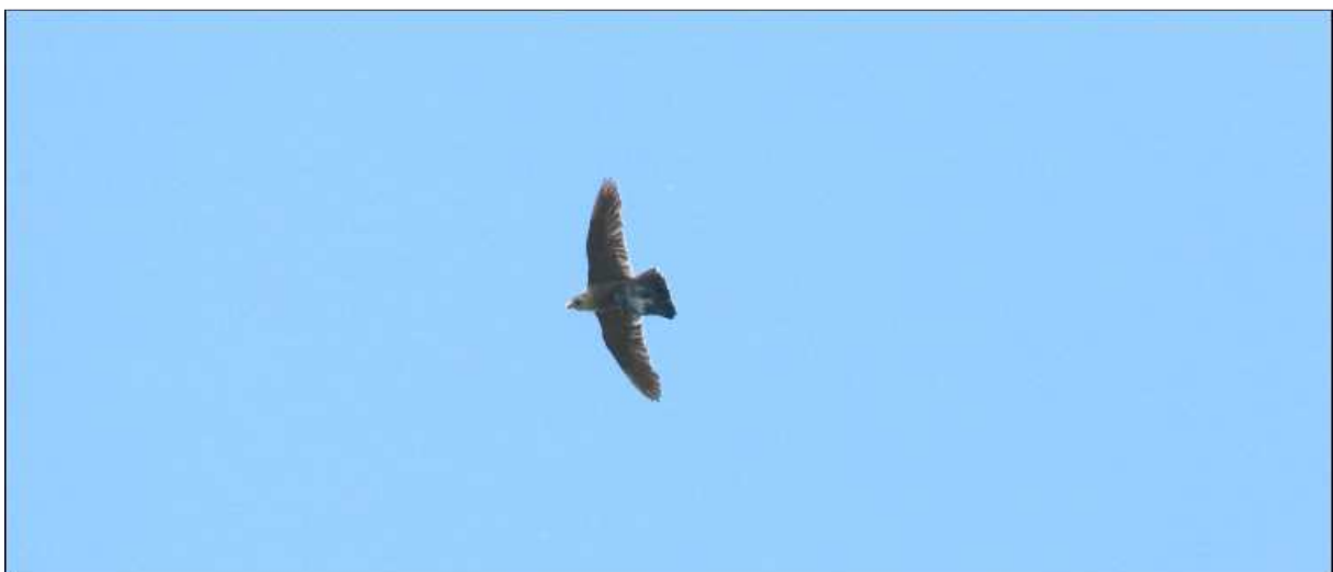
Abb.1 0.1 Ind Wanderfalke Falco peregrinus mit, soweit erkennbar, erbeutendem Eichelhäher Garrulus glandarius ; Datum: 13.05.2021; Ort: Alfdorf