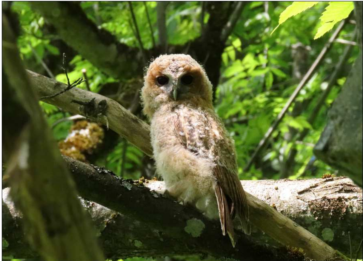
Titelfoto: 1 Waldkauz Strix aluco Ästling; Datum: 30.05.2021; Ort: Alfdorf

Der monatliche Rundbrief der Ornithologischen Arbeitsgemeinschaft Rems-Murr-Kreis (OAG Rems-Murr-Kreis) innerhalb der Ornithologischen Gesellschaft Baden-Württemberg (OGBW) dient dem Informationsaustausch aller ornithologisch am Landkreis Rems-Murr Interessierten. Der Rundbrief stellt eine zitierbare Veröffentlichung dar (Zitiervorschlag: OAG Rems-Murr-Kreis (20..): Ornithologischer Rundbrief Rems-Murr-Kreis Nr...). Alle persönlich von den Beobachter per Exportdatei an die OAG Rems-Murr-Kreis und deren kreisweiten OGBW- und ornitho.de-Regionalkoordinatoren direkt per E-Mail zur weiteren Auswertung übermittelten Beobachtungsdaten, werden auf Plausibilität geprüft, bei kreisweiter Bedeutung im Rundbrief veröffentlicht und an die OGBW-und OAG-Datenbank zur weiteren Auswertung überstellt.