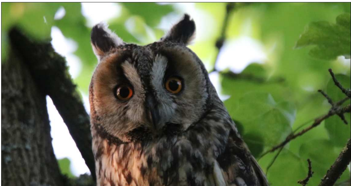
Abb.3 1 ad. Ind. der Waldohreule Asio otus ; Datum: 31.05.2021; Ort: Schorndorf