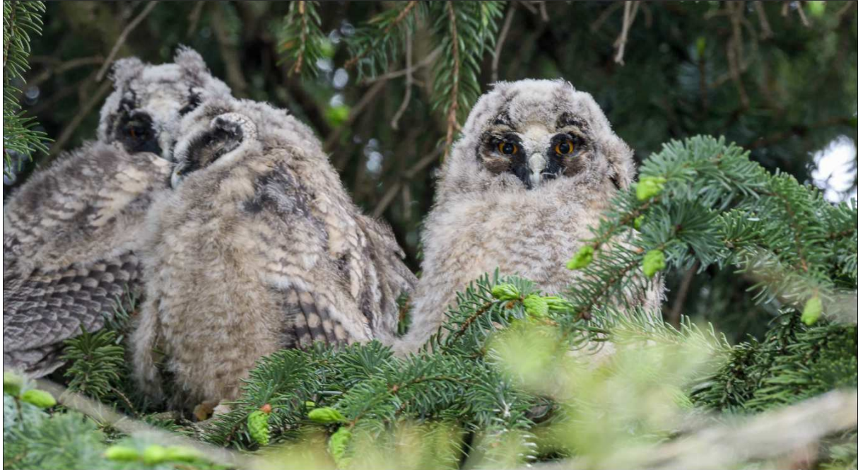
Abb.2 3 Ästlinge der Waldohreule Asio otus ; Datum: 26.05.2021; Ort: Nellmersbach