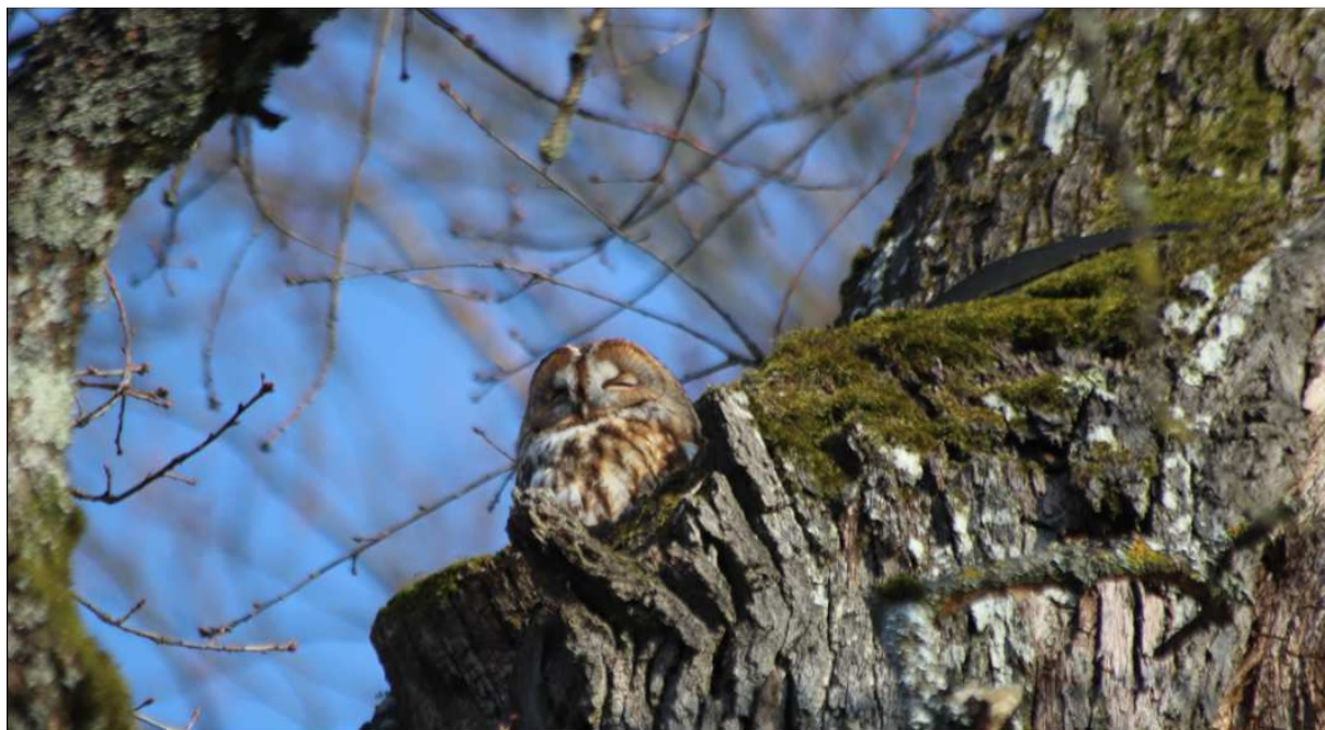
Abb. 1: 1 Ind. Waldkauz Strix aluco der braunen Morphe; Datum: 26.03.2021; Ort: Backnang