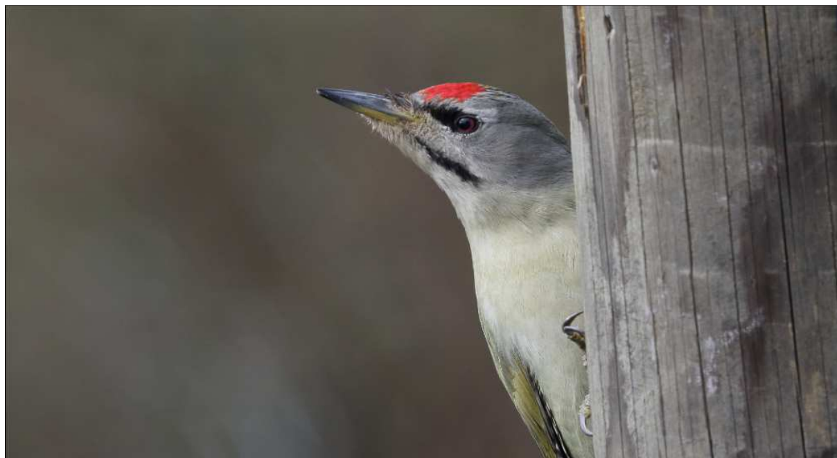
Abb. 2: 1.0 ad. Ind. Grauspecht Picus canus sichernd; Datum: 17.03.2021; Ort: Alfdorf