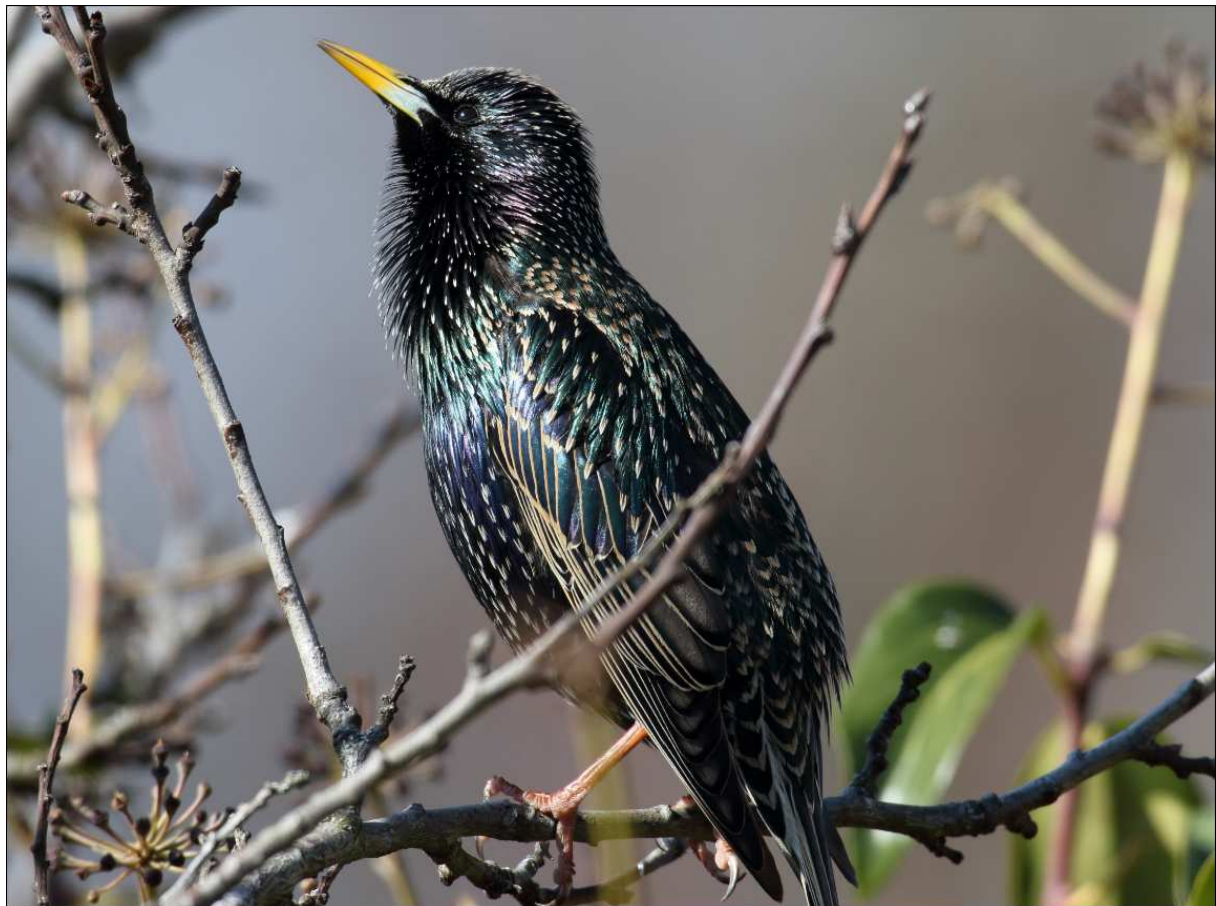
Titelfoto: 1.0 ad. Ind. Star Sturnus vulgaris ; Datum: 24.03.2021; Ort: Alfdorf

Der monatliche Rundbrief der Ornithologischen Arbeitsgemeinschaft Rems-Murr-Kreis ( OAG Rems-Murr-Kreis ) innerhalb der Ornithologischen Gesellschaft Baden-Württemberg ( OGBW ) dient dem Informationsaustausch aller ornithologisch am Landkreis Rems-Murr Interessierten. Der Rundbrief stellt eine zitierbare Veröffentlichung dar (Zitiervorschlag: OAG Rems-Murr-Kreis (20..): Ornithologischer Rundbrief Rems-Murr-Kreis Nr...). Alle persönlich von den Beobachter per Exportdatei an die OAG Rems-Murr-Kreis und deren kreisweiten OGBW- und ornitho.de-Regionalkoordinatoren direkt per E-Mail zur weiteren Auswertung übermittelten Beobachtungsdaten, werden auf Plausibilität geprüft, bei kreisweiter Bedeutung im Rundbrief veröffentlicht und an die OGBW- und OAG-Datenbank zur weiteren Auswertung überstellt.