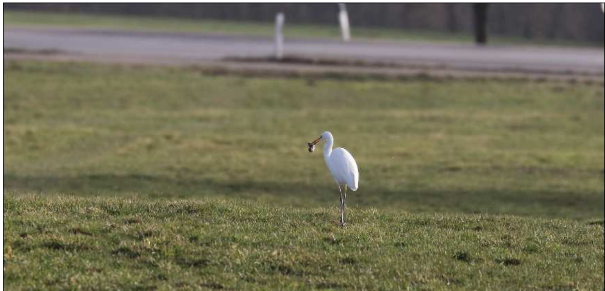
Abb. 1: 1 Ind. Silberreiher Ardea alba mit erbeutendem Kleinsäuger; Datum: 24.02.2021; Ort: Alfdorf