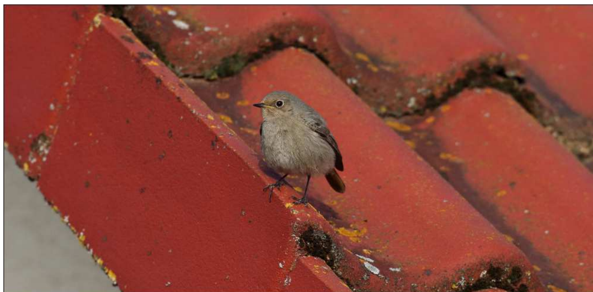
Abb. 3: 0.1 Ind. Hausrotschwanz Phoenicurus ochruros ; Datum: 24.02.2021; Ort: Alfdorf