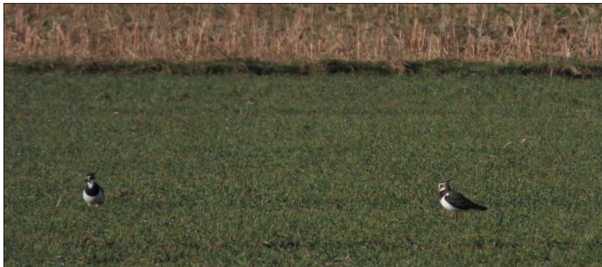
Abb. 2: 2 ad. Ind. Kiebitze Vanellus vanellus feldernd; Datum: 20.02.2021; Ort: Alfdorf