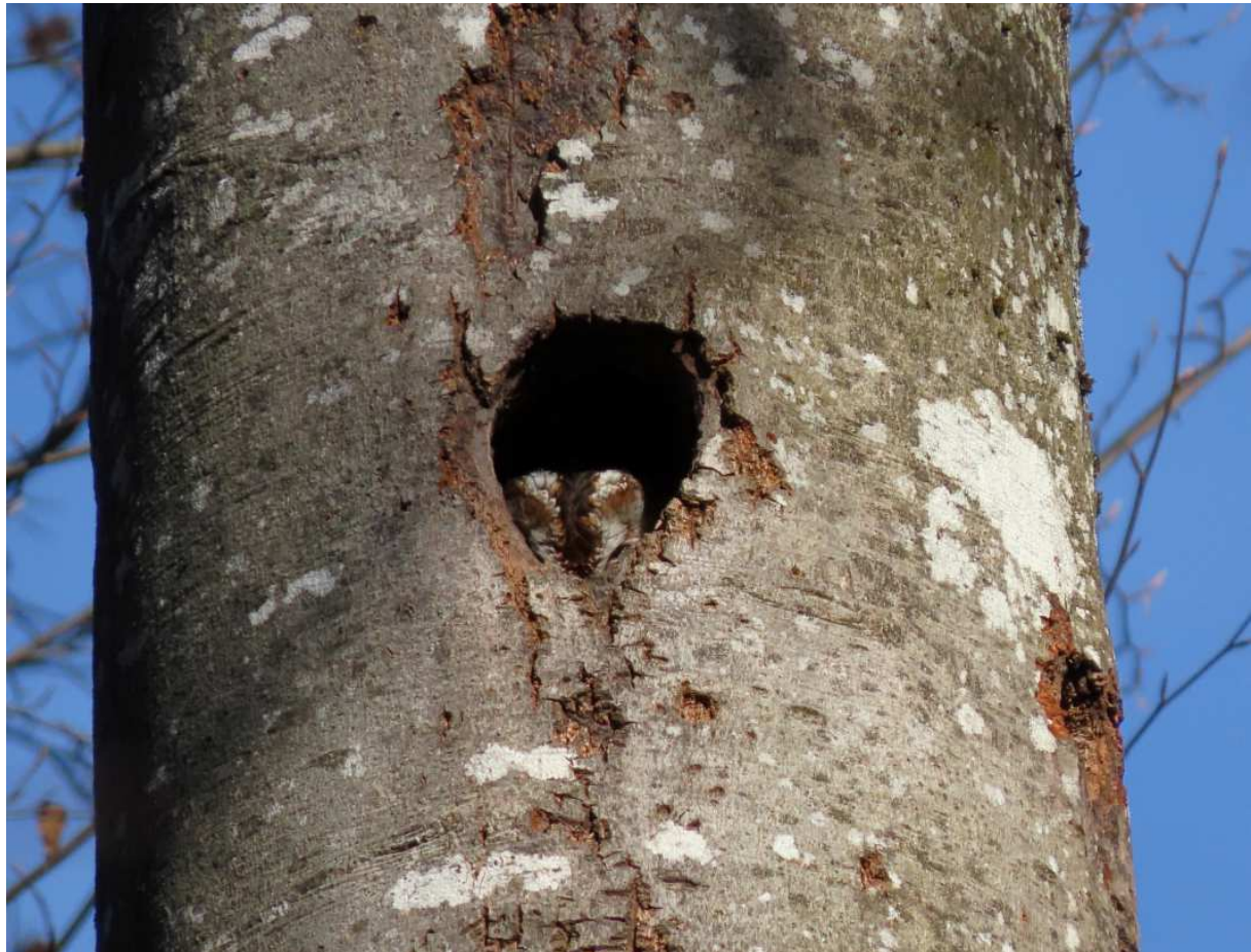
Titelfoto: 1 Ind. Waldkauz Strix aluco ; Datum: 21.02.2021; Ort: Alfdorf

Der monatliche Rundbrief der Ornithologischen Arbeitsgemeinschaft Rems-Murr-Kreis ( OAG Rems-Murr-Kreis ) innerhalb der Ornithologischen Gesellschaft Baden-Württemberg ( OGBW ) dient dem Informationsaustausch aller ornithologisch am Landkreis Rems-Murr Interessierten. Der Rundbrief stellt eine zitierbare Veröffentlichung dar (Zitiervorschlag: OAG Rems-Murr-Kreis (20..): Ornithologischer Rundbrief Rems-Murr-Kreis Nr...). Alle persönlich von den Beobachter per Exportdatei an die OAG Rems-Murr-Kreis und deren kreisweiten OGBW- und ornitho.de-Regionalkoordinatoren direkt per E-Mail zur weiteren Auswertung übermittelten Beobachtungsdaten, werden auf Plausibilität geprüft, bei kreisweiter Bedeutung im Rundbrief veröffentlicht und an die OGBW- und OAG-Datenbank zur weiteren Auswertung überstellt.