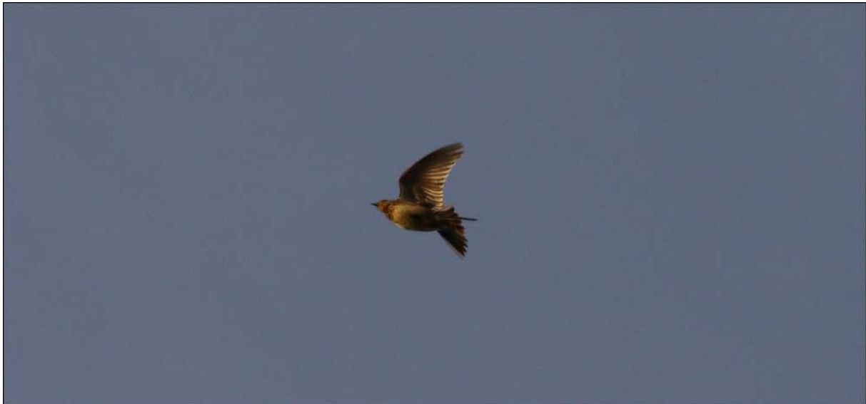
Abb. 3: 1 Ind. Feldlerche Alauda arvensis ; Datum: 01.10.2020; Ort: Alfdorf