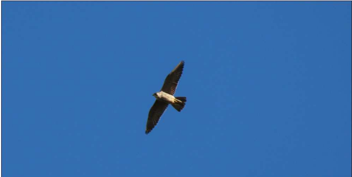
Abb. 1: 0.1 dj. Ind. Wanderfalke Falco peregrinus im Segelflug; Datum: 03.10.2020; Ort: Alfdorf