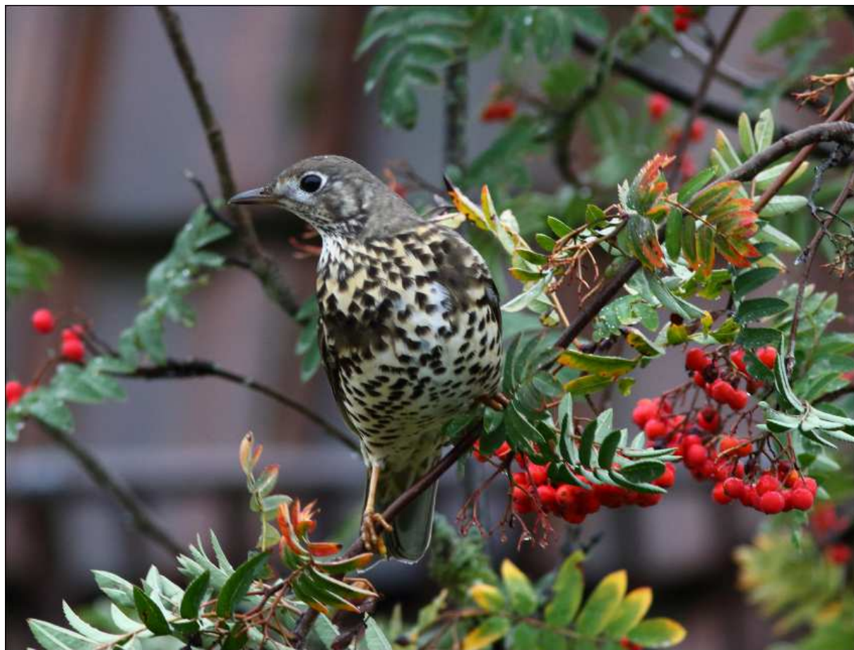
Titelfoto: 1 Ind. Misteldrossel Turdus viscivorus auf Nahrungssuche; Datum: 16.10.2020; Ort: Alfdorf

Der monatliche Rundbrief der Ornithologischen Arbeitsgemeinschaft Rems-Murr-Kreis ( OAG Rems-Murr-Kreis ) innerhalb der Ornithologischen Gesellschaft Baden-Württemberg ( OGBW ) dient dem Informationsaustausch aller ornithologisch am Landkreis Rems-Murr Interessierten. Der Rundbrief stellt eine zitierbare Veröffentlichung dar (Zitiervorschlag: OAG Rems-Murr-Kreis (20..): Ornithologischer Rundbrief Rems-Murr-Kreis Nr...). Alle persönlich von den Beobachter per Exportdatei an die OAG Rems-Murr-Kreis und deren kreisweiten OGBW- und ornitho.de-Regionalkoordinatoren direkt per E-Mail zur weiteren Auswertung übermittelten Beobachtungsdaten, werden auf Plausibilität geprüft, bei kreisweiter Bedeutung im Rundbrief veröffentlicht und an die OGBW- und OAG-Datenbank zur weiteren Auswertung überstellt.