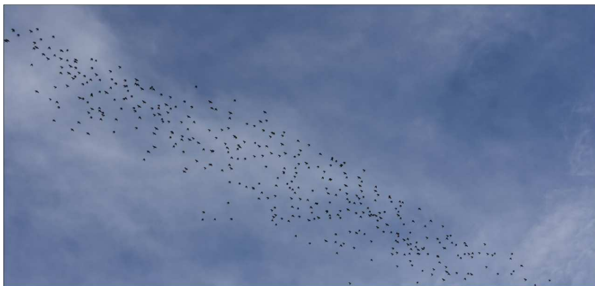
Abb. 2: Zugverband der Ringeltauben Columba palumbus ; Datum: 21.10.2020; Ort: Sachsenweiler