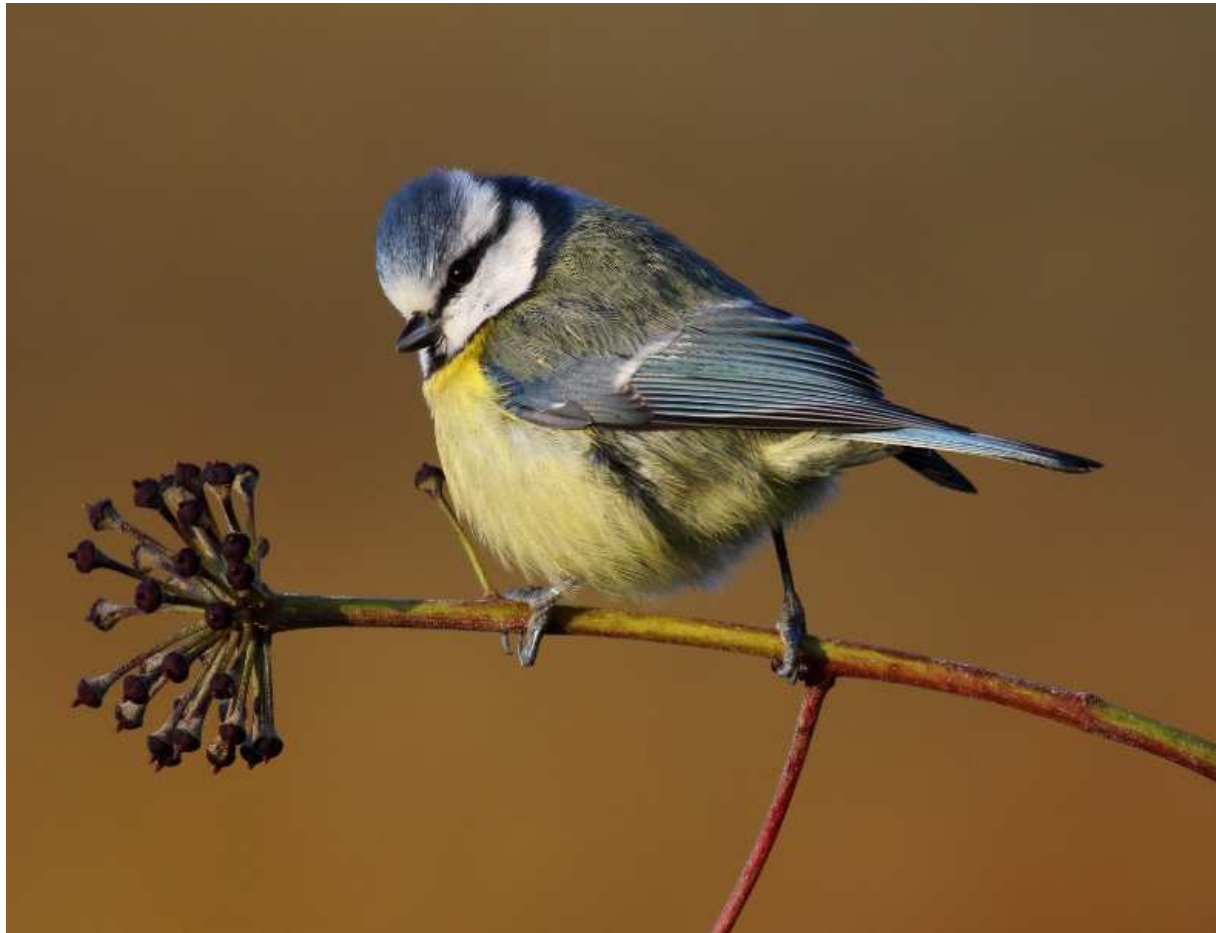
Titelphoto: 1 ad. Ind. Blaumeise Cyanistes caeruleus ; Datum: 13.02.2019; Ort: Alfdorf

Der monatliche Rundbrief der Ornithologischen Arbeitsgemeinschaft Rems-Murr-Kreis ( OAG Rems-Murr-Kreis ) innerhalb der Ornithologischen Gesellschaft Baden-Württemberg ( OGBW ) dient dem Informationsaustausch aller ornithologisch am Landkreis Rems-Murr Interessierten. Der Rundbrief stellt eine zitierbare Veröffentlichung dar (Zitiervorschlag: OAG Rems-Murr-Kreis (20..): Ornithologischer Rundbrief Rems-Murr-Kreis Nr...). Alle persönlich von den Beobachter per Exportdatei an die OAG Rems-Murr-Kreis und deren kreisweiten OGBW- und ornitho.de-Regionalkoordinatoren direkt per E-Mail zur weiteren Auswertung übermittelten Beobachtungsdaten, werden auf Plausibilität geprüft, bei kreisweiter Bedeutung im Rundbrief veröffentlicht und an die OGBW- und OAG-Datenbank zur weiteren Auswertung überstellt.