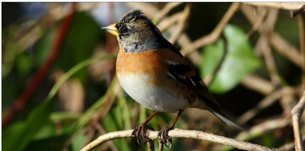
Abb. 2: 1.0 ad. Ind. Bergfink Fringilla montifringilla ; Datum: 06.02.2019; Ort: Alfdorf