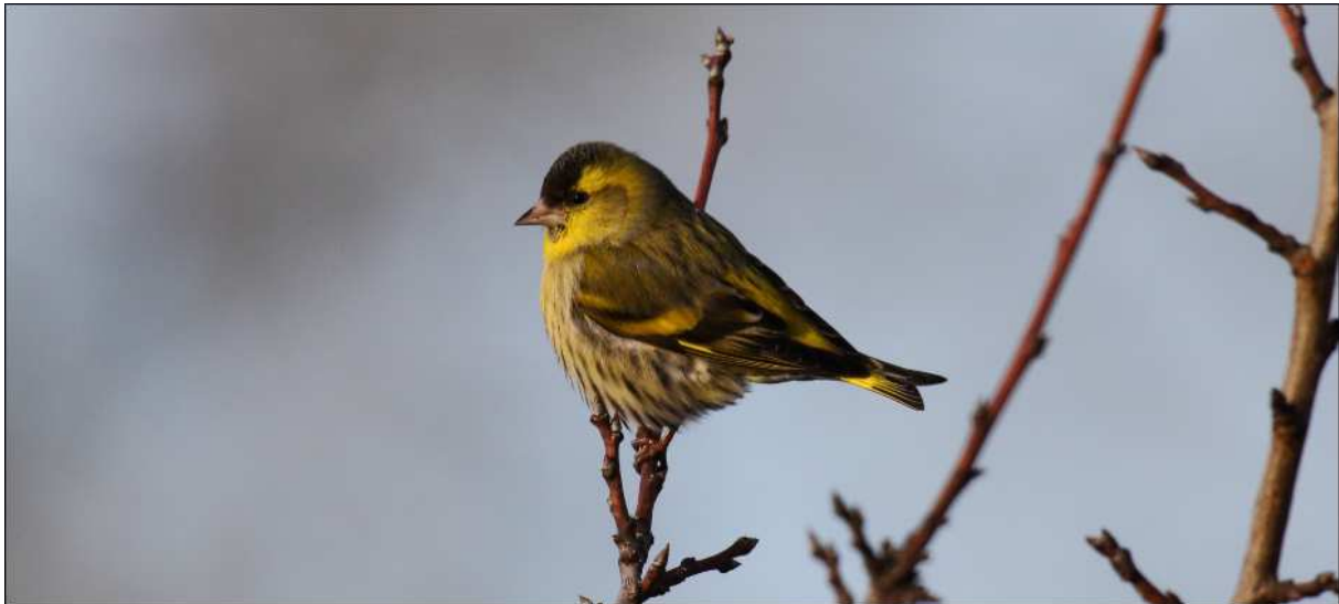
Abb. 3: 1.0 ad. Ind. Erlenzeisig Carduelis spinus ; Datum: 06.02.2019; Ort: Alfdorf