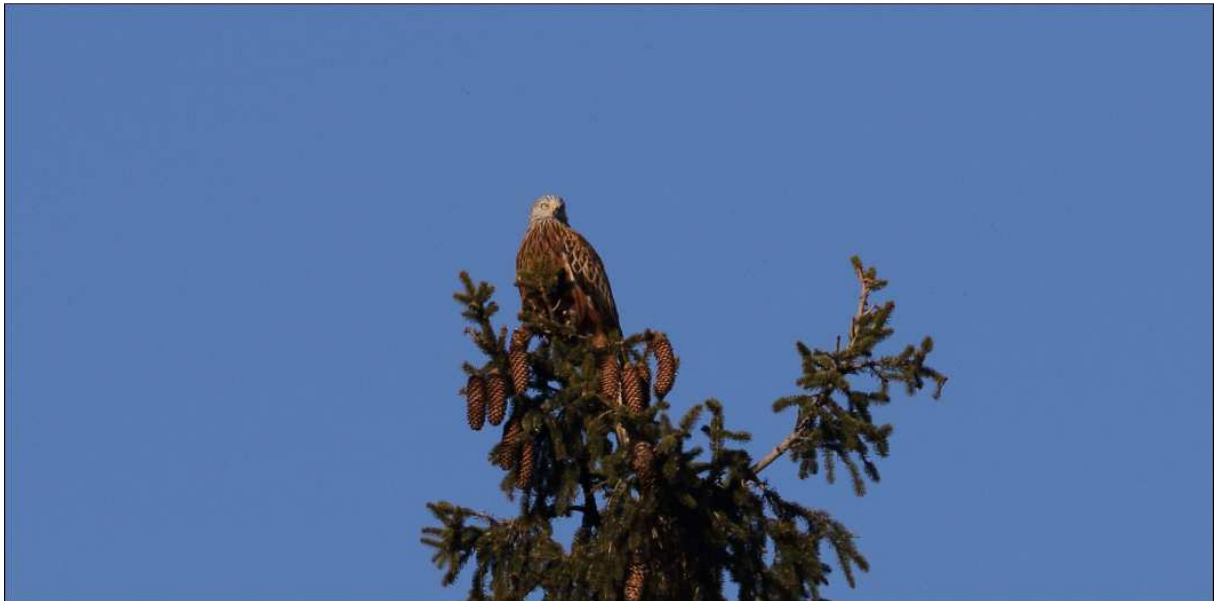
Abb. 1: 1 ad. Ind. Rotmilan Milvus milvus ; Datum: 17.02.2019; Ort: Alfdorf