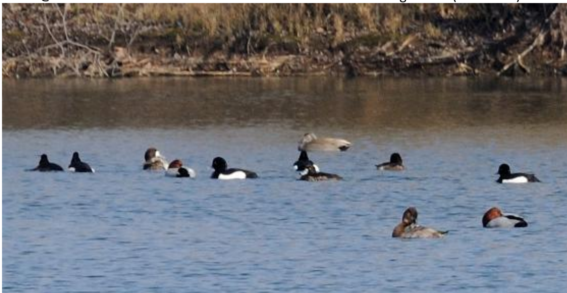
Eine Bergente (3. von links) in der Gesellschaft von Reiher- und Tafelenten. NSG Mechtersheimer Tongruben, 14.03.2012