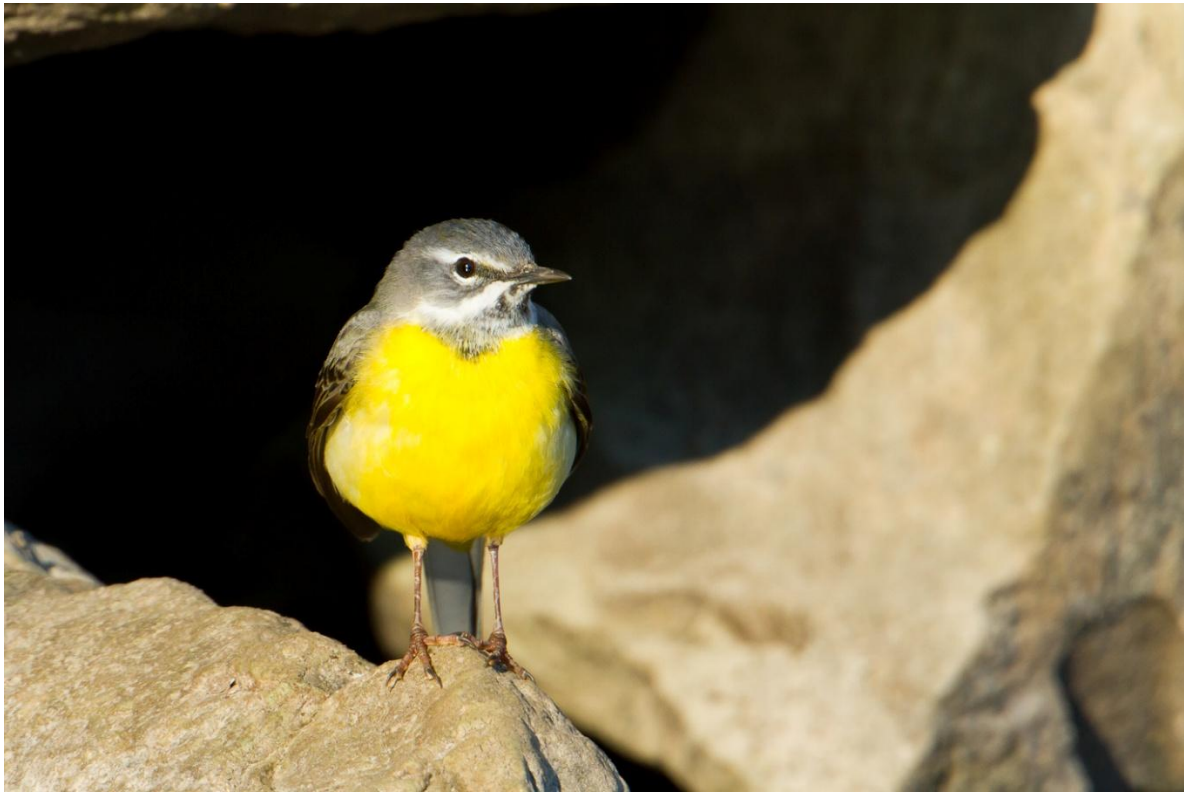
Gebirgsstelze, 26. März 2012