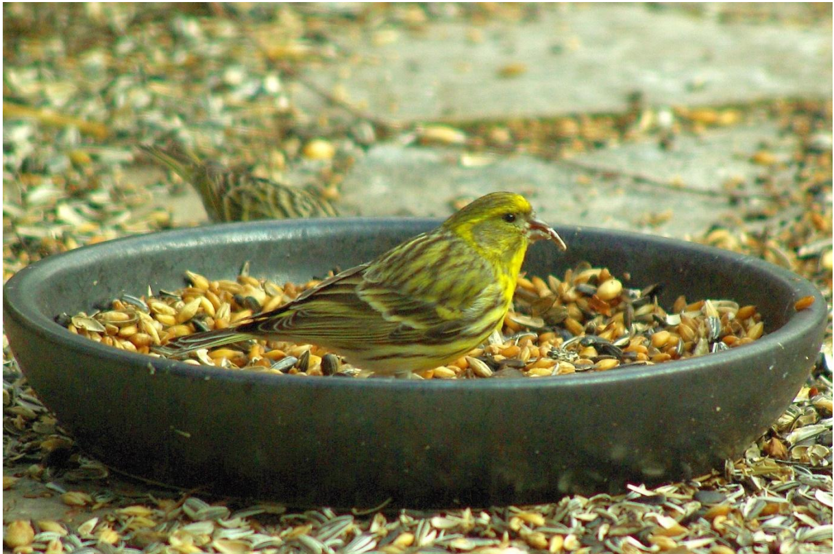
Girlitze am Futterplatz, Forst, KA, Frühjahr 2012