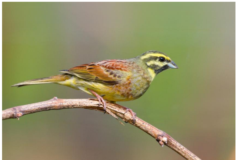
Zaunammer, Südbaden, 25. März 2012

2 B5. @1011936 25.3.12 Dossenheim_N, HD (Wolfgang Dreyer) 2 B3. @1040794 27.3.12 Schriesheim (HD) (Andreas Thiele) 1 A2. @1051686 29.3.12 Schriesheim (HD) (Michael Riffel)