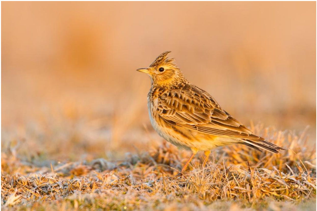
Feldlerche, 12.März.2012

Für alle Abbildungen liegt das Copyright © bei den Bildautoren!