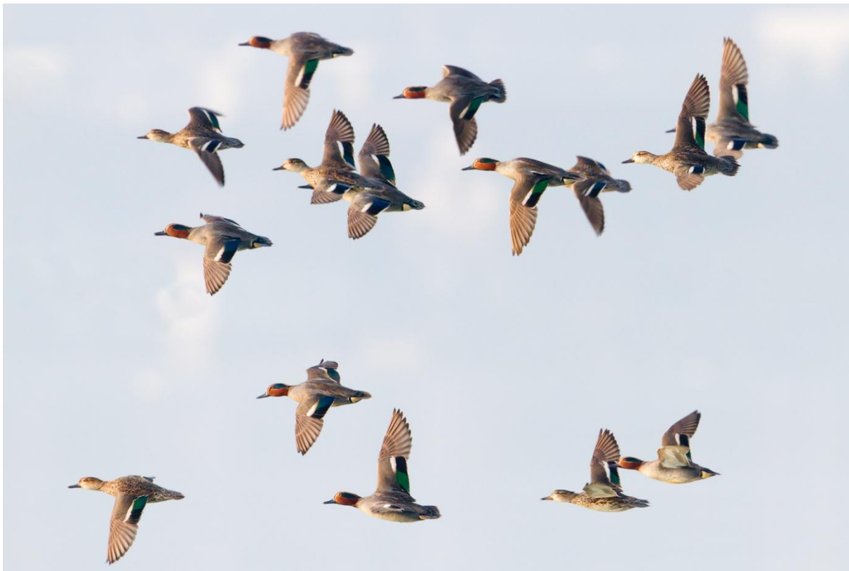
Krickenten im Flug, 24. März 2012