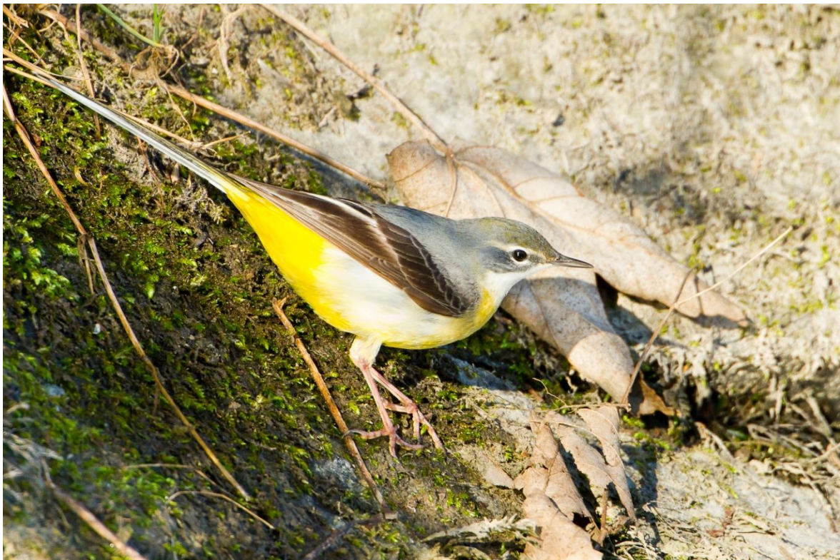
Gebirgsstelze, 26. März 2012