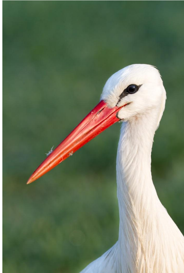
Weißstorch, 25. März 2012