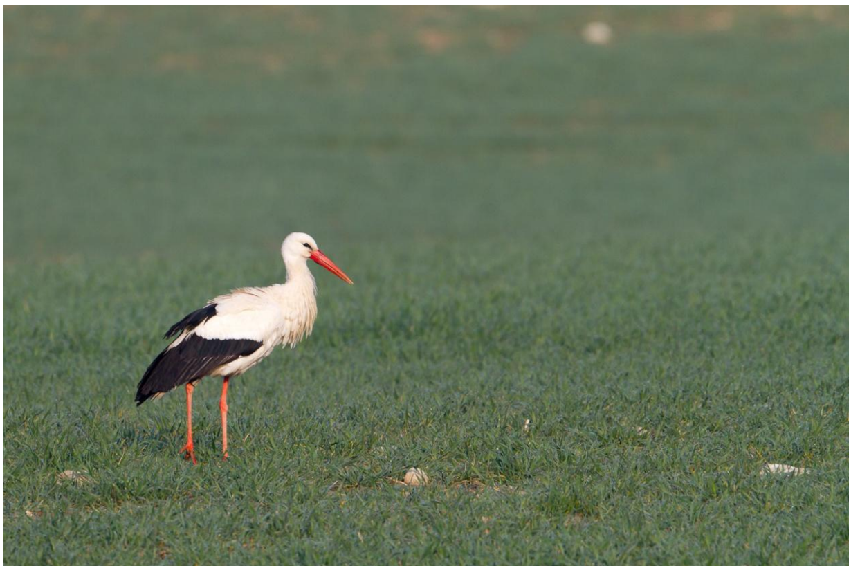
Weißstorch, 25. März 2012