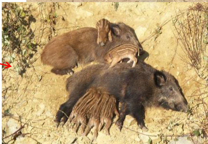
Steinbruch Leimen, HD, 5. Februar 2012

Viele Grüße aus Heidelberg, Armin Konrad