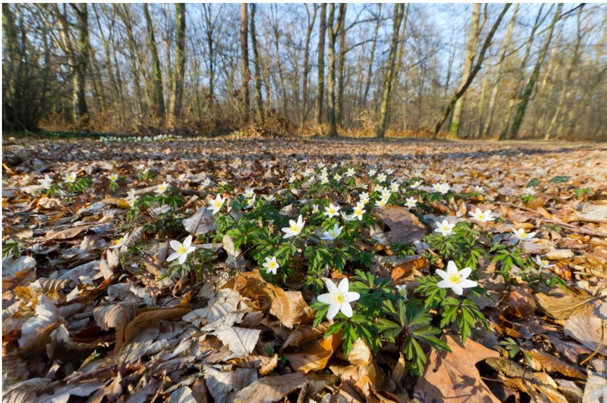
Frühlüher (Buschwindröschen) in der Rheinebene, 12.März.2012