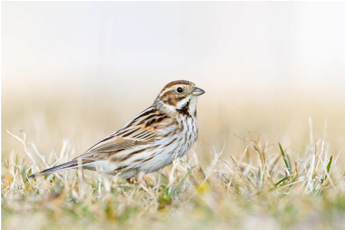
Rohrammer (oben) und Goldammer (unten), 24. März 2012