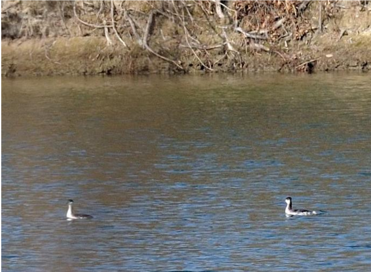
Zwei Ohrentaucher im Schlichtkleid, NSG Mecktersheimer Tongruben, 14. März 2012

1 Ind. 2.3. bis 9.3.2012 Mecktersheim (Tongruben), RP (E. Sefrin) 1 Ind. @812029 05.3.12 NSG "Mecktersheimer Tongruben" (A. Konrad) 2 Ind. 11.03- bis 17.03.2012 Mecktersheim (Tongruben), RP (E. Sefrin) 2 Ind. @894135 14.3.12 NSG "Mecktersheimer Tongruben" (A. Konrad) Die Ohrentaucher hatten im März noch das Schlichtkleid