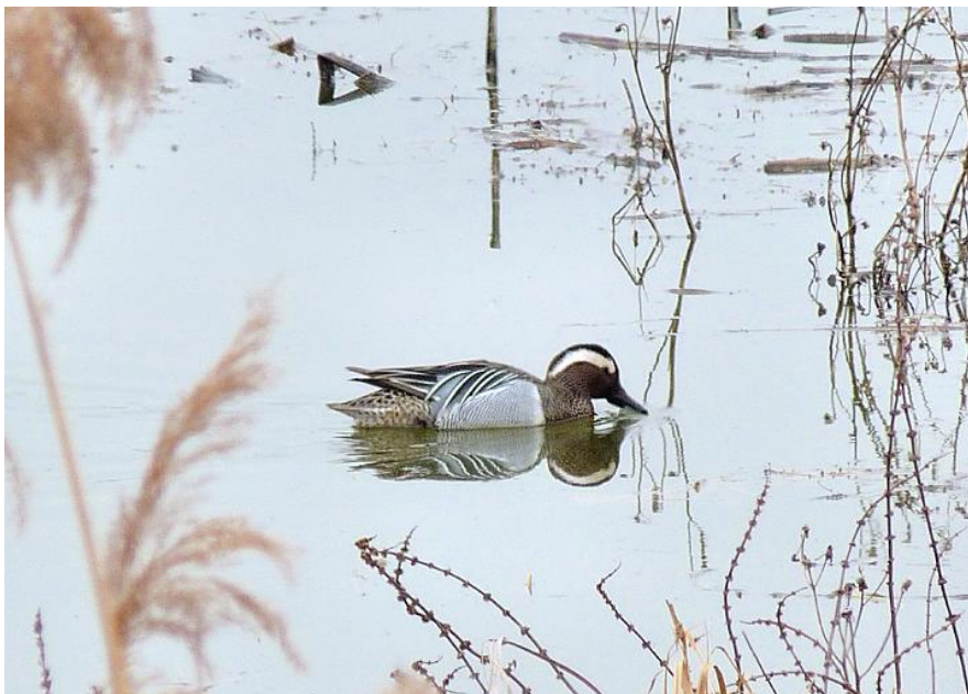
Knäkente; Wagbachniederung, KA 6. März 2012