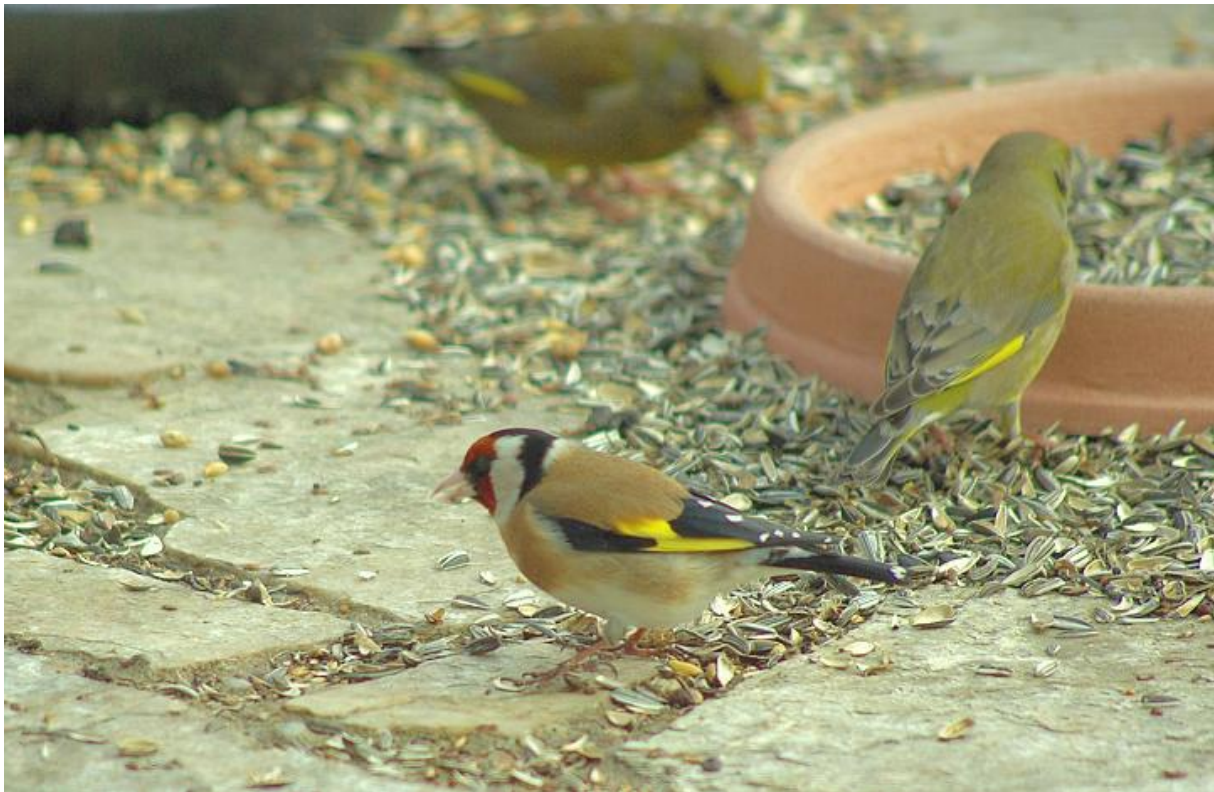
Distelfink und Grünfinken am Futterplatz, Forts, Frühjahr 2012