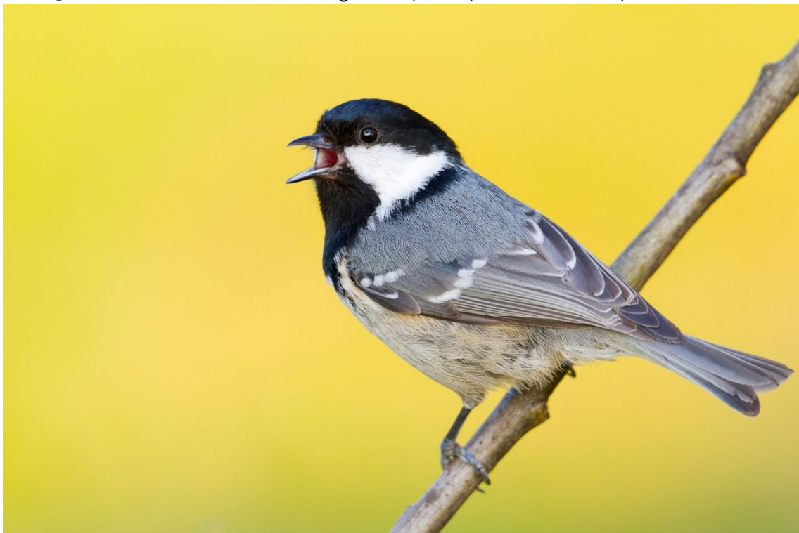
Singende Tannenmeise, 25. März 2012

1 Ind. @977009 17.3.12 Dossenheim (Weißer Stein), HD (Andreas Thiele) 2 A2. @921714 17.3.12 Ettlingen-Spessart_W, KA (Klaus Lechner) 4 Ind. @955136 17.3.12 Gernsbach-Kaltenbronn_O, RA (Steffen Tillmanns) 1 A2. @940443 18.3.12 Hardheim-Breitenau, MOS (Volker Probst) 1 Ind. @946921 18.3.12 Schefflenz (Weidach_S), MOS (Uli Boll) 1 A1. @941497 18.3.12 Mosbach_NW, MOS (Peter Baust) 1 M . UHR=11:47 21.3.12 Alpirsbach-Peterzell, FDS (M. Braun) 1 M . UHR=11:59 21.3.12 Alpirsbach-Römlinsdorf_O, FDS (M. Braun) 1 M . UHR=12:03 21.3.12 Alpirsbach-Römlinsdorf_O, FDS (M. Braun) 1 M . UHR=12:04 21.3.12 Alpirsbach-Römlinsdorf_O, FDS (M. Braun) 1 M . UHR=13:31 21.3.12 Dornhan_SW, RW (M. Braun) 1 M . UHR=13:32 21.3.12 Dornhan_SW, RW (M. Braun) 2 B5. @1096589 22.3.12 Maulbronn_W, PF (Joachim Sommer) 1 A2. @1001741 24.3.12 Adelsheim (Heidewiese), MOS (Martin Hochstein) 4 A2. @1013316 25.3.12 Schömburg-Bieselsbg_SW, CW (Franz Rothenhäusler) 2 A2. @1009355 25.3.12 Ettlingen-Spessart_W, KA (Klaus Lechner) 2 B3. @1011727 25.3.12 Ettlingen-Spessart_N, KA (Klaus Lechner) 2 Ind. @1042044 27.3.12 Bad Wildbad_SW, CW (Steffen Tillmanns) 4 Ind. @1050691 28.3.12 Bad Wildbad_SW, CW (Steffen Tillmanns) 5 B9. @1043261 28.3.12 Heidelberg (Hoher Nistler), HD (Klaus Hofmann) 12 A1. @1045673 28.3.12 Ettlingen-Spessart_W, KA (Klaus Lechner) 4 Ind. @1055081 29.3.12 Bad Wildbad_SW, CW (Steffen Tillmanns) 1 A2. @1072406 31.3.12 Adelsheim-Hergenstadt, MOS (Martin Hochstein)