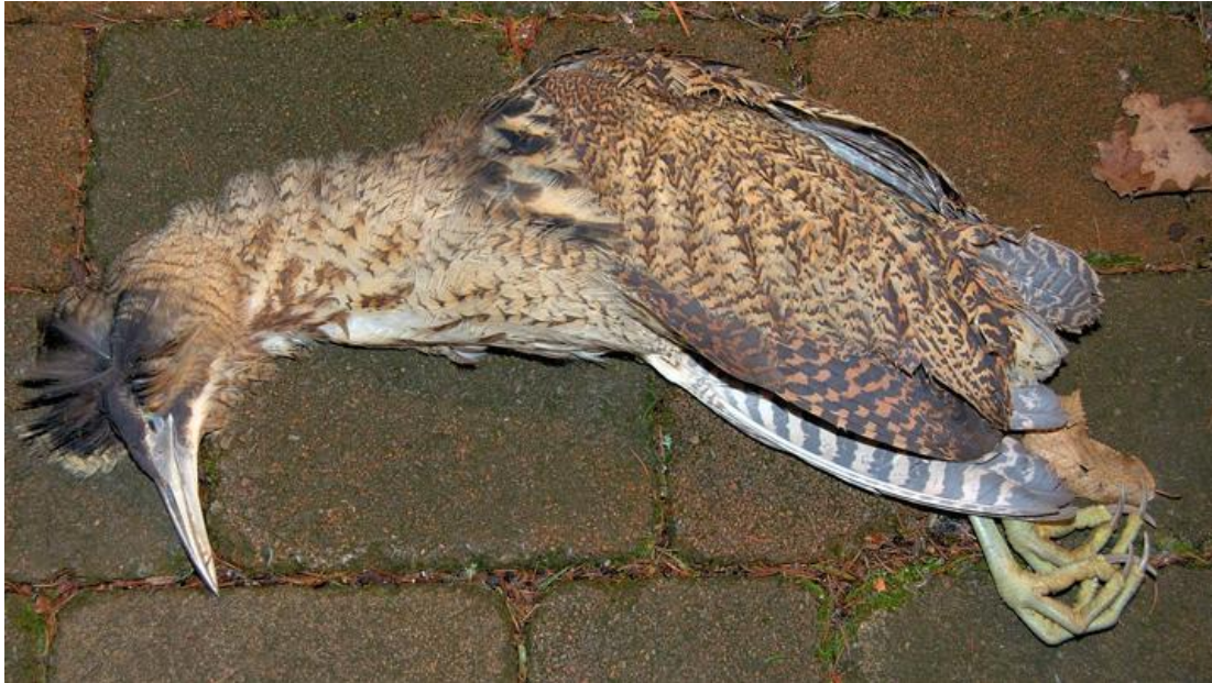
Rohrdommel, Totfund im Morretal bei Buchen-Hettigenbeuern, MOS