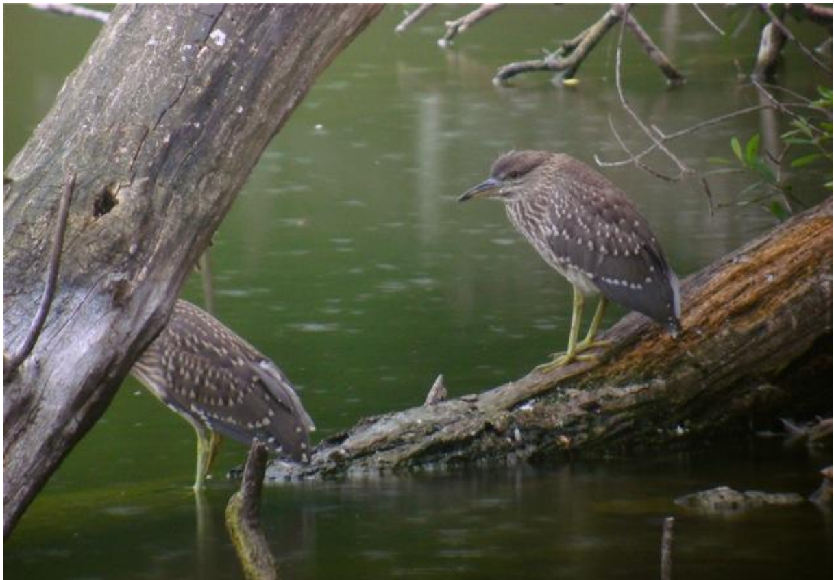
Zwei juv. Nachtreiher, 29.06.2011, Klärteiche Offenau