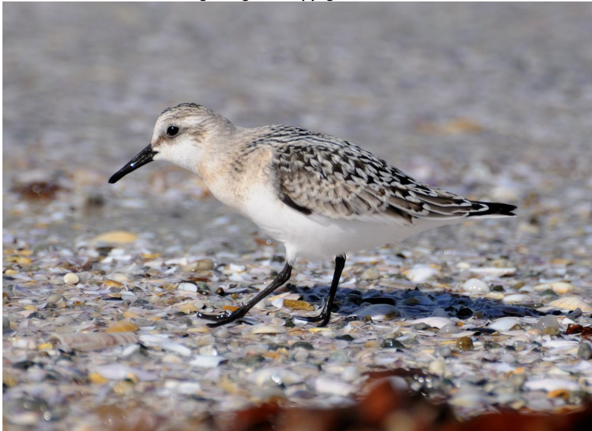
Sanderling, 28.08.2011, Bretagne (F)

Für alle Abbildungen liegt das Copyright © bei den Bildautoren!