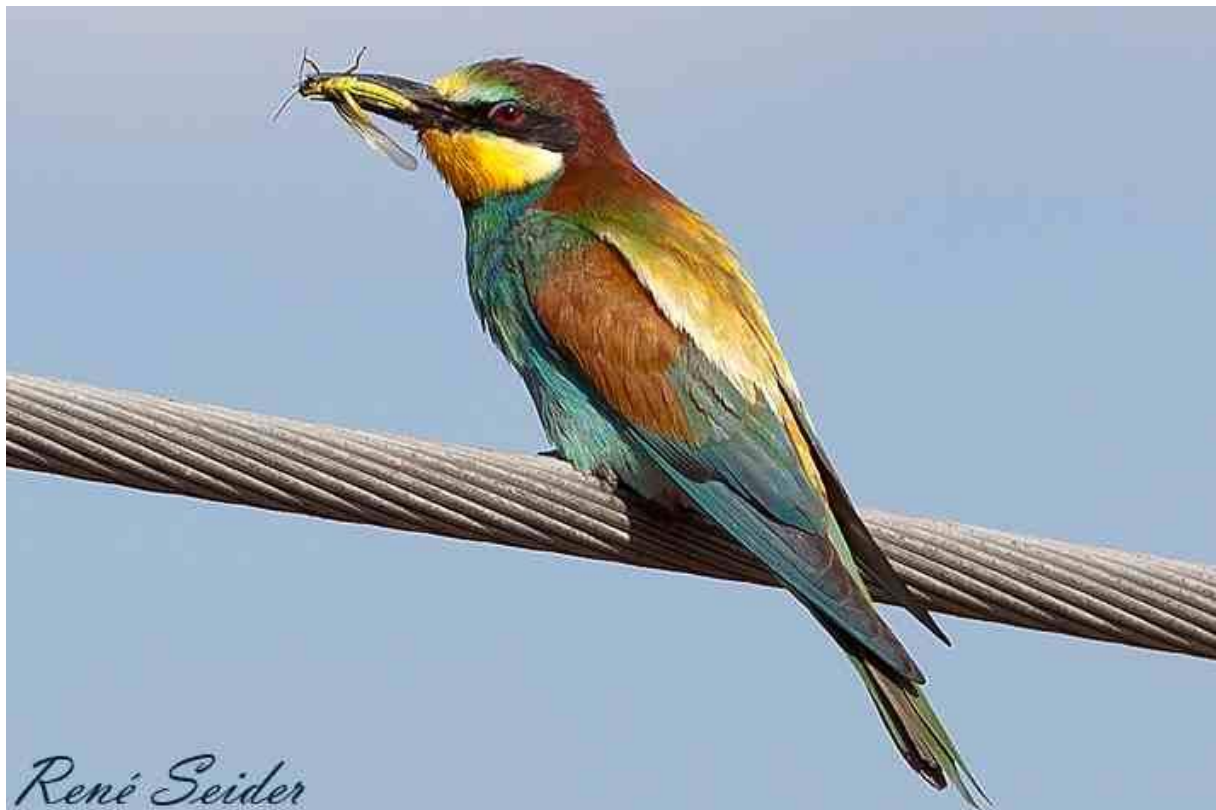
Bienenfresser, Aug. 2011, Worms-Pfeddersheim