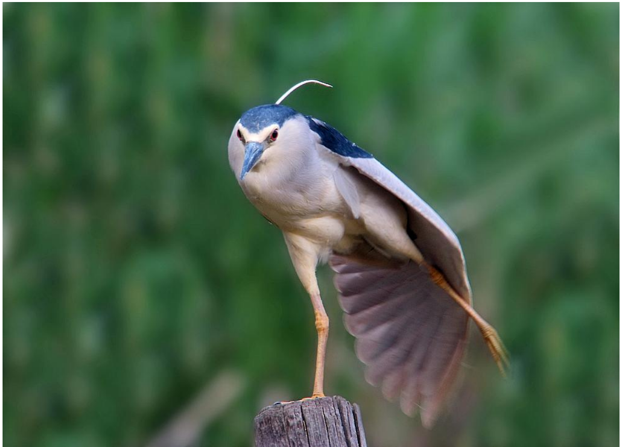
Nachtreiher, 26.07.2011, Roxheim (Silbersee), RP