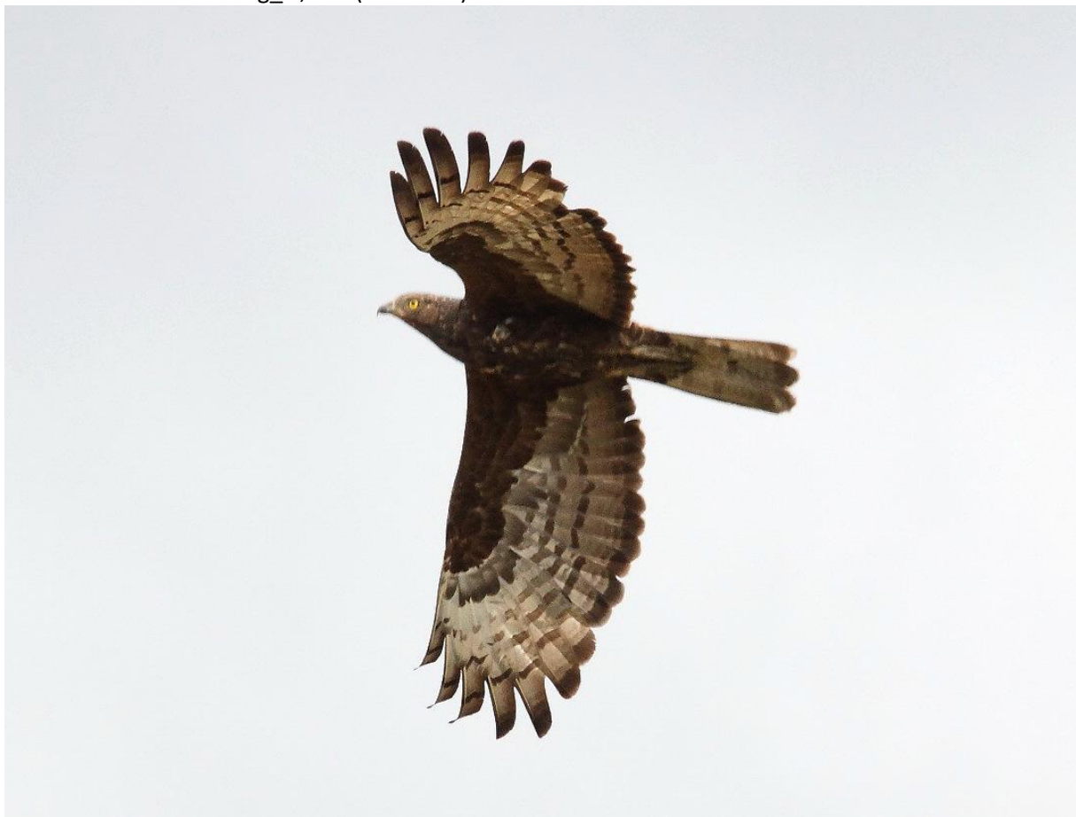
Wespenbussard, 30.07.2011, Niederstetten, TBB