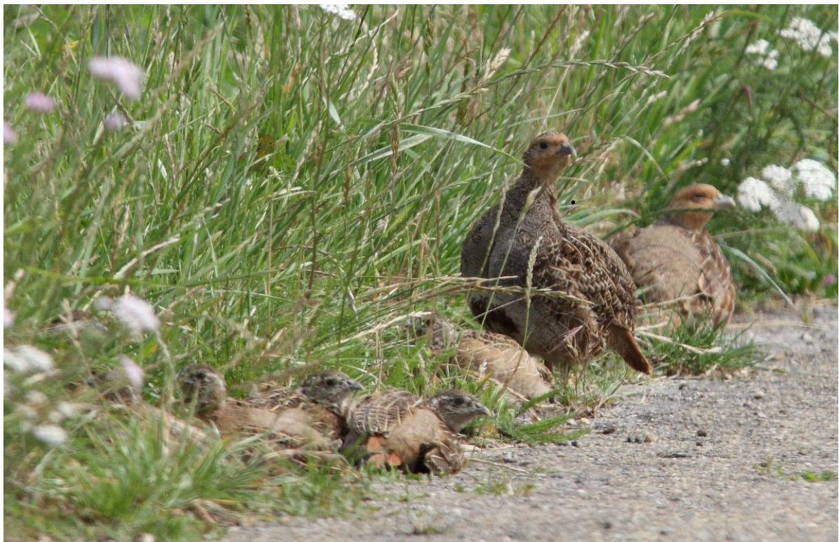
Rebhühner, 30.07.2011, Adolzhausen, TBB