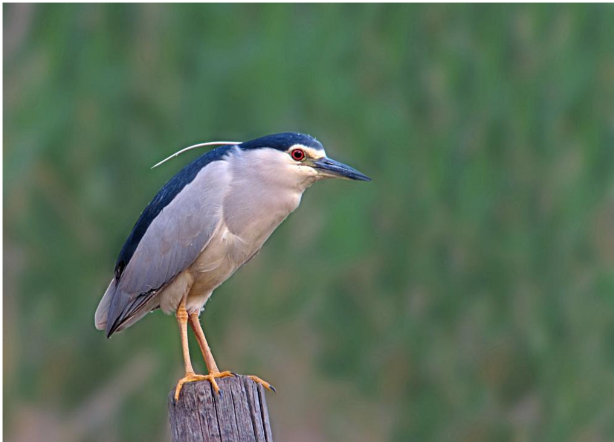
Nachtreiher, 26.07.2011, Roxheim (Silbersee), RP