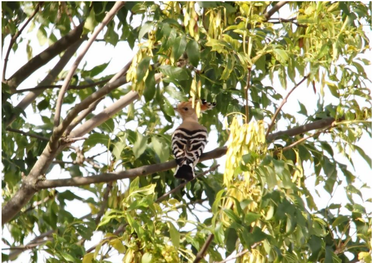
Wiedhopf in Esche, 14.08.2011 Bernsfelden, TBB