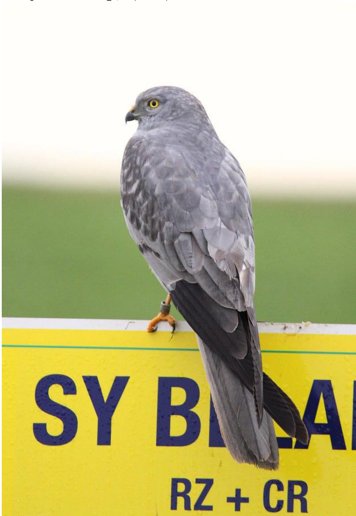
Wiesenweihe, 17.07.2011, Bernsfelden, TBB