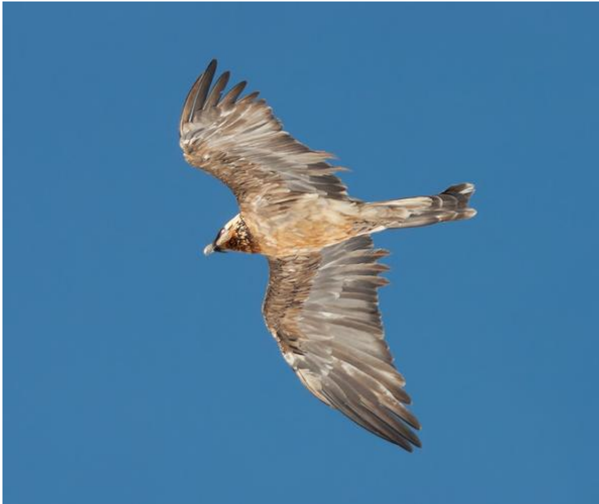
Bartgeier, eine aktuelle Beobachtung von den Allgäuer Alpen (Nebelhorn) 14.02.2011

Bartgeier ( Gypaetus barbatus ) sind die einzigen Vertreter der Gattung Gypaetus . Sie gehören zu den seltensten Greifvogelarten Europas ( ca. 100 Paare in Europa ) und mit einer Flügelspannweite von bis zu 2,9 m zu den größten flugfähigen Vögeln der Welt.