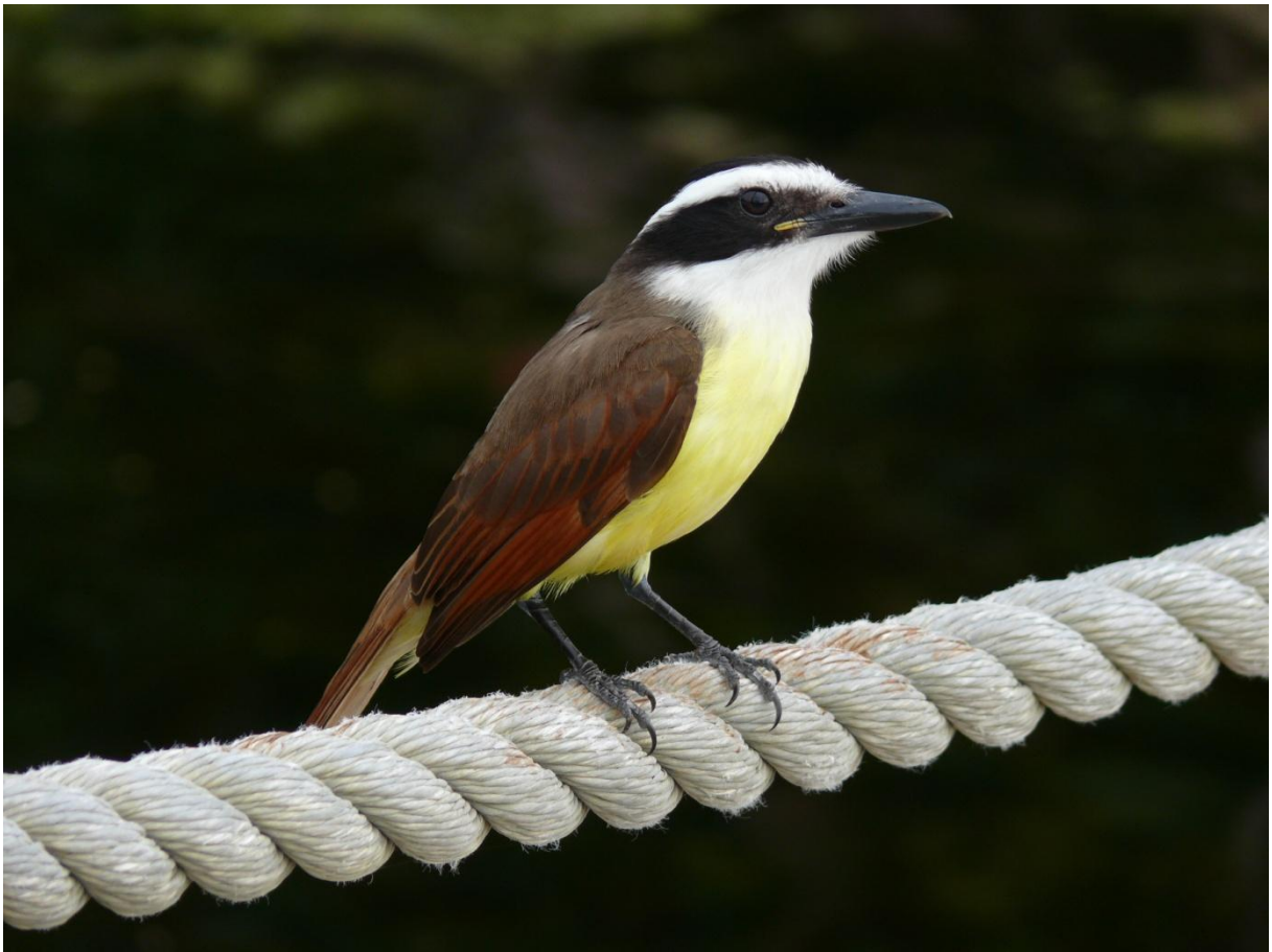
Schwefeltyrann ( Pitangus sulphuratus ) engl.: Great Kiskadee Fam.: Tyrannen (-Fliegenschnäpper) Xel-Ha, Mexiko Januar 2011