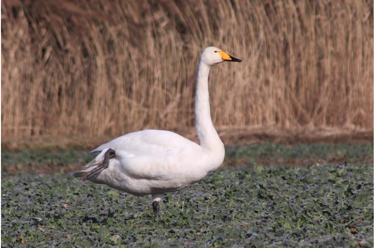
Singschwan auf Rapsfeld, Mauer, HD, 30.1.2011