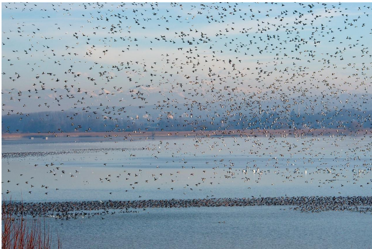
Vögel satt am Bodensee, Bucht zwischen Wollmatinger Ried und Radolfzell, Januar 2011