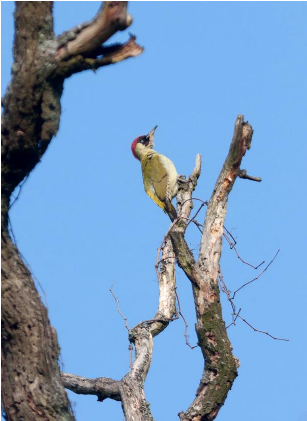
Grünspecht-Männchen, Karlsruhe, 31.01.2011