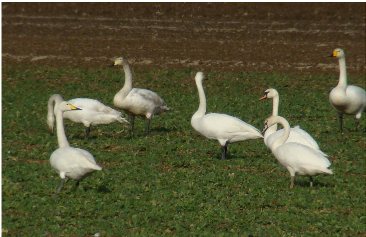
Sing-, Höcker- und Zwergschwäne auf Rapsfeld, Winzenbach (Elsass), 5.2.2011