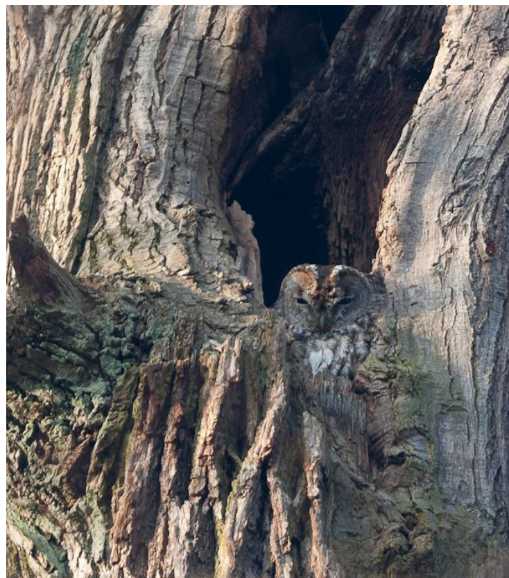
Waldkauz, gut getarnt, Karlsruhe, 31.01.2011