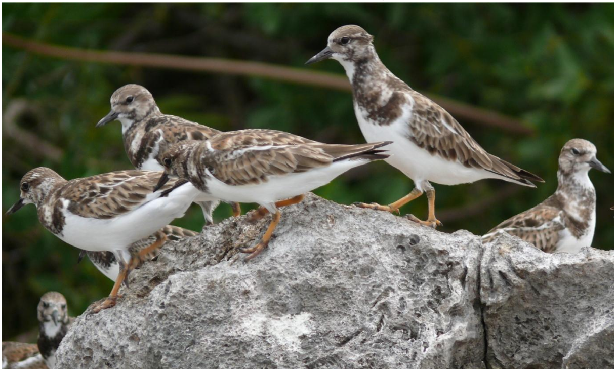
Steinwälzer ( Arenaria interpres ) im Schlichtkleid (engl.: Ruddy Turnstone) Xel-Ha, Mexiko Januar 2011