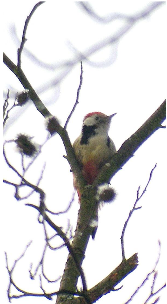
Mittelspecht, Walldorf, 3.1.2011