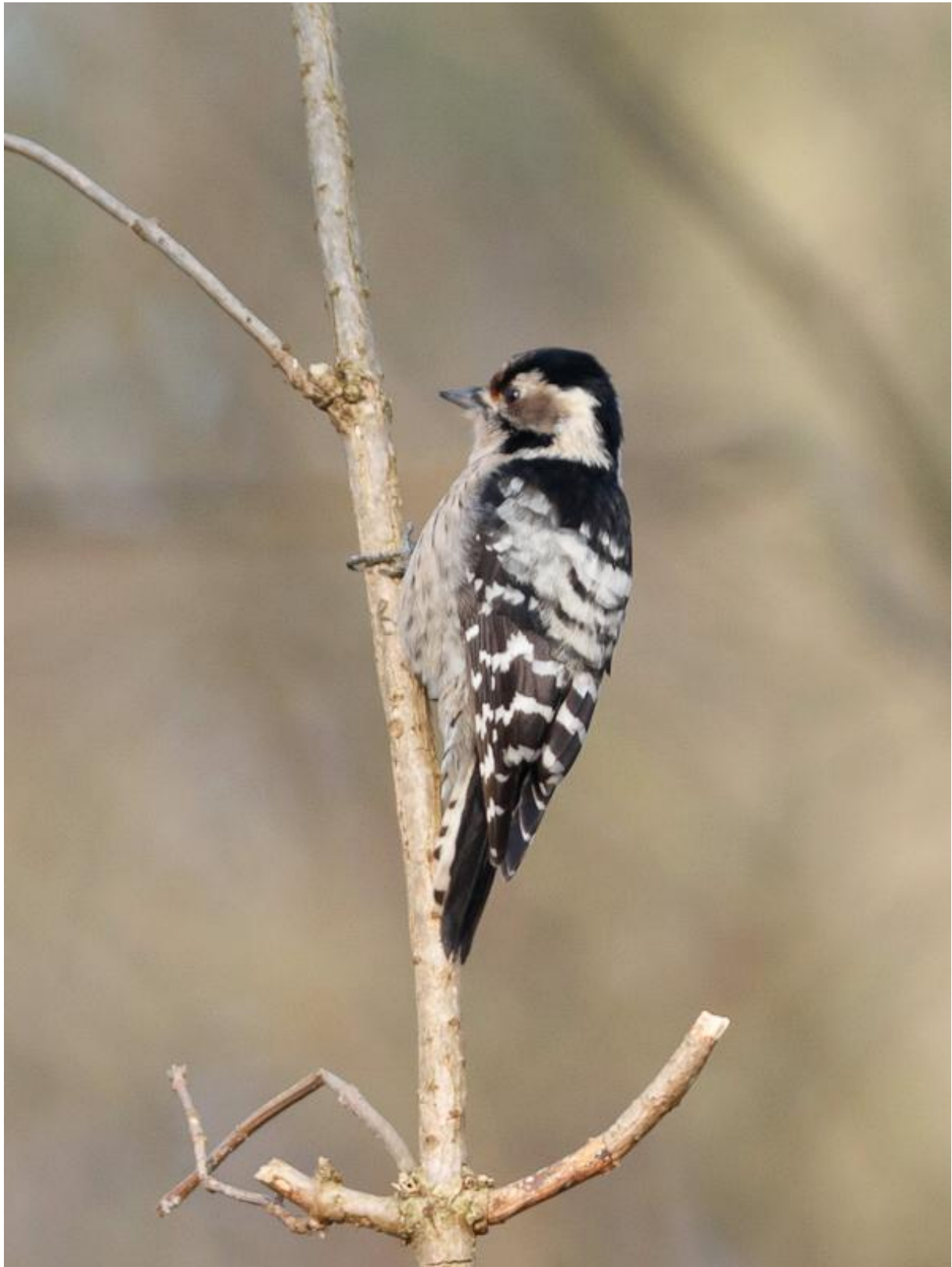
Weiblicher Kleinspecht auf Holunderzweig, Karlsruhe, 31.01.2011

1 W 31.1.11 Karlsruhe (Wildpark_O), KA