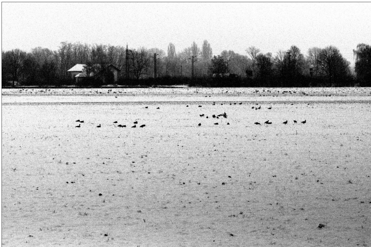
Winterstimmung mit Saatgänsen, Insultheimer Hof, HD, 03.01.2011

Mein besonderer Dank gilt wieder allen Vogelfreunden, die ihre Beobachtungen gemeldet haben. Sie sorgen so dafür, dass diese Bestandteil der OGBW-Gesamtdatenbank für Baden-Württemberg werden und nicht zuletzt teilen sie so auch die Freude an ihren schönen Beobachtungen mit uns allen. Außerdem gilt unser aller Dank den Fotografen, die uns mit ihren Bildern an schönen Erlebnissen teilhaben lassen!