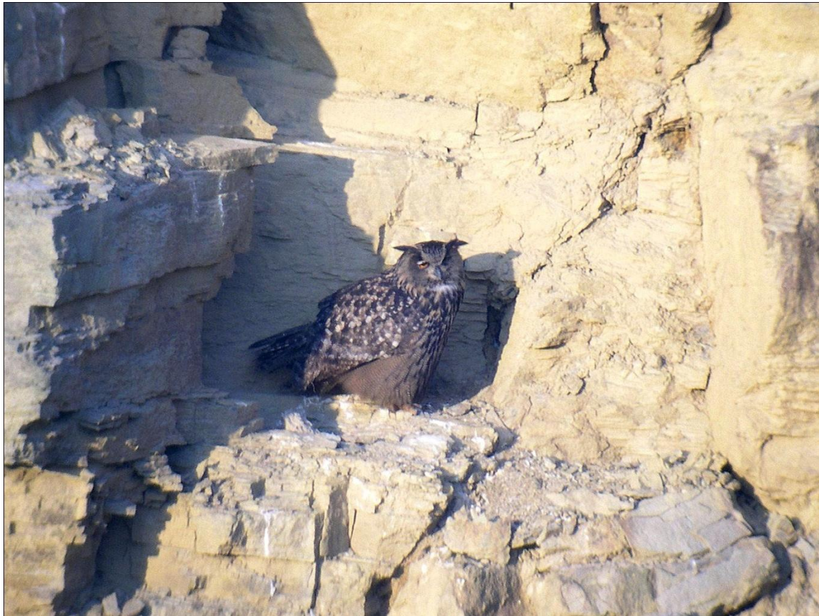
Uhu, Leimen, HD – 30.01.2011