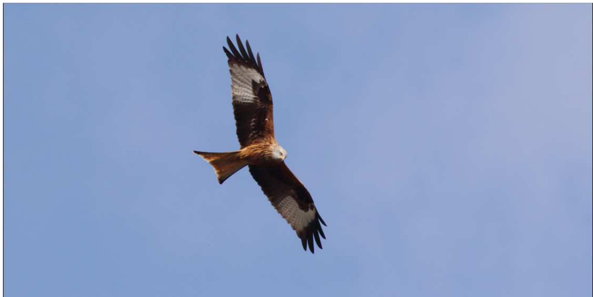
Abb. 3: 1 ad. Ind. Rotmilan Milvus milvus aufkreisend; Datum: 20.03.2016; Ort: Alfdorf