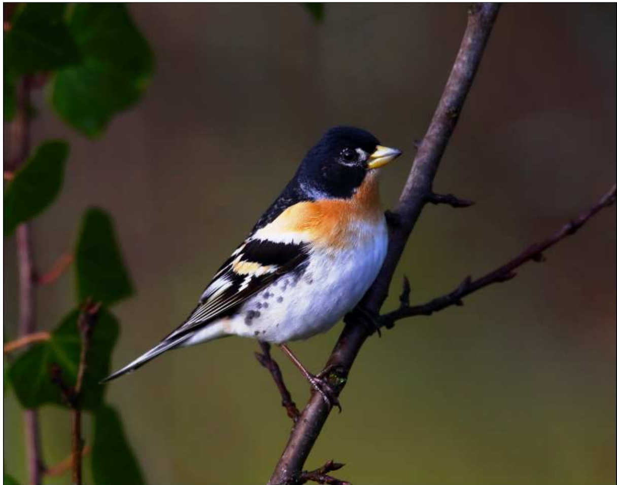
Titelphoto: 1.0 ad. Ind. Bergfink Fringilla montifringilla vom SK > PK wechselnd; Datum: 26.03.2016; Ort: Alfdorf

Der monatliche Rundbrief der Ornithologischen Arbeitsgemeinschaft Rems-Murr-Kreis ( OAG Rems-Murr-Kreis ) innerhalb der Ornithologischen Gesellschaft Baden-Württemberg ( OGBW ) dient dem Informationsaustausch aller ornithologisch am Landkreis Rems-Murr Interessierten. Der Rundbrief stellt eine zitierbare Veröffentlichung dar (Zitiervorschlag: OAG Rems-Murr-Kreis (20..): Ornithologischer Rundbrief Rems-Murr-Kreis Nr.). Alle an die OAG Rems-Murr-Kreis und deren kreisweiten OGBW- und ornitho.de-Regionalkoordinatoren übermittelten Beobachtungsdaten, werden auf Plausibilität geprüft, bei kreisweiter Bedeutung im Rundbrief veröffentlicht und an die OGBW- und OAG-Datenbank zur weiteren Auswertung überstellt.