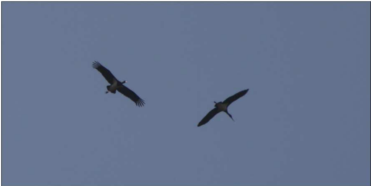
Abb. 1: 2 Ind. Schwarzstörche Ciconia nigra aufkreisend; Datum: 17.03.2016; Ort: Alfdorf