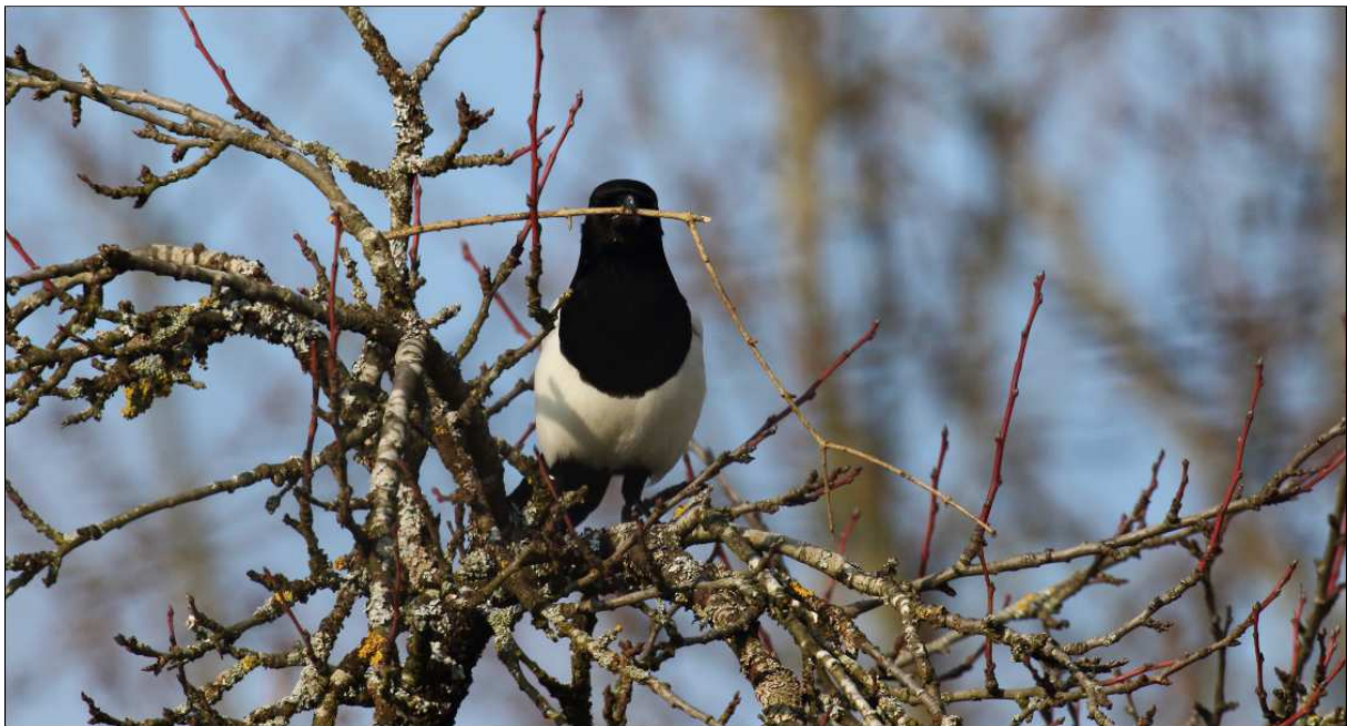
Abb. 4: 1 ad. Ind. Elster Pica pica Nistmaterial transportierend; Datum: 16.03.2016; Ort: Alfdorf