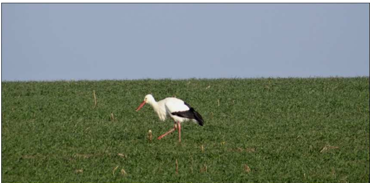
Abb. 2: 1 ad. Ind. Weißstorch Ciconia ciconia bei der Nahrungssuche; Datum: 17.03.2016; Ort: Heidenhof