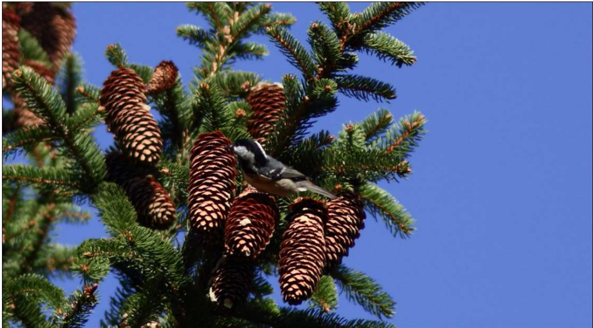
Abb. 4: 1 Ind. Tannenmeise Parus ater bei der Nahrungssuche an einem Fichtenzapfen. Das Photo zeigt eindrücklich wie die Samen aus den geöffneten Schuppen eines Zapfen von der Art hervorgeholt werden können. Die so gewonnenen Fichtensamen stellen eine wichtige Winternahrung der Tannenmeise Parus ater dar; Datum: 15.11.2015; Ort: Alfdorf