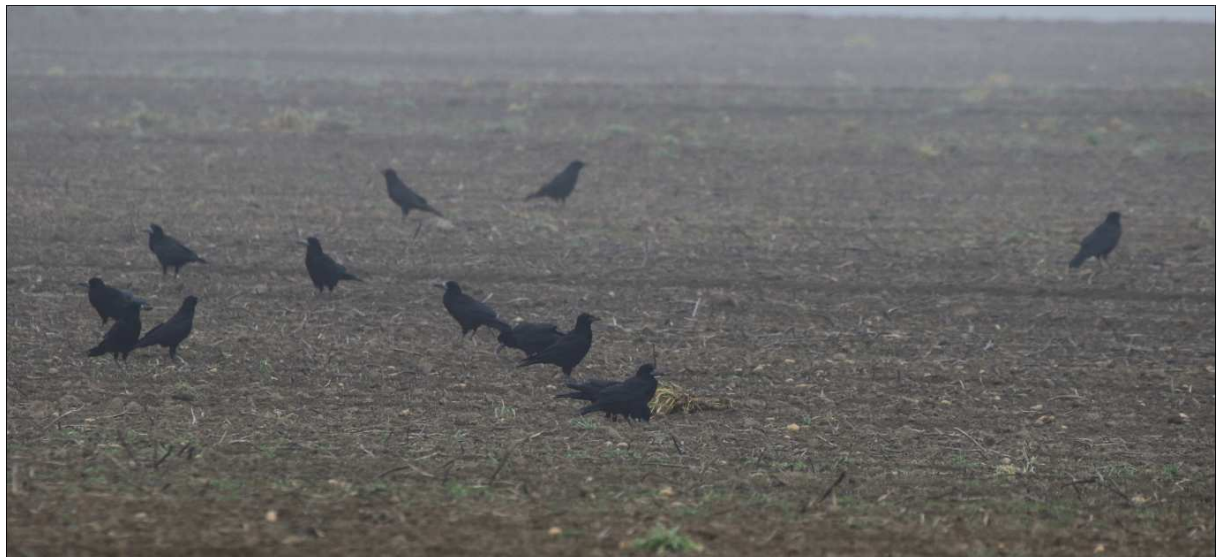
Abb. 3: 13 Ind. Saatkrähen Corvus frugilegus bei der Rast auf einer Ackerfläche. Man beachte das beim Jungvogel in der Bildmitte noch nicht vorhandene arttypische Gesichtsfeld für Altvögel; Datum: 01.11.2015; Ort: Alfdorf