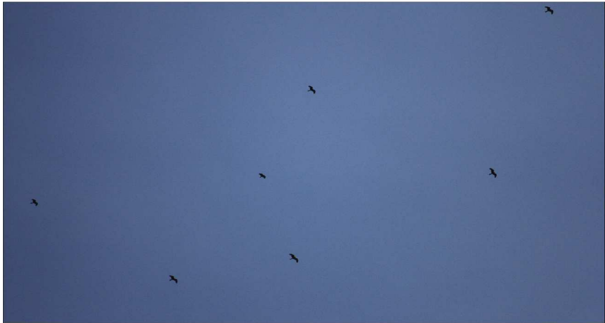
Abb. 2: 6 Ind. Rotmilane Milvus milvus und 1 Ind. Mäusebussard Buteo buteo in einem Zugverband; Datum: 24.11.2015; Ort: Haubersbronn