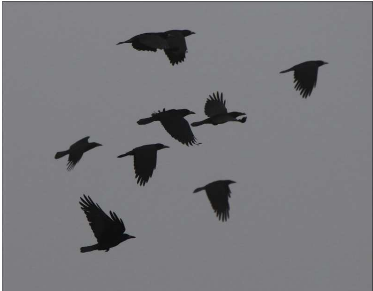
Titelphoto: 9 Ind. Saatkrähen Corvus frugilegus ; Datum: 01.11.2015; Ort: Alfdorf

Der monatliche Rundbrief der Ornithologischen Arbeitsgemeinschaft Rems-Murr-Kreis ( OAG Rems-Murr-Kreis ) innerhalb der Ornithologischen Gesellschaft Baden-Württemberg ( OGBW ) dient dem Informationsaustausch aller ornithologisch am Landkreis Rems-Murr Interessierten. Der Rundbrief stellt eine zitierbare Veröffentlichung dar (Zitiervorschlag: OAG Rems-Murr-Kreis (20..): Ornithologischer Rundbrief Rems-Murr-Kreis Nr.). Alle an die OAG Rems-Murr-Kreis und deren kreisweiten OGBW- und ornitho.de-Regionalkoordinatoren übermittelten Beobachtungsdaten, werden auf Plausibilität geprüft, bei kreisweiter Bedeutung im Rundbrief veröffentlicht und an die OGBW- und OAG-Datenbank zur weiteren Auswertung überstellt.