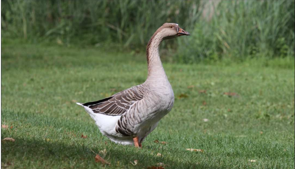
Abb. 1: 1 Ind. Grau- x Höckergans Hybrid; Datum: 10.11.2015; Ort: Plüderhausen