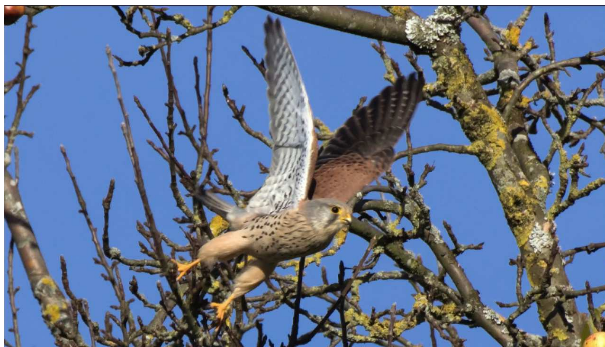
Abb. 1: 1.0 ad. Ind. Turmfalke Falco tinnunculus im Abflug; Datum: 16.12.2013; Ort: Reichenberg