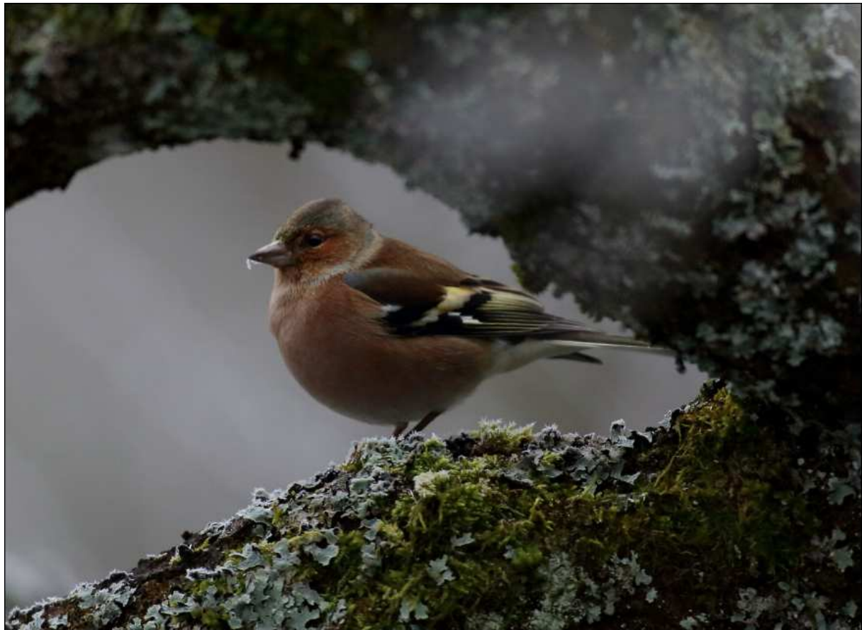
Titelphoto: 1.0 ad. Ind. Buchfink Fringilla coelebs im SK; Datum: 04.12.2013; Ort: Alfdorf

Der monatliche Rundbrief der Ornithologischen Arbeitsgemeinschaft Rems-Murr-Kreis (OAG Rems-Murr-Kreis) innerhalb der Ornithologischen Gesellschaft Baden-Württemberg (OGBW) dient dem Informationsaustausch aller ornithologisch am Landkreis Rems-Murr Interessierten. Er stellt keine formale Veröffentlichung dar und ist somit nicht wissenschaftlich zitierbar. Alle an die OGBW-Regionalkoordinatoren Rems-Murr-Kreis übermittelten Beobachtungsdaten, werden auf Plausibilität geprüft, bei kreisweiter Bedeutung im Rundbrief veröffentlicht und an die Dokumentationsstelle für die Avifauna Baden-Württemberg zur weiteren Auswertung überstellt.