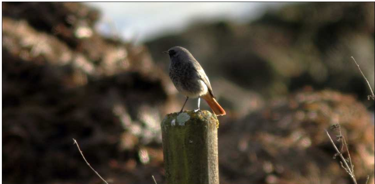
Abb. 2: 1.0 ad. Ind. Hausrotschwanz Phoenicurus ochruros im SK; Datum: 29.12.2013; Ort: Alfdorf