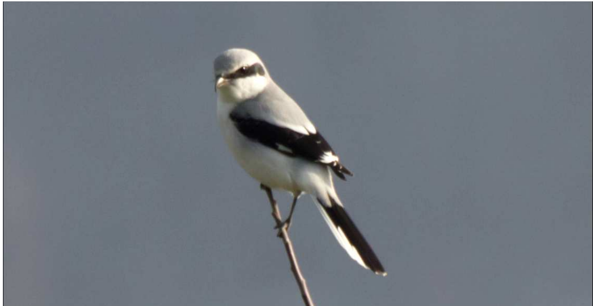
Abb. 3: 1 ad. Ind. Raubwürger Lanius excubitor ; Datum: 03.12.2013; Ort: Oppenweiler